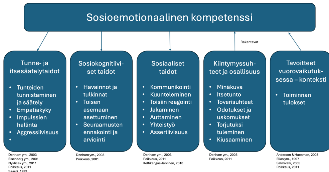
Kuvio 1. Sosioemotionaalinen kompetenssi alakäsitteineen Rose-Krasnorin (1997) mallia mukailleen (Hintikka 2016, 23; Kiviluote 2019, 15).

Sosiaaliset taidot tarkoittavat ensisijaisesti käyttäytymistä, joka huomioi toiset ja jonka avulla menestytään vuorovaikutus- ja yhteistoimintatilanteissa.