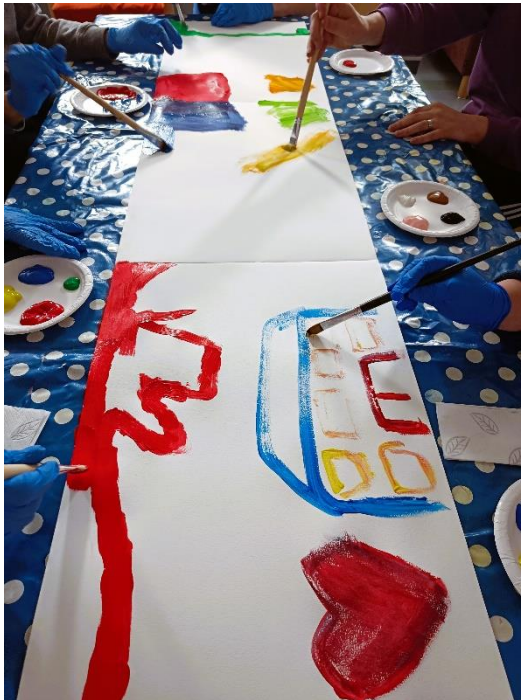
Kuva 5: Akryliväreillä maalaamista yhteisen paperin äärellä

Viimeisenä taidetyöskentelynä tehtiin yhteismaalaus isolle paperille. Iso paperi rakennettiin teippaamalla maalarinteipillä kolme A2-paperia yhteen. Maalauksen aihetta hetken pohdittuaan osallistujat valitsivat yhteistuumin aiheeksi ystävyiden ja nykyisen kodin. Valittuaan mieluisat värit osallistujat alkoivat maalata keskittyneesti. Tunnelma oli rauhallinen ja hyvätuulinen, välillä syntyi yleistä keskustelua. Osallistuja, joka hakeutui aiemmissa taidetuokioissa oman pöydän ääreen työskentelemään, tuli tällä kertaa muiden kanssa saman pöydän ääreen ja osallistui yhteismaalaukseen.