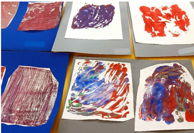
Kuva 1: Ensimmäisessä taidetuokiossa syntyneitä teoksia. Taiteilijoiden nimet on peitetty.

Osallistujat työskentelivät omaan tahtiinsa. Ohjeistusta annettiin sekä yhteisesti että yksilöllisesti sen mukaan, missä työskentelyvaiheessa kukin oli menossa. Toiset osallistujista työskentelivät alusta loppuun hyvinkin itsenäisesti, kun taas osa tarvitsi ohjaajan apua esimerkiksi värien annostelussa, paperin painamisessa laatalle, saksien käytössä sekä työn liimaamisessa taustakartongille. Kaikki osallistujat työskentelivät aktiivisesti ja vaikuttivat olevan innostuneita. Kaikki halusivat myös tehdä useamman vedoksen ja valitsivat niistä lopulliseen työhönsä joko yhden tai useamman. Valitut vedokset liimattiin taustakartongille. Tekemisen ohessa käytiin aktiivista keskustelua ja vitsailtiin hyväntuulisesti. Osallistujat myös esittelivät teoksiaan toisilleen ja kehuivat sekä omia että toistensa töitä.