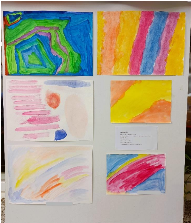
Kuva 9: Musiikkimaalaus . Neljännen taidetuokion teokset näyttelyssä. Taiteilijoiden nimet on peitetty.