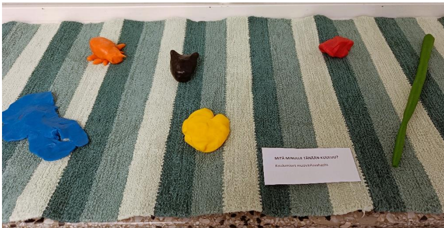
Kuva 10: Mitä minulle tänään kuuluu? Viidennen taidetuokion virittäytymisessä tehdyt kuulumiset muovailuvahasta.