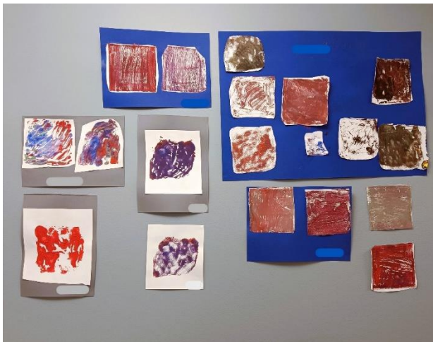
Kuva 6: Mielenmaisema . Ensimmäisen taidetuokion teokset näyttelyssä. Taiteilijoiden nimet on peitetty.

Tilaisuuden aluksi pidin lyhyen kiitospuheen, jossa kiitin kaikkia opinnäytetyön mahdollistaneita tahoja, ennen kaikkea taidetuokioihin osallistuneita asukkaita. Nostimme yhdessä maljan taiteilijoille ja taideteoksille. Tämän jälkeen kerroin lyhyesti jokaisesta taidetuokiosta ja teoksista yhdessä asukkaiden kanssa. Lopuksi tilassa sai kiertää vapaasti teoksia katsellen ja niistä keskustellen. Näyttelyssä oli tarjolla pientä purtavaa ja juomaa. Lisäksi tilassa oli esillä kartonki, joka toimi vieraskirjana. Siihen sai kirjoittaa kiitoksia ja tervehdyksiä taiteilijoille.