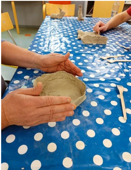
Kuva 3: Saven muotoilua.

Jotta savea pystyi muotoilemaan, sitä piti ensin pehmittää heittämällä sitä toistuvasti lattialle liinan päälle. Jotkut osallistujat innostuivat saveen heittämisestä, kun taas osa halusi ohjaajan auttavan heitä saveen pehmittämisessä. Pehmittämisen jälkeen kaikki osallistujat upoutuivat saveen muovailuun. Välillä työskentelyn ohessa heräsi yleistä keskustelua. Osallistujat työskentelivät pääasiassa itsenäisesti, mutta tarvittaessa autettiin yksityiskohdissa, kuten koiran hännässä tai härän sarvissa. Auttamisella pyrittiin ehkäisemään teoksen halkeamista kuivumisvaiheessa: esimerkiksi varmistettiin, että jalat ja hännät ovat tarpeeksi paksut ja huolellisesti kiinnitetyt.