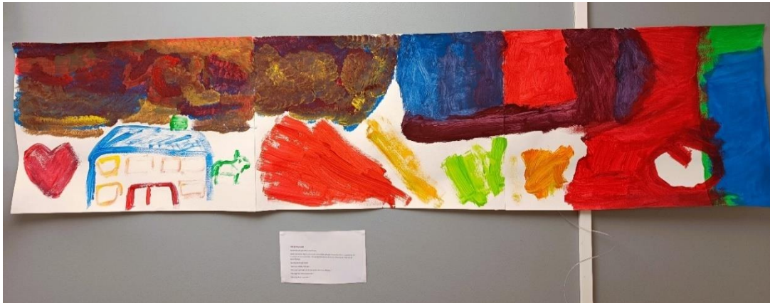
Kuva 11: Yhteismaalaus . Viidennen taidetuokion teos näyttelyssä.

Näyttelyssä oli lämmin, iloinen ja yhteisöllinen tunnelma. Asukkaat osallistuivat aktiivisesti keskusteluun taidetuokioista ja teoksista. Asukkaat kertoivat kokemuksistaan ja esittelivät teoksiaan. Taidenäyttely toimi hyvin taidetuokioiden prosessin päätöstilaisuutena ja tarjosi osaltaan lisää arvostuksen ja yhteisöllisyyden kokemuksia tuokioihin osallistuneille asukkaille. Teosten juhlistaminen yhdessä antoi tilaa asukkaiden nähdä ja kuulla tulemiselle myös heidän luomiensa teosten muodossa. Yhteinen juhlava päätöstilaisuus oli mahdollisuus juhlistaa teosten lisäksi myös ryhmäkodin asuinyhteisöä ja se saattoi synnyttää uusia tärkeitä muistoja, joita asukkaat voivat muistella myöhemmin uusissa kodeissaan.