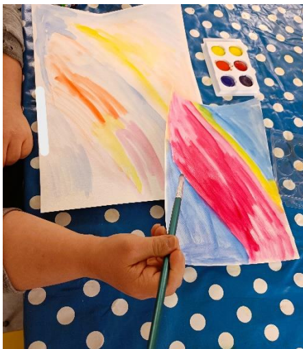
Kuva 4: Vesivärimaalausta musiikin tahtiin. Taiteilijan nimi peitetty.

Osallistujat maalasivat keskittyneesti ja musiikkia kuunnellen. Osalla musiikin vaikutus siveltimen käyttöön näkyi selvästi, toisilla vaikutus ei ollut silmin havaittavissa. Osallistujat kommentoivat välillä musiikkia, mutta muuten työskentely eteni ilman keskustelua. Maalaamisen loppuvaiheessa osallistujat pysyivät mahdollisuutta kuunnella omia toivekappaleita. Jokainen sai toivoa vuorotellen omaa toivekappalettaan ja osa innostui toivomaan useammankin kappaletta. Osallistujat jäivät tilaan kuuntelemaan musiikkia vielä pitkäksi aikaa sen jälkeen, kun olivat saaneet maalauksensa valmiiksi.