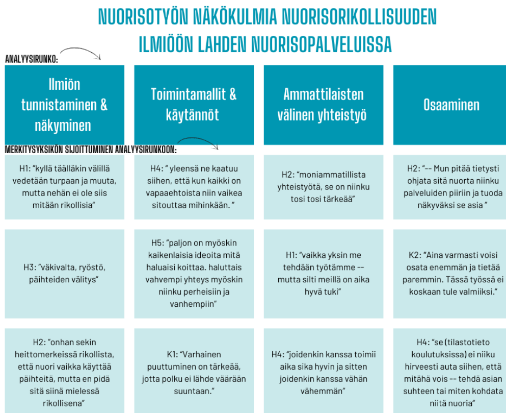
Kuva 2. Esimerkki merkitysyksikköjen sijoittumisesta analyysirunkoon: koodattu aineisto

oli syntynyt. Jokainen analyysirunkoon poimittu ajatuskokonaisuus tai monivaihtokysymyksen vastaus asetettiin sille sopivan kategorian alle, ja tästä muodostui lopulta niin sanottu koodattu aineisto (kuva 2). Koodatulla aineistolla tarkoitetaan, että aineisto on järjestetty uusiksi ja epäolennainen teksti sekä vastaukset ovat karsituneet pois (Saaranen-Kauppinen & Puusniekka 2009, 80–81).