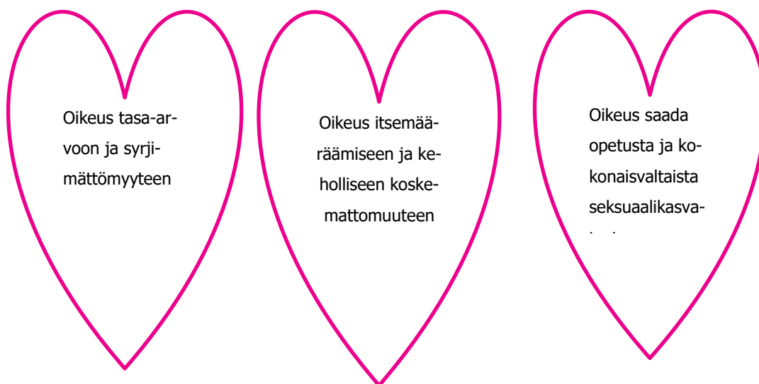
Kuva 1. Seksuaalioikeudet

World association for Sexual Health (WAS 2014) on laatinut 16 seksuaalisuutta koskevaa ihmisoikeutta. Jokaisen on oikeus saada opetusta ja kokonaisvaltaista seksuaalikasvatusta. Seksuaalikasvatuksen on oltava tietoon perustuvaa. Jokaisella on oikeus tietoon. Tietoa ei kuulu sensuroida eikä mielivaltaisesti rajoittaa. (WAS 2014) Työmme kannalta tärkeimmät kuvaamme oheisessa kuvassa (Kuva 1).