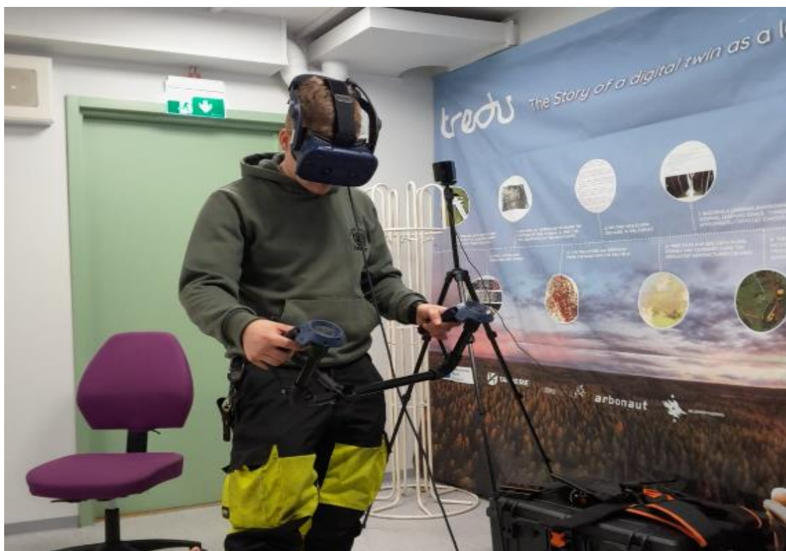
Kuva 2 Raivaussahasimulaattori

Käyttäjäkohtaista edistymistä voidaan seurata SimTrainer-ohjelmistolla. Se sisältää useita erilaisia simulaattoriharjoitusta, joissa käydään läpi työskentelyn eri osa-alueita. Simulaattorilla voidaan harjoitella myös työskentelyn tehostamista todellisuutta vastaavissa tilanteissa. Suoritusraportista käy ilmi onko käyttäjän suoritus hyväksytty vai hylätty, se antaa myös pisteytyksen käyttäjän toiminnasta harjoituksen aikana. (Creanex n.d.).