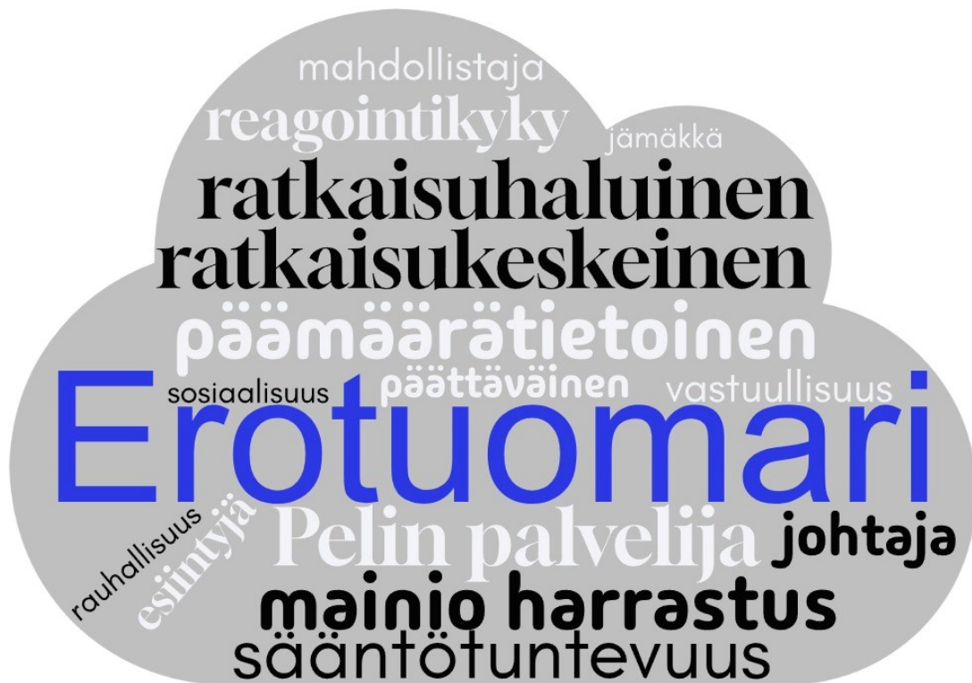
Kuva 2, Sanapilvi

Molemmissa haastatteluissa käytettiin alussa orientoitumistehtävänä sanapilveä. Osallistujat saivat listata niin paljon sanoja kuin vain keksivät. Aihe sanoille oli: Mitkä sanat kuvaavat erotuomarina toimimista? Ryhmähaastattelussa käytiin yhdessä läpi muodostunut sanapilvi. Asiantuntijahaastattelun sanapilven pohjana käytettiin ryhmähaastattelun sanapilveä, joka käytiin tehtävän jälkeen yhdessä lävitse. (kuva 2).