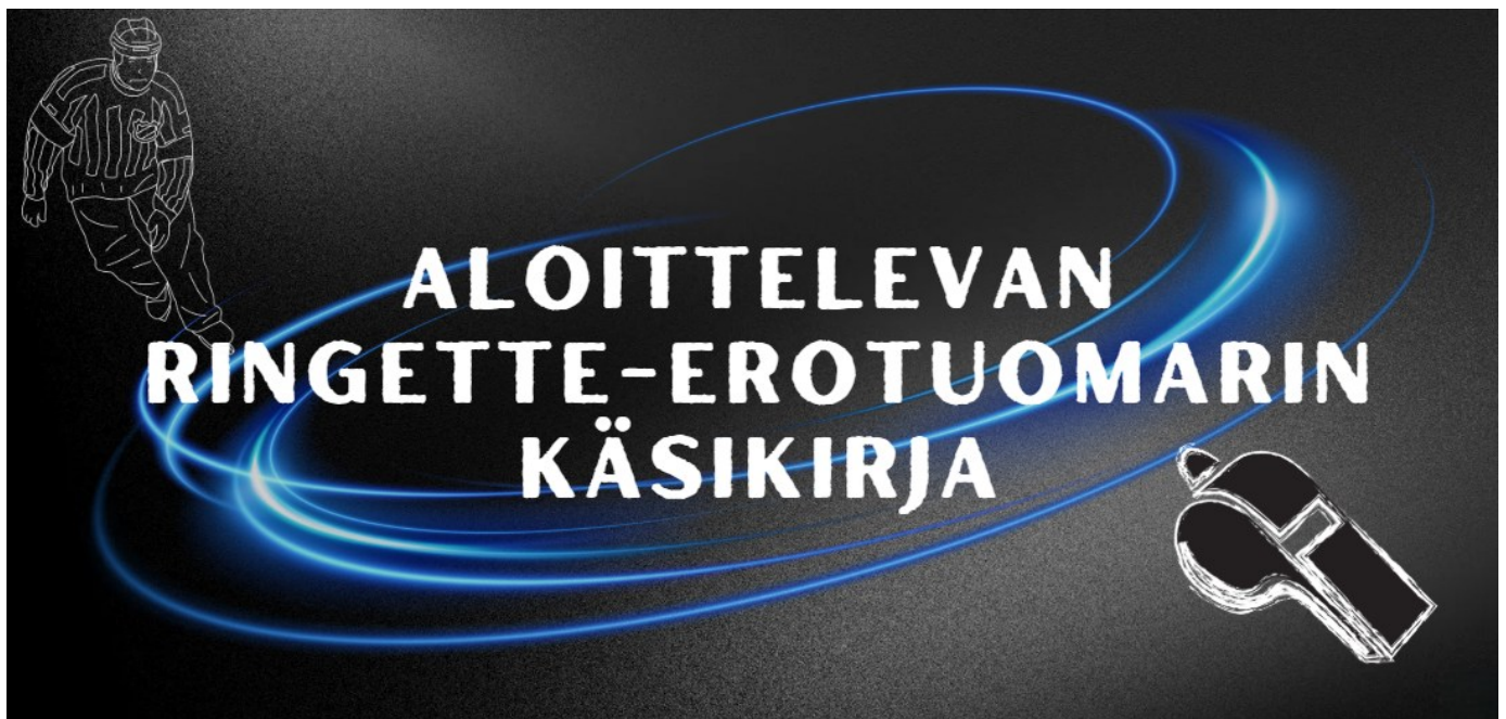
Kuva 3, Tuotoksen kansikuva.

Tuotos ei ole vielä kokonaisuudessaan valmis, vaan toimitetaan Ringeteliitolle toukokuun aikana. Ringeteliitto ohjeistetaan lisäämään tiedosto erotuomarisivustolle, jotta se on helposti löydettävissä.