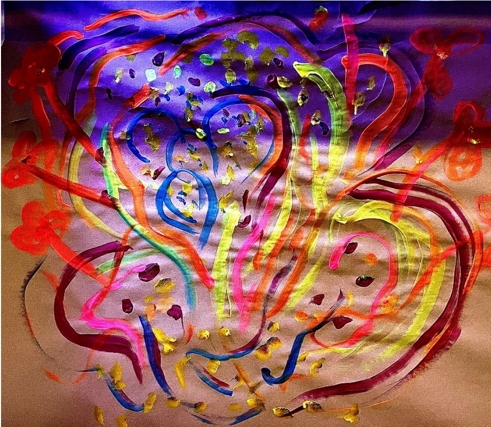
KUVA 3. Sadetanssi

Kuvan 3 maalannut kertoi, että teos sai alkunsa liikkeen ja mielikuvien yhdistelmästä: