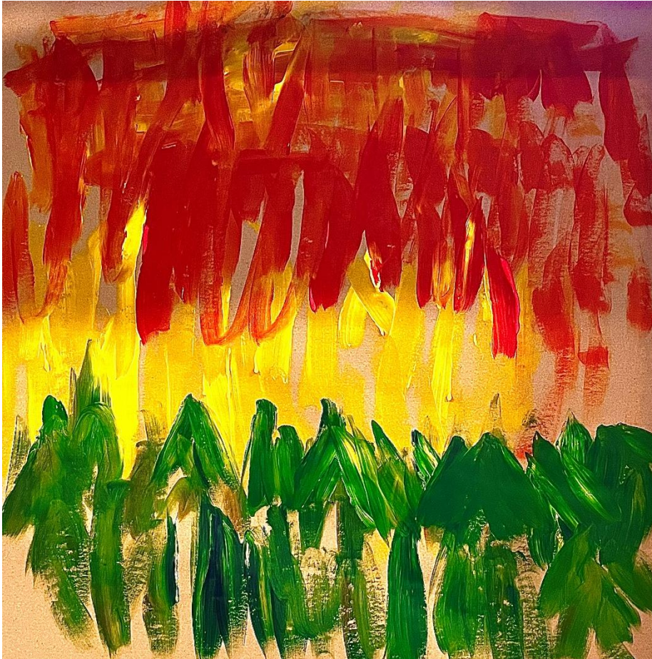
KUVA 1. Iltarusko

Kuvan 1 maalaaja kertoi kuvasta seuraavasti: “Siinä kuusimetsän taakse laskee aurinko” ja totesi perään: “Sehän on iltarusko. Nimi on iltarusko.”