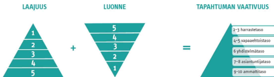
Kuva 3. Tapahtuman luokittelu (Tukes.fi)

Kuluttajaturvallisuuslain mukaan tapahtuma ei saa aiheuttaa vaaraa yleisölle tai omaisuudelle. Tapahtuman turvallisuuteen ja luokitteluun vaikuttaa sen laajuus ja luonne. Näiden perusteella tapahtumat voidaan jakaa viiteen luokkaan. Mitä laajempi tapahtuma on, ja mitä enemmän siihen liittyy riskitekijöitä, sitä vaativampaa ja tarkempaa sen suunnittelu ja järjestäminen on. (Tukes n.d.)