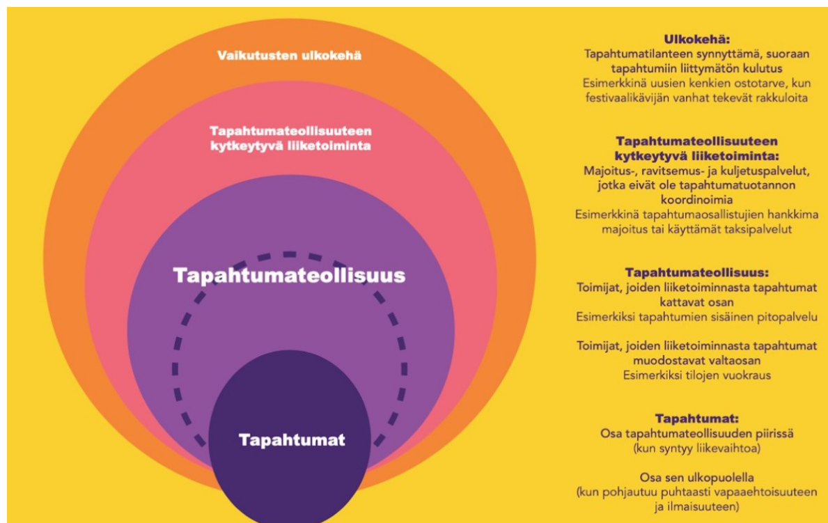
Kuva 1. Tapahtumateollisuuden vaikutukset (Tapahtumateollisuus.fi)

Tapahtuma-ala on alettu tunnistamaan elinkeinoksi ja toimialaksi vasta viime vuosikymmenien aikana (Työ- ja elinkeinoministeriö 2023). Vaikka sitä ei vielä ihan täysin toimialaksi tunnistetakaan, sen ympärillä on monia toimijoita, ja sen vaikuttavuus on merkittävä. Työ- ja elinkeinoministeriön (2023) mukaan ala työllistää noin 20 000 henkilöä vakituisesti, ja osa-aikaisesti, esimerkiksi sesonkiaikoina, 120 000–175 000 henkilöä.