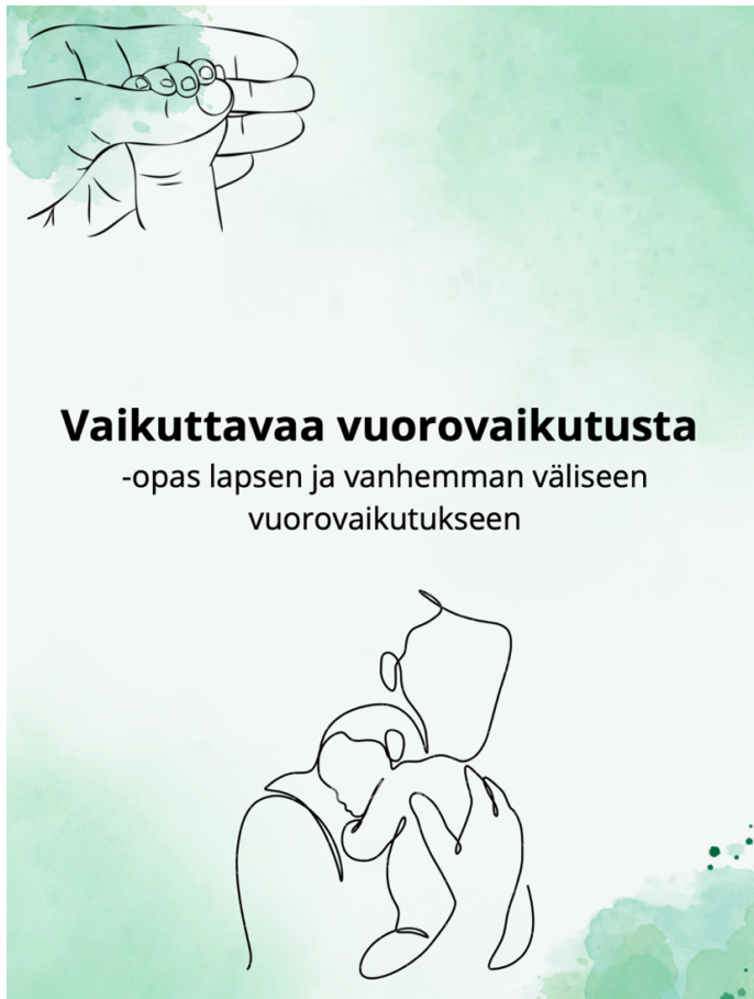
Kuva 1: Oppaan kansi

Oppaan päätettiin olevan väliversiovaiheessa saatavilla vanhemmille sähköisessä muodossa sekä tulostettuna, jotta vanhemmat voisivat tutustua siihen ennen palautteen antamista. Työntekijöiden toiveena oli, että opas säilyisi ytimekkäänä ja selkokieleisenä. Sovimme myös, että esittelisin työntekijöille väliversion oppaasta, ja väliversiovaiheessa palaisin kaikkiin kolmeen asukaspuistoon keräämään palautetta.