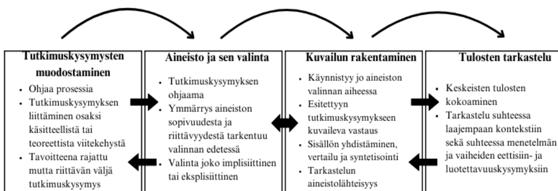
Kuva 1. Eri vaiheet osana kuvailevaa kirjallisuuskatsausta (mukailen Kangasniemi ym. 2013, 294)

Kuvailevaa kirjallisuuskatsausta käytetään yleisesti erityisesti humanistisessa tutkimusperinteessä, jossa pyritään selvittämään, mitä aiheesta on tällä hetkellä tutkittu, mitkä ovat sen kannalta olennaisimmat käsitteet ja millä tavoin nämä käsitteet ovat yhteydessä toisiinsa. Menetelmää on kritisoitu tieteellisesti epätarkaksi ja puutteelliseksi, mutta tästä huolimatta sitä on käytetty laajasti. Kuvaileva kirjallisuuskatsaus on aineistolähtöinen ja sen tavoitteena on ymmärtää ilmiö ja kuvailla se mahdollisimman vakuuttavasti ja johdonmukaisesti, jolloin syntyy kriittisesti tarkasteltu kokonaiskuva. Kuvailevan kirjallisuuskatsauksen käyttö vaatii tutkijalta menetelmän syvällistä tuntemusta, jotta sen tuottama tieto olisi luotettavaa. (Vilka 2023 1.2.1; Kangasniemi ym. 2013, 293.) Kuvaileva kirjallisuuskatsaus voidaan toteuttaa kahdella eri tavalla: integroivana tai narratiivisena katsauksena. Integroivan kirjallisuuskatsauksen avulla voidaan tarkastella ilmiötä monipuolisesti, kun narratiivisella kirjallisuuskatsauksella saadaan laaja yleiskuva valitusta aiheesta. Narratiivinen katsaus auttaa päivittämään ja kokoamaan uutta tietoa, ei niinkään antamaan analyttistä tulosta. Integroivalla katsauksella luodaan uutta tietoa jo olemassa olevista tutkimuksista. (Salminen 2011, 6–8.) Kuvaileva kirjallisuuskatsaus menetelmänä jaetaan neljään vaiheeseen (Kuva 1).