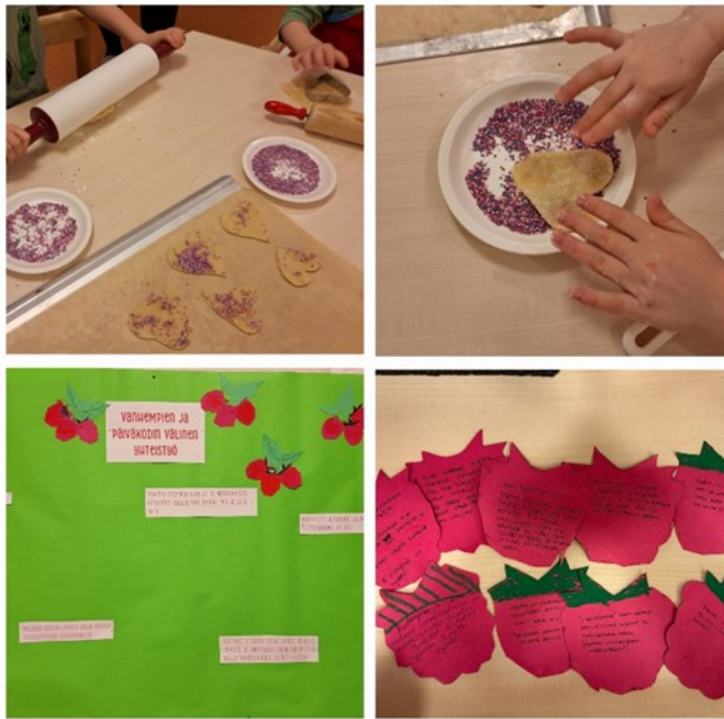
Kuva 44. Vanhempien iltapäivä.

Kahvihetkellä vanhempien kanssa käydyistä keskusteluista kirjasimme ylö heidän ajatuksensa, toiveensa ja ideansa, joista teimme toivevadelmista saadun tiedon kanssa yhteenvedon, joka jaoimme päiväkodin jokaiselle ryhmälle. Vanhempien esiin nostamat ideat liittyivät muun muassa arjen viestinnän kehittämiseen, lapsen vahvuuksien näkyväksi tekemiseen sekä vanhempien osallisuuden lisäämiseen ryhmän toiminnassa. Erityisesti toivottiin enemmän mahdollisuuksia osallistua päiväkodin arkeen esimerkiksi yhteisten tapahtumien tai vanhempien iltapäivien muodossa. Toivevadelmista nousi esiin myös ideoita, kuten valokuvien ja pienten kuulumisten jakaminen päivittäin tai viikoittain, sekä lapsen päivän kohokohtien sanoittaminen iltapäivän luovutustilanteessa.