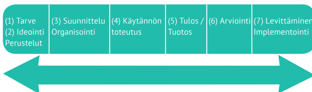
Kuva 33. Kehittämistyön lineaarinen prosessimalli (Salonen ym. 2017, 52).

Salosen ym. (2017, 52–56) mukaan kehittämistyön prosessiin kuuluvan nykykäytännön kehittämistarpeiden tunnistamisen, ideoinnin, suunnittelun, toteutuksen ja tuotoksen, arvioinnin sekä päätösvaiheen eli tulosten levittämisen. Salonen (2013, 15) puolestaan kuvaa kehittämistyön etenemisen lineaarisen mallin mukaan. Malli pitää sisällään neljä eri vaihetta. Työskentely mallin mukaan etenee suoraviivaisesti tavoitteen määrittelystä suunnitteluun, suunnittelusta toteutukseen ja prosessin päättämiseen ja lopuksi arviointiin. Mallin mukaan esitetty kehittämistyö vaikuttaa yksinkertaisemmalta kuin mitä on. Kehittämistoimintaa lähdetään toteuttamaan, kun kehittämistarve tunnistetaan ja käytännötyössä ilmenee tarve muutokselle. Tärkeää on myös rajata aihealue jättäen muutoksille mahdollisuus (Salonen yms. 2017, 52–56).