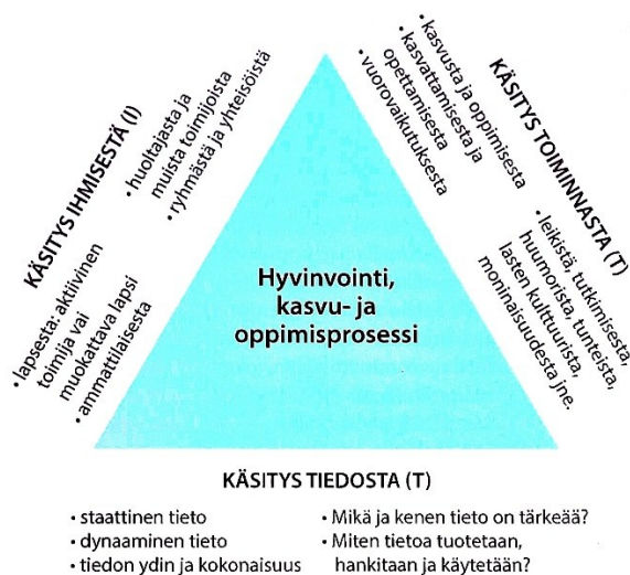
Kuvio 1. Varhaiskasvatuksen kolme keskeistä käsitystä (ITT) (Karlsson 2012)

Varhaiskasvatuksen keskeinen tavoite on lasten hyvä kasvu, oppiminen ja hyvinvointi. Toiminnan suunnittelusta, toteuttamisesta ja rakenteiden luomisesta vastaavat varhaiskasvatuksen ammattilaiset. Lisäksi on tärkeää, miten käytännössä toimitaan: voivatko lapset kasvaa, oppia ja kehittyä monipuolisesti yhdessä muiden kanssa. Varhaiskasvatuksen ydin voidaan tiivistää kolmeen osa-alueeseen tai ilmiöön: 1. Ihmiset, jotka toimivat varhaiskasvatuksessa. 2. Tieto, osaaminen ja toiminnan sisältö. 3. Yhteinen toiminta ja vuorovaikutus. Varhaiskasvatuksen ammattilaisten tehtävänä on tiedostaa omat käsityksensä lapsista sekä varhaiskasvatuksen toimintatavoista. Näiden käsitysten tulee perustua tutkittuun tietoon ja laaja-alaisen kokemukseen. Mitä enemmän varhaiskasvatukseen liittyvät päätökset perustuvat tutkimukseen ja mitä enemmän varhaiskasvatuksen henkilöstö tuntee oman alansa kasvatusteorioita, sitä laadukkaampaa pedagogiikka ja kasvatus on. Tämä vahvistaa lasten ja huoltajien luottamusta varhaiskasvatuksen henkilöstöön ja edistää turvallisuuden, luottamuksen ja hyvinvoinnin kokemuksia. (Kangas ym. 2021, 16.)