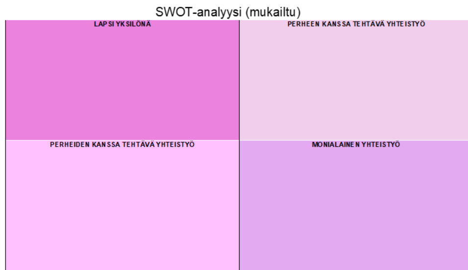
Kuva 55. Mukailtu SWOT-analyysi.

mahdollisuuksiin. SWOT-analyysi ei kuvaa pelkästään tilannetta, vaan sen avulla voidaan luoda konkreettisia toimintasuunnitelmia. (Salonen ym. 2017, 57.) Muunneltuun SWOT-menetelmään neljään osa-alueeseen sisällytimme lapsi yksilönä, perheen kanssa tehtävä yhteistyö, perheiden kanssa tehtävä yhteistyö ja monialainen yhteistyö. Tämä tukee työntekijöiden osallisuutta kehittämistyöhön ja edistää yhteisöllistä keskustelua ja ideointia, jolloin työntekijät voivat yhdessä tunnistaa kehittämisalueita sekä suunnitella konkreettisia toimenpiteitä.