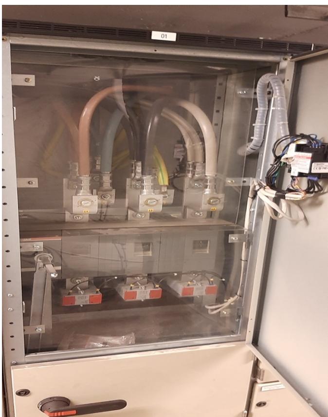
Kuva 5. Esimerkki kosketussuojasta.

Kosketussuojan (Kuva 5) tehtävä on estää tahaton kosketus jännitteisiin osiin ja ulottuminen vaaralliselle alueelle. Osat, joilla on ainoastaan toiminnallinen eristys ja osat, joissa voi olla vaarallinen jännite on suojattava koskettamisesta. Hyväksytyt kosketussuojausmenetelmät ovat: suojaus koteloinnilla, suojaus suojauskella ja suojaus sijoittamalla jännitteiset osat kosketusetäisyyden ulkopuolelle. Sähkötilojen sisäpuolella sallitaan suojaus koteloinnilla, suojauskin tai sijoittamalla jännitteiset osat kosketusetäisyyden ulkopuolelle. Kotelointi luokka on oltava vähintään IP2X. (SFS 6001 2018, 63-67.)