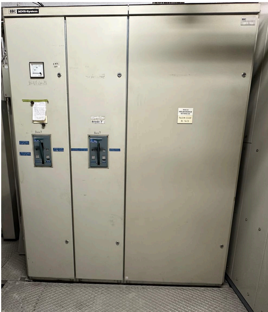
Kuva 8. Uusittava sähköpääkeskus.

Kohteen nykyinen sähköpääkeskus (Kuva 8) syöttää kahta suurta oikaisukonetta. Keskus uudistetaan, jotta sen kokonainen käyttökapasiteetti saadaan hyödynnettyä. Uusimisen turvallisuussyyt ja tarpeet pienjännitepuolella loivat uuden projektin. Olemassa olevat komponentit ovat vanhoja, ja ne voivat johtaa mekaanisiin vikoihin tai tulipalovaaraan. Tulipalon vaara voi aiheutua esimerkiksi löysistä liitoksista, vanhoista sähköjohdoista tai pölystä.