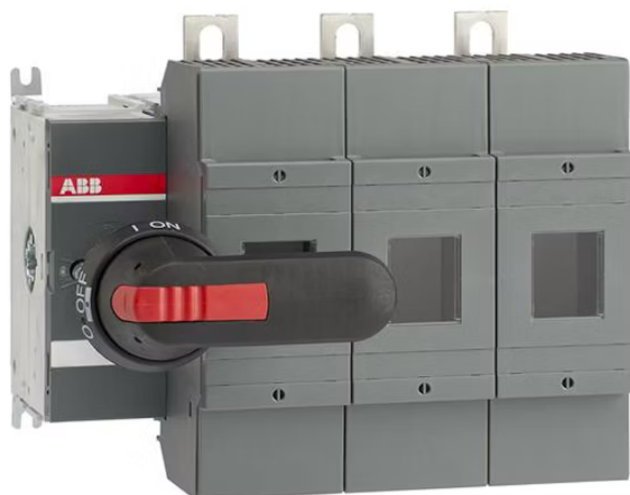
Kuva 6. Kytkinvaroke (ABB 2024).

tilanteissa, joissa virtapiirissä kulkee moninkertainen virta, kuten oikosulun aikana. Kytkinvaroke (Kuva 6) soveltuu teollisuuden monipuolisiin tehtäviin. Kytkinvaroke voi toimia keskuksen pääkytkimenä tai suojata yksittäisiä lähtöjä.