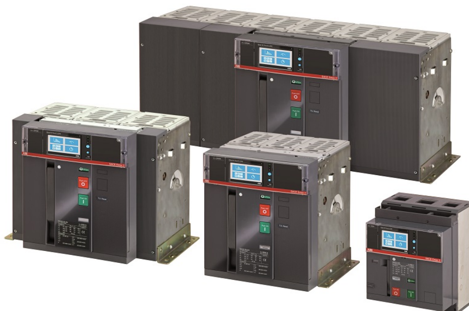
Kuva 7. Ilmakatkaisijat (ABB 2024).

Ilmakatkaisijat soveltuvat hyvin suurten virtojen hallintaan, esimerkiksi tilanteisiin, joissa virta vaihtelee 800A–10 000A välillä ja jännite on 1kV–690V. Katkaisukyky on tyypillisesti 150kA (Kuva 7).