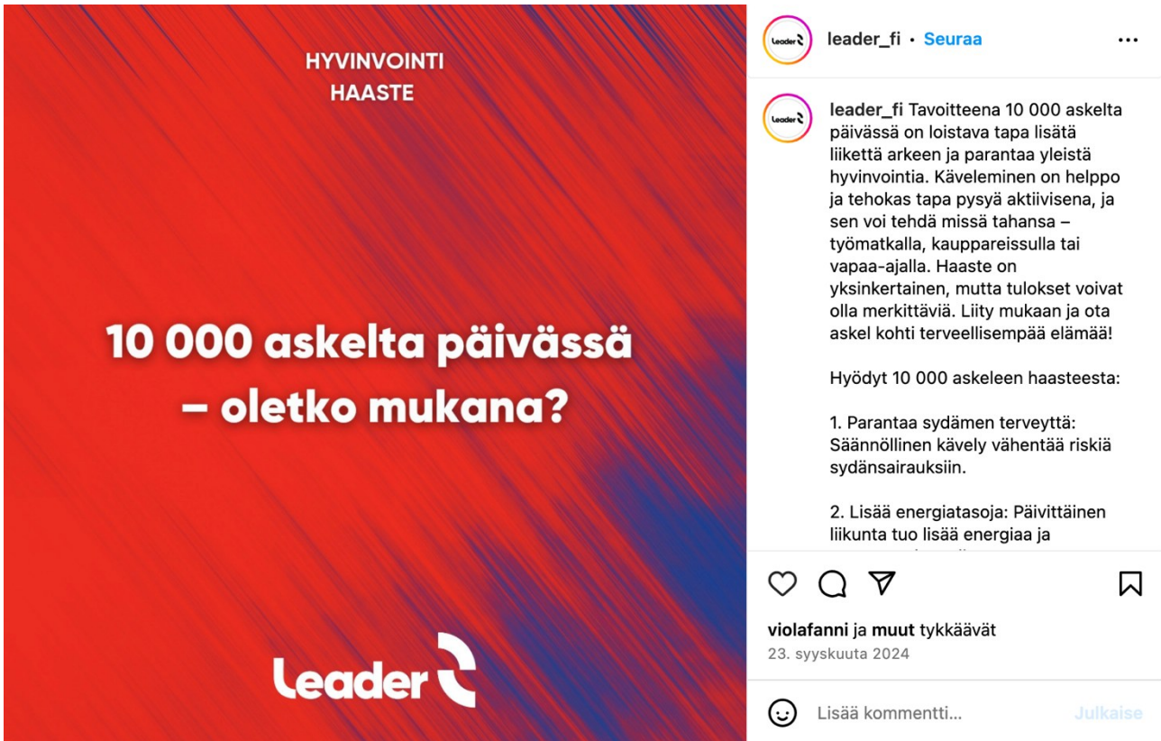
Kuva 2. Kuvakaappaus Leader Suomen Instagram-postauksesta (Leader 23.9.2024)

Leaderin Instagram-postauksessa kerrotaan 10 000 askeleen haasteen hyödyistä, ja siitä, kuinka askeleita voi helposti päivän aikana mitata. Leaderin lisäksi monet muutkin terveyteen ja hyvinvointiin linkittyvät yritykset osallistuvat hyvinvointihaasteisiin sosiaalisessa mediassa tai julkaisevat treenaamiseen ja liikuntaan liittyvää sisältöä. Useat yritykset ottavat postauksissaan huomioon vastuullisuus näkökulman, ja esimerkiksi urheiluvaatteita valmistava yritys Gymshark, jakaa Instagramissaan sisältöä, jossa kuntosalivaatteita käyttää erilaisista etnisistä taustoista tulevat henkilöt (Gymshark 8.3.2025).