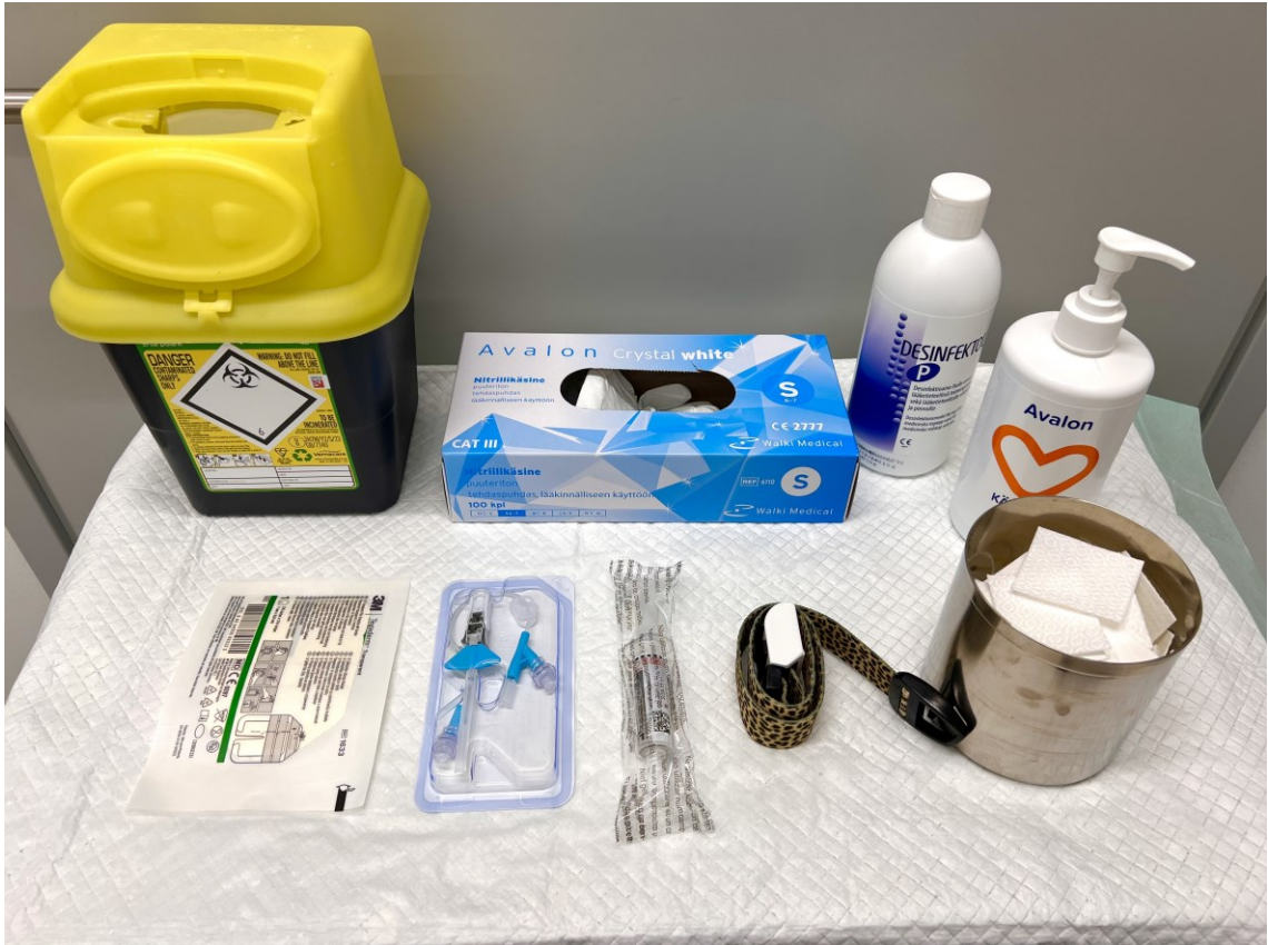
Kuva 4. Kanylointivälineet.

Ennen kanyloinnin aloittamista on tärkeää kerätä tarvittava välineistö valmiiksi (Kuva 4.). Kanylointiin tarvitaan BD Nexiva-kanyyli, suojakalvo, staasi, ihon desinfointiaine, käsihuuhe, tehdaspuhtaat suojakäsineet, ruisku, jossa on 0,9 % keittosuolaliuosta kanyylin toiminnan testaamiseksi, sekä neulankeräysastia. (Terveyden ja hyvinvoinninlaitos 2023.)