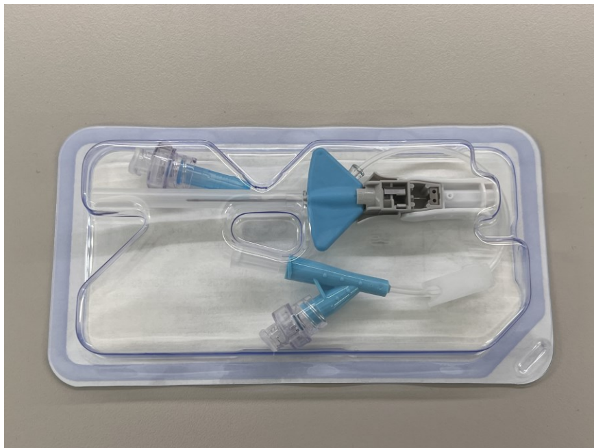
Kuva 3. BD Nexiva Closed IV Catheter System - Dual Port.

Kanyylin valinta perustuu potilaan yksilöllisiin tarpeisiin ja olosuhteisiin. Potilaan fyysinen kunto ja mahdolliset sairaudet vaikuttavat merkittävästi kanyylin valintaan. Potilaan laskimoiden anatomia voi aiheuttaa haasteita laskimoreitin asettamiseen ja sen toiminnan säilyttämiseen. (Geijer ym. 2023.)