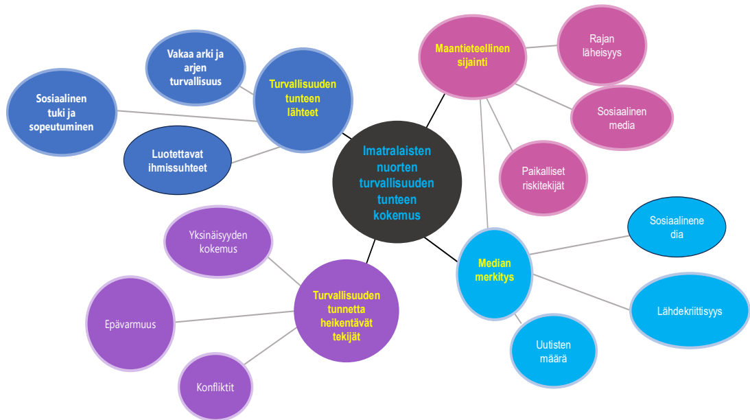
Kuva 3. Nuorten turvallisuuden tunne Imatralla

Vaikka Imatran nuoret jakavat yleisiä huolenaiheita muun Suomen nuorten kanssa, heidän turvallisuuden tunteensa muodostuu osittain eri tekijöistä. Alueellinen sijainti ja sen päivittäinen merkityksellisyys voivat lieventää sodan aiheuttamia pelkoja, mutta geopoliittinen epävarmuus näkyy silti taustalla. Tämä korostaa sitä, kuinka paikalliset olosuhteet ja elinympäristö muovaavat nuorten kokemusta turvallisuudesta.