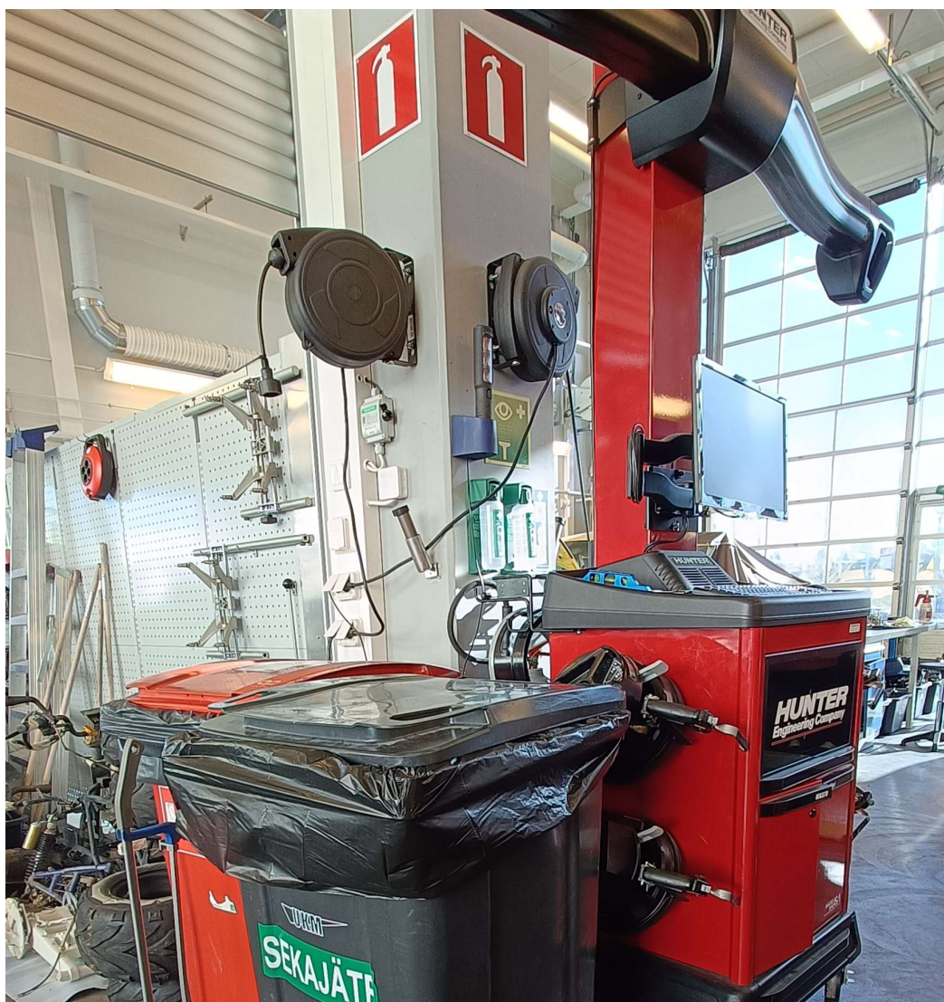
KUVA 4. Käsiammutin tavarankeskellä

Laboratoriossa on asianmukaiset ensiapu-, alkusammutusvälineet erilaisiin pa-loihin ja sähkötapaturmia varten pelastuskeppi. Välineiden paikat on merkattu asianmukaisesti, mutta joidenkin edessä on tavaraa. Hiilidioksidisammutin sijait-see keskeisellä paikkaa, josta se pitäisi olla helppo tilanteen tullessa ottaa käyt-töön, mutta ympärillä on roskiksia ja muuta tavaraa, joten käytännössä sammut-tin olisi hyvin hankala saada nopeasti käyttöön. Ympärillä olevat tavarat saavat tietenkin käyttöä huomattavasti sammutinta useammin ja siksi ovatkin luulta-vasti ajautuneet ajan kanssa helposti saataville, mutta sattumalta sammuttimen eteen. Kuvassa 4 hiilidioksidisammuttimesta näkyy vain murto-osa silmähuuhte-luaseman alapuolella.