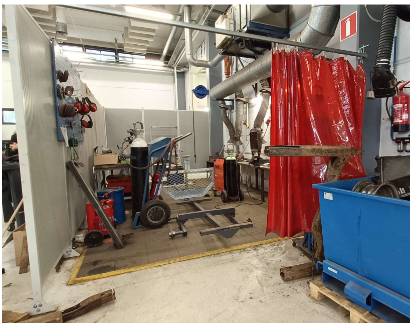
KUVA 7. Vakituinen tulityöpaikka.

Korjaushallista löytyy vakituinen tulityöpaikka. Hitsaaminen ei kuulu hallissa tehtäviin päätyötehtäviin, mutta joskus hitsaamistakin tarvitaan. Irrallisen osan hitsaaminen suoritetaan tulityöpaikalla. Autoa hitsatessa kyseeseen tulee tilapäinen tulityöpaikka, joten hitsausvälineet ja sammuttimet viedään auton luo. Kaasupullot ovat vaunuissa tulityöpaikoilla. Kuvassa 7 korjaushallin vakituinen tulityöpaikka, josta löytyy kaksi käsiammutinta.