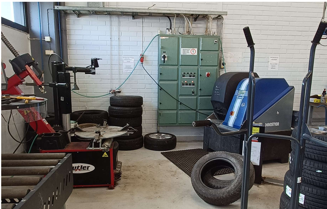
KUVA 9. Sähkökeskuksen edustalla tavaraa.

Samalla teemalla jatketaan myös tilasta löytyvien muiden sähkökeskusten kohdalla. Sähkökeskuksissa on kyltti, jossa lukee, ettei sähkökeskuksen edessä olevaa aluetta saa käyttää varastopaikkana. Kuvassa 9 sähkökeskus, jonka edustalla tavaraa ja vieressä ylimääräisten renkaiden säilytyspaikka.