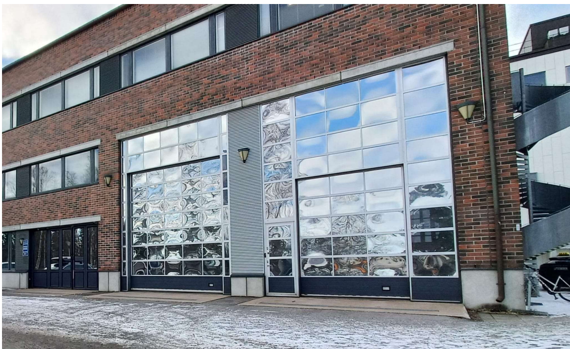
KUVA 1. Labra kuvattuna idästä.

Tilassa on neljä nosto-ovea ja yksi taitto-ovi. Nostimia on kolme. Laboratoriossa on viisi henkilöautoa ja yksi pieni työkone. Käyttövoimana autoissa on bensa, diesel ja hybridi. Työkone on käyttövoimaltaan sähköhydraulinen. Tilasta löytyy siirrettävä sähköautojen latauslaitte. Kuvissa 1 ja 2 laboratorio ulkoapäin idästä ja pohjoisesta. Idästä kuvatussa kuvassa näkyy kaksi nosto-ovea sekä vasemmalla taitto-ovi. Nostimet sijaitsevat idässä molemmilla nosto-ovilla sekä pohjoisessa kuvan 2 vasemmanpuoleisen nosto-oven kohdalla. Kaikkien ovien edessä on sulanapito. Poistumistiet ja samalla pelastuslaitoksen hyökkäysreitit sijaitsevat molemmin puolin tilaa kulkuovilla.