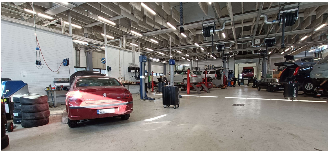
KUVA 6. Korjaushalli

Sastamalan koulutuskuntayhtymän (Sasky) ammattikoulun auto-osastolla 904 m 2 korjaushalli, jota hyödynnetään osana ajoneuvoalan perustutkintoa. Tiloissa on myös 70 m 2 pesutila, 75,5 m 2 testausalue, 23 m 2 toimistotila sekä useampi pienempi varastotila. Nämä ovat samaa palo-osastoa ja muihin rakennuksen tiloihin on EI 60 palonkestävyys. Tilassa on neljä nosto-ovea ja nostimia kymmenen kappaletta. Poistumistiet ja samalla pelastuslaitoksen hyökkäysreitit sijaitsevat nosto-ovien yhteydessä tai vieressä. Autoja on yleensä muutama enemmän mitä nostimia. Autoja on useammalla eri käyttövoimalla. Lisäksi hallissa säilytetään ammattikoulun omaa sähköautoa, jota varten tilasta löytyy kiinteä sähköauton latausasema. Kuvassa 6 korjaushalli, kun astutaan sisään kulkuovesta Ratakadun puolelta.