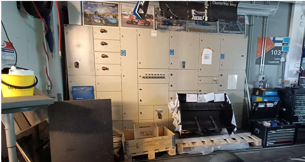
KUVA 5. Projektityöhuoneessa sijaitseva sähkökeskus.

Labran tiloissa sijaitsevassa 36,5 m 2 projektityöhuoneessa on paljon huomauttavaa. Siinä missä labratilat ovat siistit ja kaikella on asiamukainen paikkansa, projektityöhuoneessa tavaroita on paljon lattialla ja levällään. Lisäksi on tyhjiä pulloja ja ovella vastassa kuormalavoja. Huoneessa on paljon palovaaran aiheuttajia ja palokuormaa. Projektityöhuoneesta alkanut palo leviäisi lopulta laboratoriotilaan. Huoneessa on kaksi ovea, mutta liukuovi ei ole käytettävissä, kun molemmin puolin ovea on varastoitu tavaraa kaappeihin ja hyllyihin. Huoneessa oli käsisammutin oven vieressä lattialla tavaroiden ympärillä. Laboratorion sähkökeskus sijaitsee projektityöhuoneessa. Sähkökeskus on ainoan käytettävissä olevan oven vieressä vasemmalla ja oven edustalle oli jätetty kuormalavoja. Kuvassa 5 projektityöhuoneessa sijaitseva sähkökeskus ja sen edusta. Sähkökeskuksessa on kyltit ”Pidä edusta vapaana”.