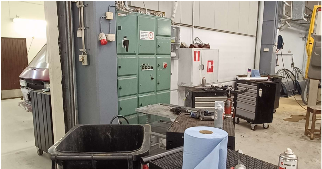
KUVA 8. Sähkökeskuksen ja pikapalopostikaapin edusta.

Samalla teemalla jatketaan myös tilasta löytyvien muiden sähkökeskusten kohdalla. Sähkökeskuksissa on kyltti, jossa lukee, ettei sähkökeskuksen edessä olevaa aluetta saa käyttää varastopaikkana. Kuvassa 9 sähkökeskus, jonka edustalla tavaraa ja vieressä ylimääräisten renkaiden säilytyspaikka.