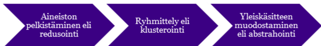
Kuvio 1. Sisällönanalyysin eri vaiheet (Leinonen, 2018).

Sisällönanalyysin vaiheet voivat vaihdella hieman riippuen siitä, millaista analyysimallia käyttää. Tutkimuksessa pyrittiin etenemään kuvion 1. vaiheita noudattaen.