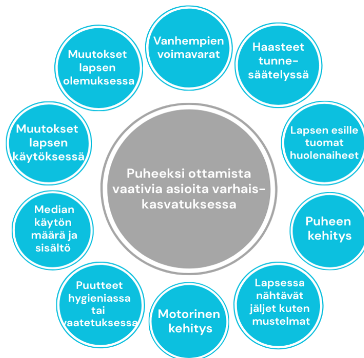
Kuvio 4: Huolta herättäviä asioita varhaiskasvatuksessa

Haastatteluissa esille tulleita huolenaiheita (kuvio 4) ovat lapsen kehitykseen liittyvät asiat, puutteet lapsen vaatetuksessa tai hygieniassa, liiallinen mediankäyttö tai itse mediasisältö, vanhemmuudessa nähtävät haasteet, lapsen aggressiivinen käytös, lapsen motorinen levottomuus, muutokset lapsen käytöksessä tai olemuksessa, lapsen väsymys tai syömättömyys, huoltajien voimavarat tai lapsen esille tuomat huolestuttavat asiat.