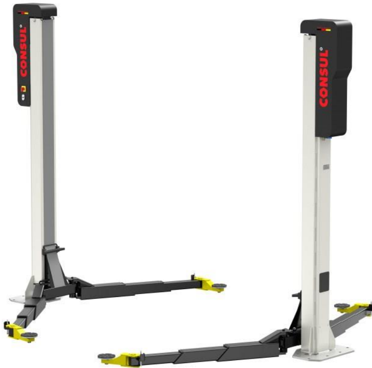
Kuva 4. Sähköautoille suunniteltu kaksipilarinostin [12].

Akusto, joka painaa satoja kiloja, on saatava alas ajoneuvosta rauhallisesti ja turvallisesti. Akkuihin on rakennettu omat nostopisteet tai nostolenkit, riippuen siitä missä ajoakku sijaitsee. Akkujen nostamiseen ja laskemiseen on suunniteltu akkunostimet. Akkunostin on leveä hydraulisesti, sähköisesti tai paineilmalla toimiva pöytä, jolla on kantavuutta akun liikutteluun. Kuvan 5 tapaisia pöytänostimia myydään Suomessa useammassa eri yrityksessä noin 5000 € hintaan. Perinteisiin moottorinostimiin myydään myös akun nostokehikkoa. Suomessa myydään vain yhdenlaista kehikkoa ja niiden kiinnitykset tapahtuvat joko 4 tai 6 pisteestä ja nostokapasiteetti on 700 kg. Nostokehikon hinta on noin 4500 € yrityksestä riippuen.