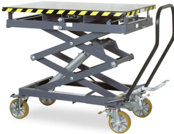
Kuva 5. Hydraulinen akkunostin [13].