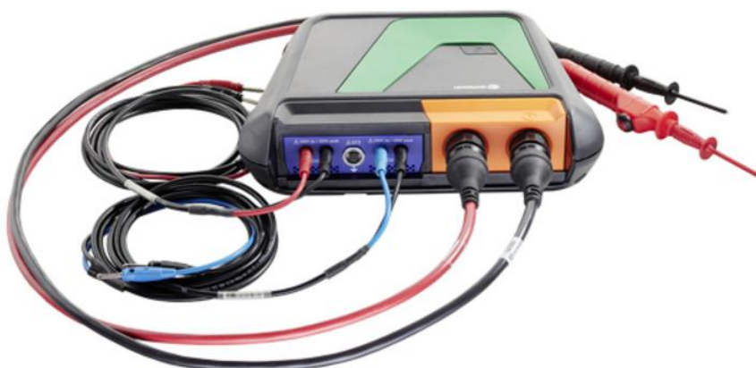
Kuva 2. Hella Gutmann MT-HV Pro. [8]

Jos aiotaan korjata korkeajänniteakkuja, täytyy työkaluihin investoida enemmän. Akkuja korjatessa täytyy testata mm. eristysvastusta, potentiaalintasausta sekä akuston vuotoja. Kaikkiin edellä mainittuihin on kehitelty omat työkalut, mutta ne on myös mahdollista ostaa samassa paketissa. Akun vuototesti tehdään valmistajan määrittämien asetusten mukaisesti yli- tai alipaineella. Yleensä käytetään ylipainetta, koska alipaineella on isompi riski saada akkuun likaa. Paineenmittaus on tarkkaa, sillä se ei saa nousta liian korkeaksi eikä se saa nousta liian nopeasti. Akussa on paineentasausventtiili, joka estää liiallisen paineen muodostumisen akkuun. Suomessa saatavilla on AVL Ditestin kehittämä HV Sat testilaite, joka tekee kaikki mittaukset automaattisesti. Testipaineet ovat yleensä 40–100 mbar ja testi kestää yleensä 120 sekuntia. [9.]