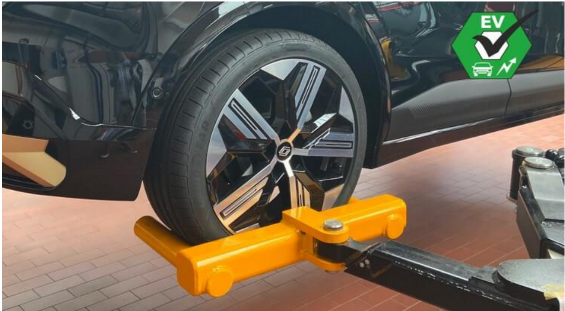
Kuva 3. Nostohaarukalla auton nostoa renkaasta [11].

Japan Motors Oy:n yrittäjä on pohtinut yhden kaksipilarinostimen varaamista mahdollisille sähköauto korjauksille. Tällä hetkellä yrityksen nostimen nostokyky on 2500 kg, joka riittää pääosin hyvin nykyajan autoille. On myös paljon katu- maastureita ja pakettiautoja, jotka painavat yli 2500 kg. Suomessa myytävien sähköautoille suunniteltujen nostimien nostokyky on 3000–4000 kg ja niiden hinnat alkavat noin 5000 eurosta (kuva 4).