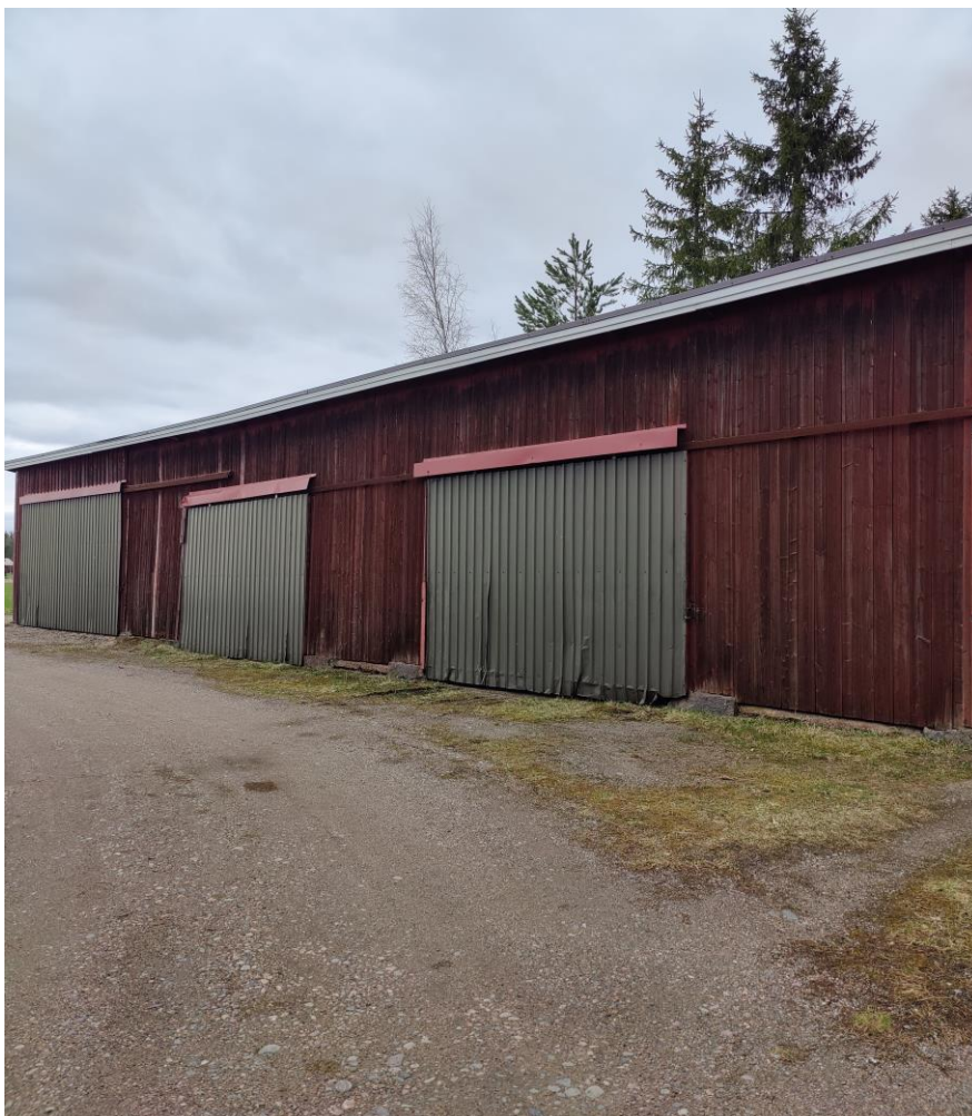
Kuva 10. Akkuvarastolle mietitty rakennus.

mukainen varastointila. Kuitenkaan ei ole poissuljettua rakentaa uutta varastoa pihaan.