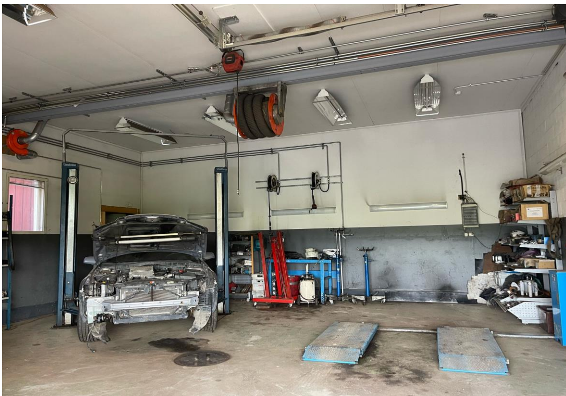
Kuva 7. Sähköajoneuvokorjaukseen suunnitellut tilat.

Varoitus- ja merkitsemisvälineiden ohjeistukset ja säädökset ovat tarkentuneet uudessa SFS 6002:2025-standardissa. Sähköajoneuvossa tehtävä sähkötyö, on merkittävä selkeästi varoituskyltein ajoneuvon ympäriltä, esimerkiksi kuvan 8 tavalla. Korjaamo- ja sosiaalitilat tulee olla varustettu ensiapuhjetaululla. Korjaamotilan kaikki kulkuovet on merkittävä vaarallisen jännitteen kylteillä sekä asiattomilta pääsy kielletty -maininnalla. Jos korjaamotiloissa liikkuu henkilöitä, joilla ei ole sähköajoneuvokoulutusta, tulee ajoneuvo merkitä lippusiimalla tai vastaavalla tavalla. Kuvassa 8 näkyy esimerkki sähköajoneuvon merkinnästä korkeajännitetöiden aikana. [4.]