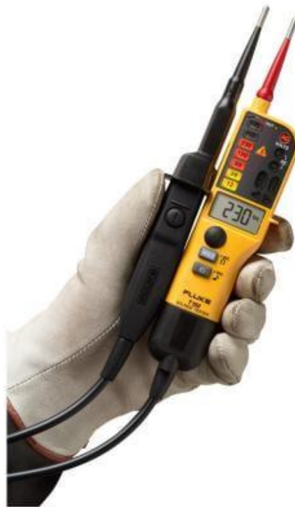
Kuva 1. Fluke-jännitteenkoetin [5].

Standardi SFS 6002:n mukaan yleismittari ei ole enää pätevä korkeajänniteajoneuvon jännitteettömyyden toteamiseen. Ajoneuvon jännitteettömyys tulee todeta jännitteenkoettimen avulla (kuva 1). Ennen jännitteettömyyden toteamista on kuitenkin varmistettava, että jännitteenkoetin on sopiva odotetulle käyttöjännitteelle, taajuudelle ja ympäristöolosuhteille. Jännitteenkoettimien toiminta on kokeiltava ennen käyttöä ja jos mahdollista myös käytön jälkeen. Käyttöjännitteen poissaolo on todettava korkeajänniteajoneuvosta useammasta eri kohdasta ja niin läheltä työaluetta kuin on mahdollista. [4.]