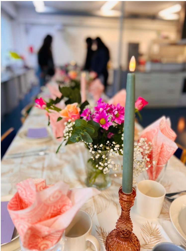
Kuva 7: Nuorten somistama juhlapöytä.

Havainnointini mukaan nuoret pitivät leiristä ja suurin osa osallistui mukaan joka päivä heti aamusta alkaen. Mukana oli muutamia nuoria, jotka tulivat eri aikoihin ja halusivat mukaan vain osaan toimintaan, mutta tämä ei haitannut yleistunnelmaa tai häirinnyt muita. Leirin ilmapiiiri pysyi rentona ja jokaisella oli mahdollisuus tulla mukaan juuri sellaisena, kuin on. Nuorten välinen vuorovaikutus oli luontevaa ja kehittyi leirin aikana, sillä aluksi huomasin enemmän erilaisia ryhmittymiä heidän kesken. Etenkin musisointi ja erilaiset tekemiset toivat nuoria myös vaihtelevilla kokoonpanoilla yhteen, jolloin eri luokka-asteella opiskelevat pääsivät tutustumaan toisiinsa paremmin. Oli huomattavaa, että mukana oli useampi koulun tukioppilas ja tämä näkyi mielestäni hienosti ryhmädynamiikassa. Jokaisena päivänä muutamit nuoret ottivat enemmän vastuuta vuorovaikutuksesta ja huomioivat myös porukan hiljaisempia osallistujia. Havaintojeni perusteella myös jokaiselle löytyi ainakin yksi entuudestaan tuttu ystävä porukasta, jonka kanssa oli turvallista viettää aikaa, mikäli niin tahtoi.