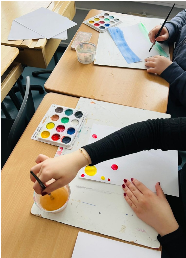
Kuva 1: Nuoret maalaavat musiikin mukana.

Ensi kerralla varaisin musiikkimaalaukseen riittävästi aikaa ja kappaleita voisi soittaa useamman kerran putkeen.