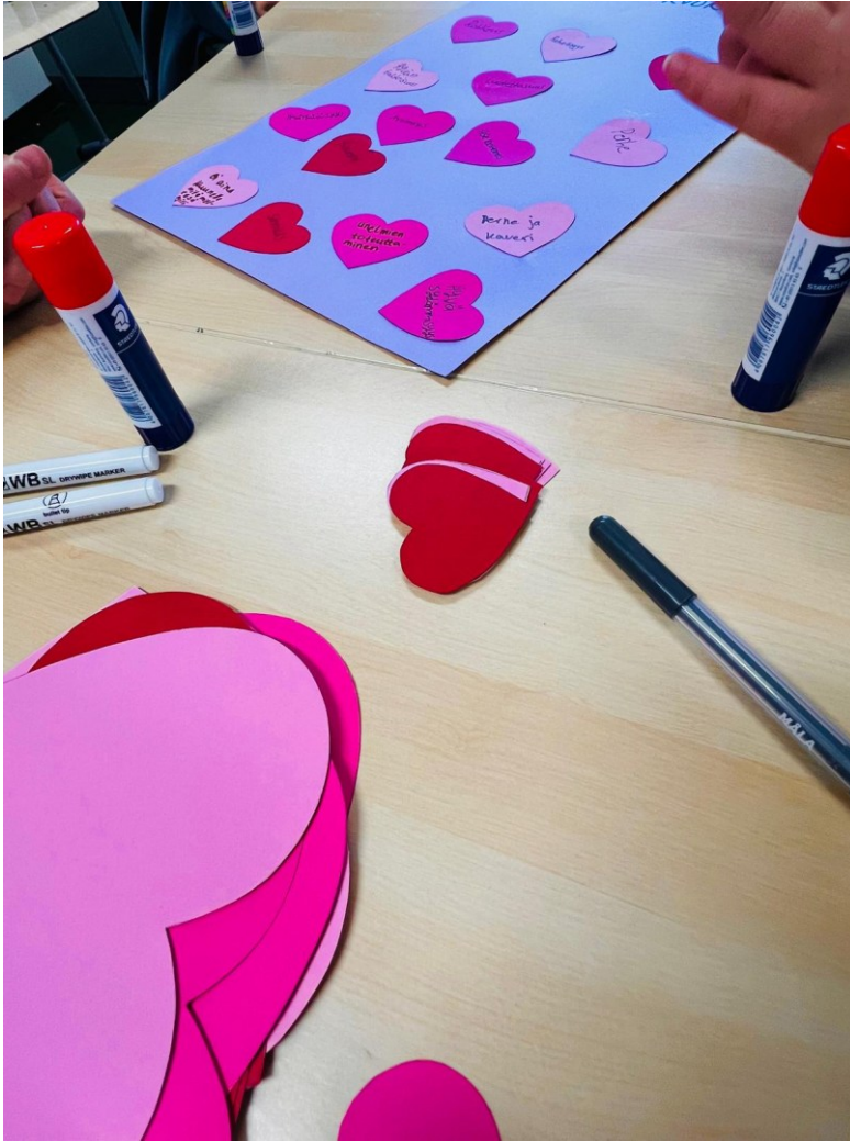
Kuva 3: Nuoret kirjoittivat sydämien sisään itselleen tärkeitä arvoja.

Olin itse musiikkiluokassa ja tulin maanantaina siihen tulokseen, etten lähde vetämään ryhmien kanssa ennalta suunniteltua toimintaa, mikäli heillä on halu ja toive tehdä jotain muuta. Huomasin, että monet nauttivat soittamisesta ja mahdollisuudesta kokeilla kerrankin eri bändisoitintimia, joten halusin mahdollistaa tämän heille. Jätin siis ajatuksen Elämäni biisi-työpajasta ja päätin käyttää sitä vain siinä tapauksessa, että ryhmä tuntuisi sille otolliselta. Heittäytymällä ennalta suunnittelemaan toimintaan voi luoda itselleen haasteita, mutta tässä kohtaa se kannatti: nuoret olivat erityisen aktiivisia tuomaan omia toiveitaan esille, joten niihin oli helppo tarttua.