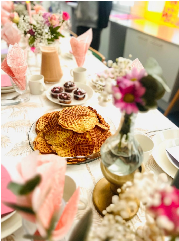
Kuva 6: Juhlakattaus.

Loppuajan juhlimme ja nautimme yhdessä leivonnaisia sekä vaihdoimme ajatuksia pöydän ääressä. Osallistujat saivat poistua omaan tahtiin, ja ennen lähtöä jokaisesta otettiin polaroid-kuva muistoksi. Kuvausseinällä nuoret innostuivat ottamaan sekä yksilö- että ryhmäkuvia, ja pöydältä sai halutessaan ottaa mukaansa kukkia somisteeksi. Yleinen tunnelma oli myönteinen ja rauhallinen. Vaikka itsestä otettujen kuvien ottaminen ja katsominen saattoi tuntua joillekin haastavalta, valokuvat koettiin silti tärkeiksi muistoiksi, joita haluttiin säilyttää. Myöhemmin koululla käydessäni kuvia näkyikin nuorten puhelimien taustalla.