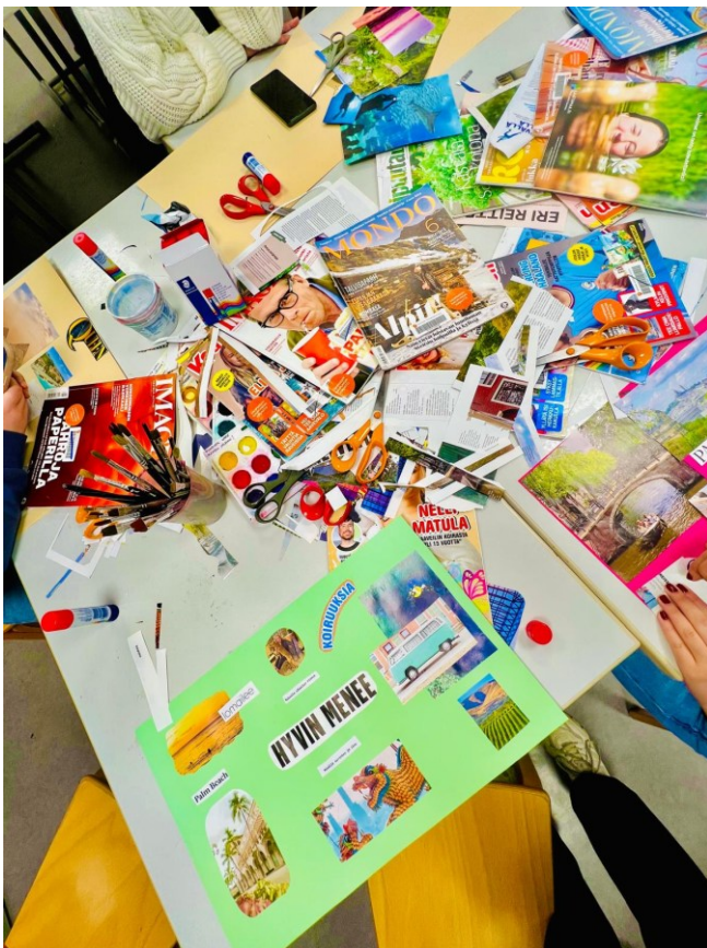
Kuva 2: Unelmakarttojen materiaalia pöydällä.

Ruokailun jälkeen siirryimme kuvaamataidon luokkaan tekemään unelmakarttoja. Olin hakenut tätä varten kirjastosta kasan erilaisia aikakauslehtiä esimerkiksi nuoriso- ja matkailuteemalla. Myös unelmakarttatyöskentelyn taustalle nuoret halusivat laittaa musiikkia, ja tunnelma oli rauhallinen alusta alkaen. Jokainen keskittyi oman aikansa kartan tekemiseen ja osan piti lähteä pois hieman aiemmin. Päätimme lopettaa leiripäivän niin, että kaikki saivat tehdä karttansa loppuun ja lähteä pois, tai mennä vielä kouluvalmentajan tiloihin pelaamaan. Tämä oli hyvä ratkaisu, sillä alun perin mietityt pienryhmät ja niiden aikataulut eivät kuitenkaan toteutuneet ensimmäisenä päivänä.