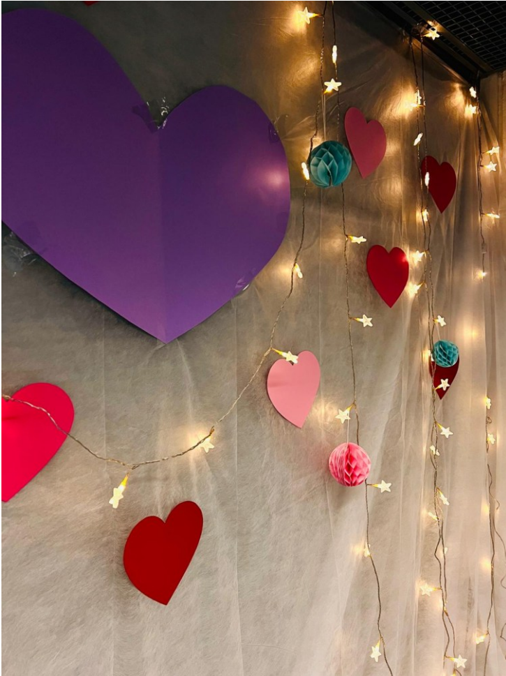
Kuva 5: Valokuvausseinän koristeet.

Lounaan jälkeen viimeistelimme vielä juhlatilaa ja osa jäi pelaamaan kouluvalmentajan luokkaan. Nuorten ainoa etukäteen esitetty toive leirille oli piiloleikin pelaaminen koulun tiloissa. Kouluvalmentaja antoi tälle luvan ja aukaisi osan luokista, joten leikki pääsi alkamaan. Noin puolet leirin osallistujista lähti leikkiin mukaan kahden kierroksen ajaksi. Nuoret olivat selvästi innoissaan, että tämän kaltainen, hassultakin tuntuva toive toteutui ja he pääsivät yhdessä leikkimään. Ryhmä oli tässä kohtaa muodostunut selkeästi yhtenäiseksi, luovuuden ja hulluttelun sallivaksi yhteisöksi.