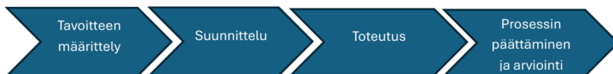
Kuvio 2. Prosessi lineaarisen mallin mukaan (Mukaiillen Salosta 2013.)

Salonen (2013) kertoo oppaassaan, että kehittämistyönä tehty opinnäytetyö voidaan hahmottaa neljän eri ideaalimallin kautta: lineaarinen, spiraalimainen, tasomainen ja spagetti-mainen prosessi. Tämä opinnäytetyö on toteutettu lineaarisen mallin mukaan. Lineaarisen mallin mukaisesti kehittämistyö etenee loogisessa järjestyksessä, kuten alla olevasta kuvio-osta 2 voidaan nähdä. Työ etenee tavoitteen määrittämisestä suunnitteluvaiheeseen, siitä toteutukseen ja viimeisenä projektin loppuunsaattamiseen ja arviointiin.