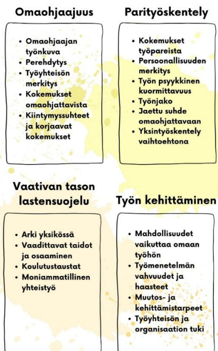
Kuva 1: Teemahaastattelurunko

Puolistrukturoidussa teemahaastattelussa oleellista on haastattelun eteneminen tiettyjen teemojen varassa yksityiskohtaisten kysymysten sijasta, jolloin tutkijan vaikutus haastatteluun jää mahdollisimman pieneksi ja itse tutkittavien ääni nousee tarkoituksenmukaisesti haastattelun keskiöön. Kuitenkin samat aiheet ja teemat ohjaavat kaikkia haastatteluja. (Hirsjärvi & Hurme 2022, 4.2.3.) Valmistauduin teemahaastatteluihin laatimalla teemahaastattelurungon, jonka jaoin ennen haastatteluja myös haastateltaville tarkasteltavaksi. Jakamalla haastattelurungon etukäteen haastateltaville halusin mahdollistaa heille etukäteen valmistautumisen haastatteluun ja toisaalta rikastaa aineistoa sillä, että haastateltavilla oli ollut jo ennen haastattelua aikaa pohtia aiheita ja teemoja ja siten haastattelutilanteessa avautuminenkin olisi helpompaa.