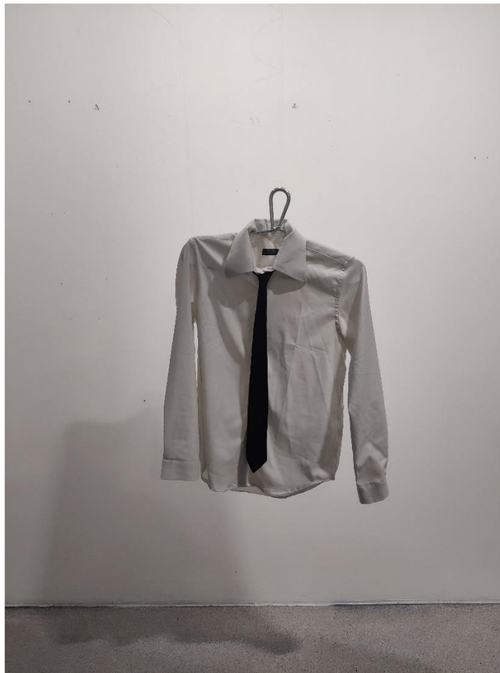
Kuva 18. Siimaripustus