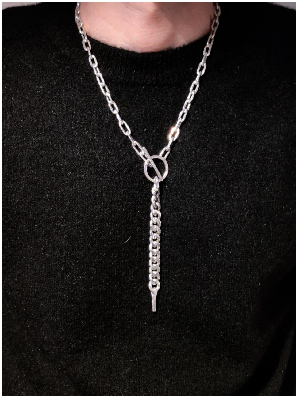
Kuva 4. valmistamani tilaustyö kaulakoru

Myöhemmin kravatti teema tuli eteeni tilaustyön muodossa (kuva 4). Tilaustyössä minulla oli vapaat kädet korun ulkonäön kanssa, ainoa kriteeri oli, että korusta tulee kaulakoru. Halusin jatkaa kravatin muotokielen parissa ja tehdä jotain perinteisestä kaulakorusta poikkeavaa, joten käytin inspiraationa taas kravattia. Olen ollut aina kiinnostunut arkisten esineiden, asioiden ja asusteiden esilletuomista korun keinoin ja kravatti asusteena on ollut minulle mielenkiintoinen aihe. Kravatti on kaikille tuttu asuste, usein assosioitu asiallisuuteen, työelämään tai juhlaan tämä konsepti kiinnosti minua ja sen tutkiminen korutaiteen keinoin tuntui mielenkiintoiselta.