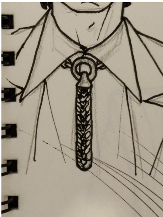
Kuva 5. Ensimmäinen luonnos

Halusin että koru muistuttaa kravattia viitteellisesti, jotta korulla olisi oma selkeä ja moderni muotokieli, mutta jättäisi katsojalle varaa tulkita korun ulkonäköä oman näkemyksen mukaan.