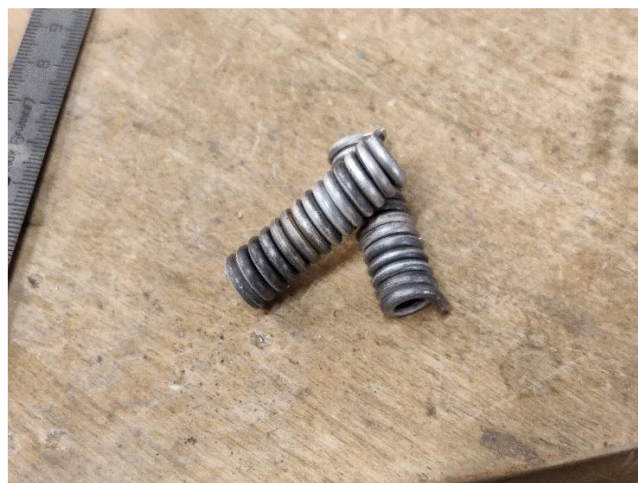
Kuva 7. Hopealenkit