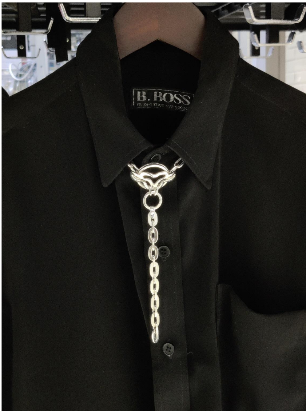
Kuva 3. "Silver Tie"

Valitsin opinnäytetyöhön aiheeksi yksilöllisyyden, ja halusin tutkia aihetta kravatin ja miesten pukukoodien kautta. Päätin tehdä kravatin omaisen hopeakaulakorun. Aihe tuli vastaan, kun olin osa ryhmänäyttelyä, jossa yksi teoksistani oli hopeasta valmistettu kravattia muistuttava kaulakoru (kuva 3), joka oli puettu mustan kauluspaidan päälle. Kyseisen teoksen teema oli arkisen asusteen uudelleen luonti korun keinoin.