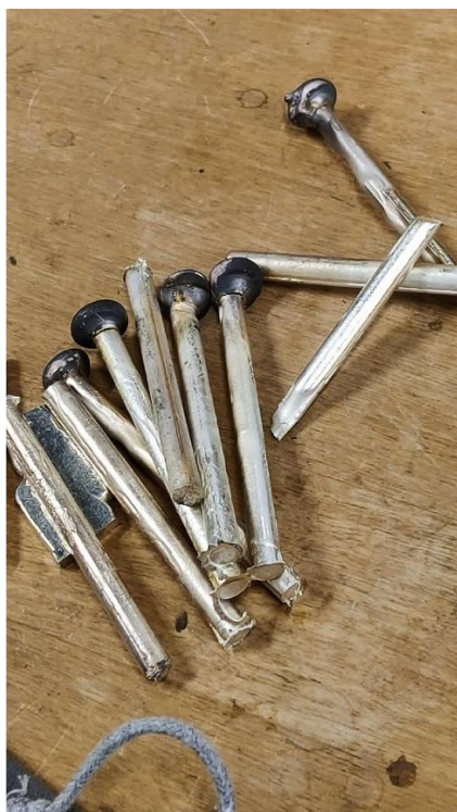
Kuva 6. Valetut hopeapuikot