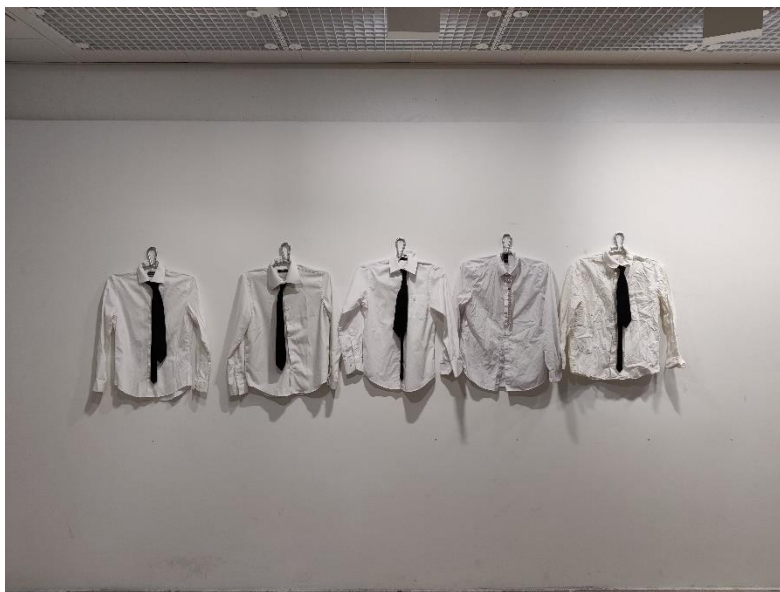
Kuva 16. Ensimmäinen ripustusharjoitus

Kokeilin erilaisia tapoja esittää installaation, ensimmäinen idea ripustukseen oli ripustaa paidat henkareista seinälle samaan korkeuteen (kuva 16), tämä tapa toimi hyvin ja toi esille aihetta joka opinnäytetyössä on. Kokeilin myös miltä installaatio näyttäisi vaatekabinissa (kuva 17), se toi installaatiolle arkisen tunnelman, mutta installaation koko ei päässyt oikeuksiinsa vaatekabinissa ja koru hukkuu paitojen sekaan. Leikittelin aluksi myös paitojen värien kanssa, kokeilin valkoisten paitojen joukkoon yhden erivärisen paidan lisäämistä, jonka päällä koru olisi (kuva 17), mutta tämä ei toiminut ja loi teokselle tunnelman, joka ei sopinut näkemykseeni. Se loi tunnelman eriarvoisuudesta ja huomasin että oli tärkeää esittää paidat samassa arvossa, joten päädyin käyttämään samanvärisiä paitoja.