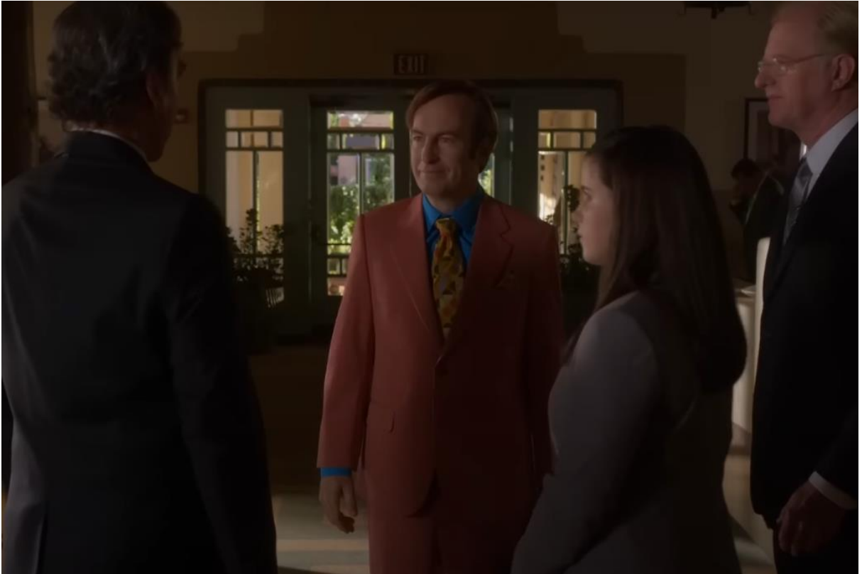
Kuva 21. Vince Gilligan & Peter Gould, Better Call Saul, 2016 (AMC)