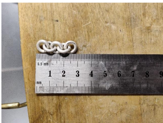
Kuva 10. Ketjun yhteen juotto