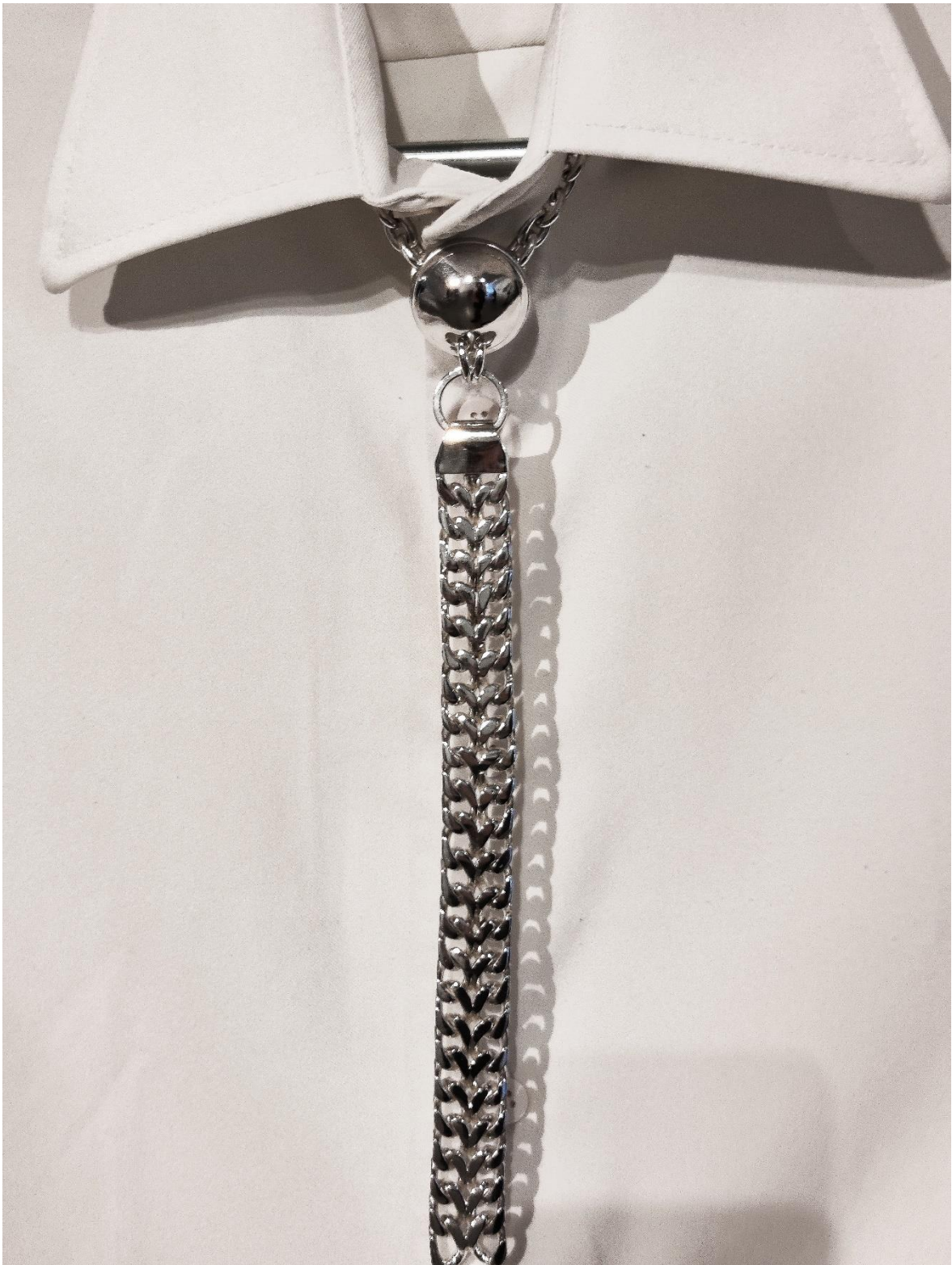
Kuva 15. Kravattikoru valmiina