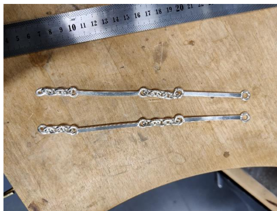
Kuva 11. Kaulaketjun malli