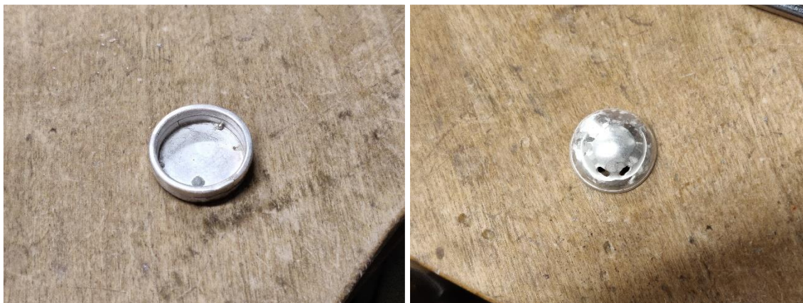
Kuva 12. Solmun valmistus

Tämä osa korua oli tärkeä saada virheettömän siistiksi, sillä se on iso huomion piste teoksessa, iso pyörä peilikiiltävä kravatin ”solmu” on korun sielu, se heijastaa kaiken ympärillään ja kiiltää voimakkaasti, kuvastaen yksilön vahvuutta ja sielua. Korun solmu on osa jossa korun ketjut yhdistyvät, tuoden sille voimakkaan aseman korun muotoilussa.