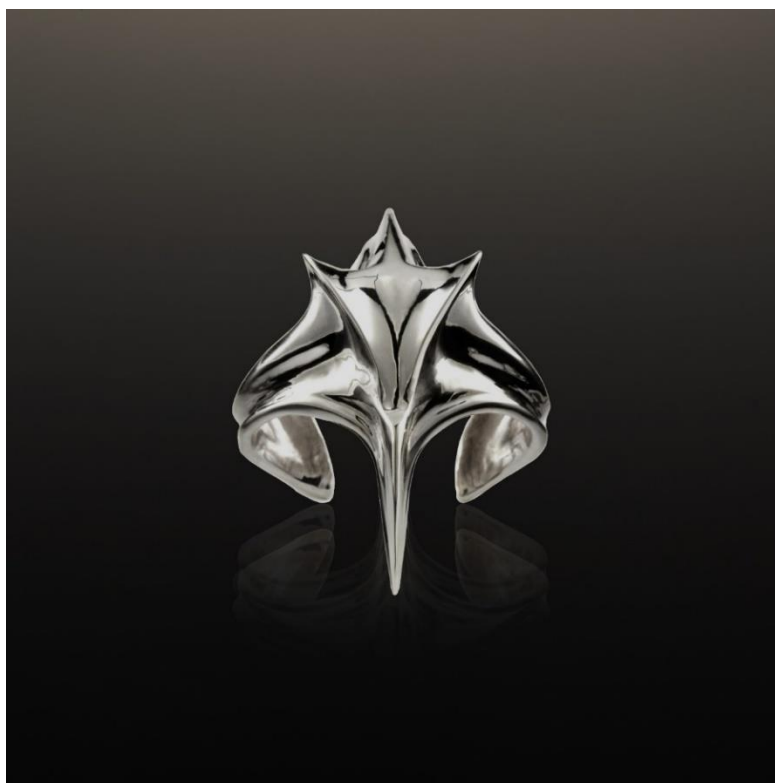
Kuva 2. Kalle Hakola, FO/TIE#01 tie jewelry, 2023 (Kalle Hakola)

Toinen vahva inspiraation lähde oli korusuunnittelijan Kalle Hakolan teos FO/TIE#01 tie jewelry (kuva 2). Tämä koru on valmistettu 925 hopeasta ja se on tarkoitettu pukea kravatin päälle, teoksen teema on hyvin lähellä omaani. Teoksen tarkoitus on tuoda miesten juhlapukeutumiseen jotain uutta. Hakola (2023) sanoo vaikka pukeutumiseen liittyvät rajoitteet ovat purkautuneet ja erilaiset tyylit ovat vapautuneet, ei muutos ole juuri saavuttanut miesten juhlapukeutumista (Hakola 2023). Tämä idea on läsnä omassa työssä ja samaistun Hakolan teokseen.