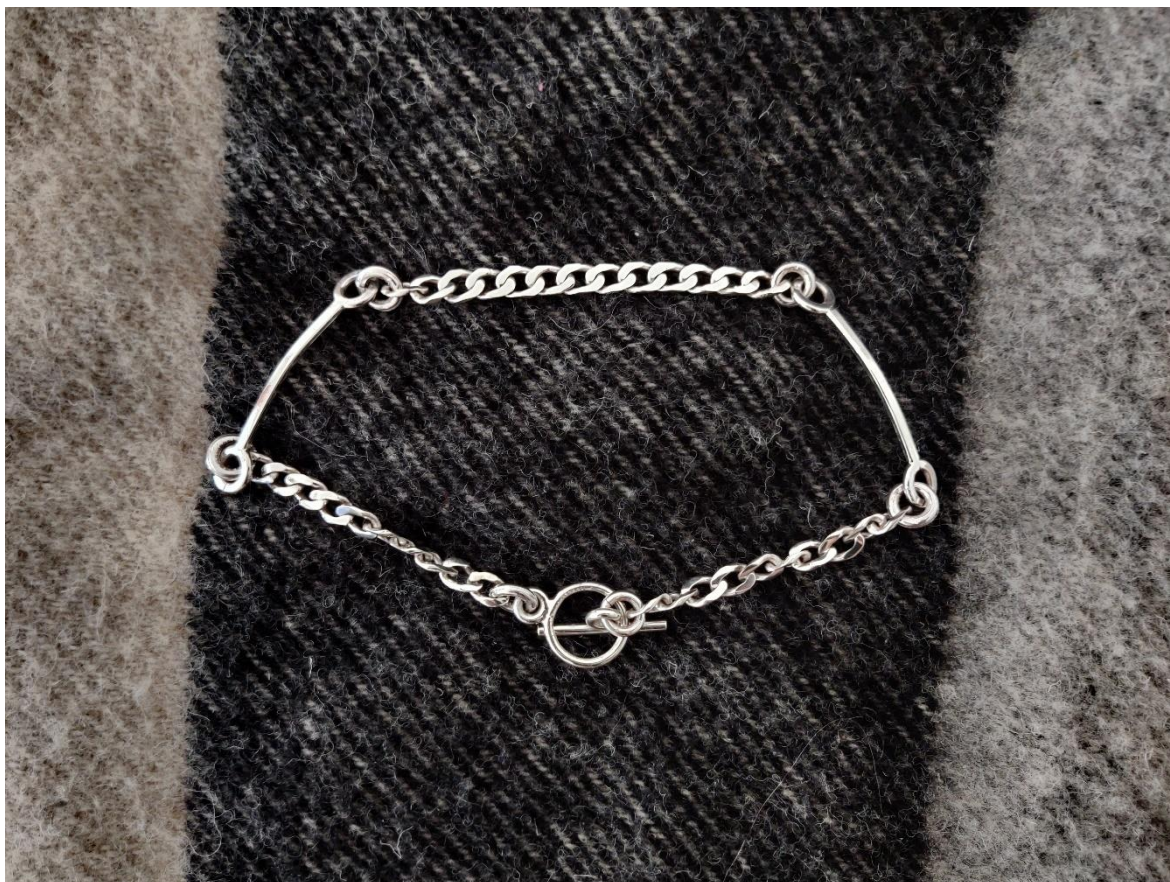
Kuva 9. "Bit necklace"