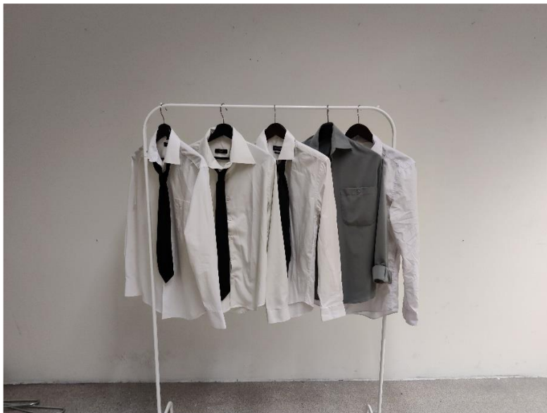
Kuva 17. Ripustus harjoitus vaatetelineellä

Ripustin yhden paidan katosta siimojen avulla (kuva 18), tämä toi teokseen ilmavuutta ja mystisyyttä. Ajatuksena oli ripustaa joko kaikki paidat katosta tai ripustaa vain paita, jolla oli koru päällä, tämä oli mielenkiintoinen ripustus mutta pidin enemmän alkuperäisestä ideasta, jossa paidat olivat ripustettu henkareista seinälle. Leijuva paita oli kiinnostava kokeilu mutta taivuin seinäripustukseen testien jälkeen. Halusin käyttää teoksessani metallisia henkareita, jotka sain käyttöni koulusta, ne sopivat täydellisesti valkoisten paitojen ja hopeisen korun kanssa yhteen.