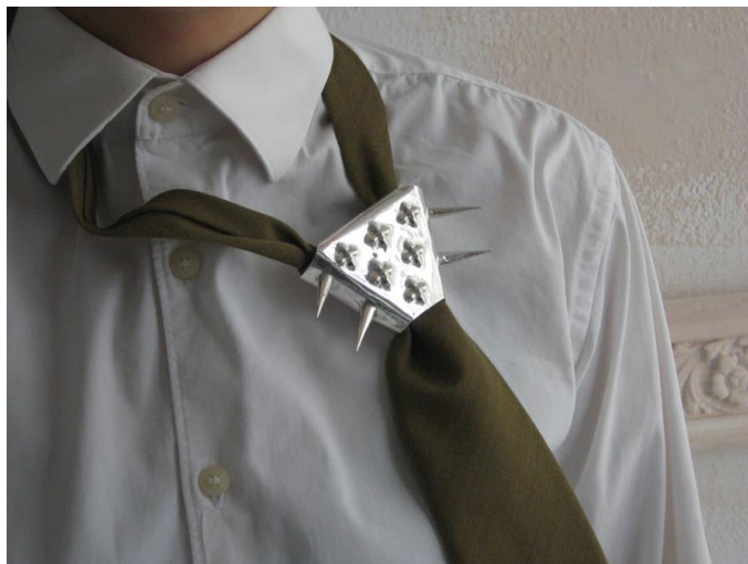
Kuva 1. ZWYRTECH, silver tieguard, 2024 (ZWYRTECH)

Toinen vahva inspiraation lähde oli korusuunnittelijan Kalle Hakolan teos FO/TIE#01 tie jewelry (kuva 2). Tämä koru on valmistettu 925 hopeasta ja se on tarkoitettu pukea kravatin päälle, teoksen teema on hyvin lähellä omaani. Teoksen tarkoitus on tuoda miesten juhlapukeutumiseen jotain uutta. Hakola (2023) sanoo vaikka pukeutumiseen liittyvät rajoitteet ovat purkautuneet ja erilaiset tyylit ovat vapautuneet, ei muutos ole juuri saavuttanut miesten juhlapukeutumista (Hakola 2023). Tämä idea on läsnä omassa työssä ja samaistun Hakolan teokseen.