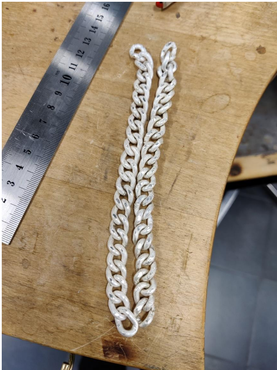
Kuva 14. Riipuksen ketjut

Kun ketjut oli viilattu haluttuun muotoon, oli aika juottaa ne yhteen. Ketjut juotettiin yhteen jokaisen lenkin kohdalta, jotta kaksi ketjua muuttuu yhdeksi. Ketjujen yhteen juoton jälkeen täytyi niitä vielä viilata kummaltakin puolelta, sekä sivuista jotta muodosta saadaan litteämpi ja tasaisempi. Ketjuun tehtiin hopeinen päätyosa, josta se tulee kiinni renkaaseen, tämä rengas tulee puolestaan kiinni korun solmu osaan kahdella pienellä lenkille, joille oli aiemmin porattu reiät.