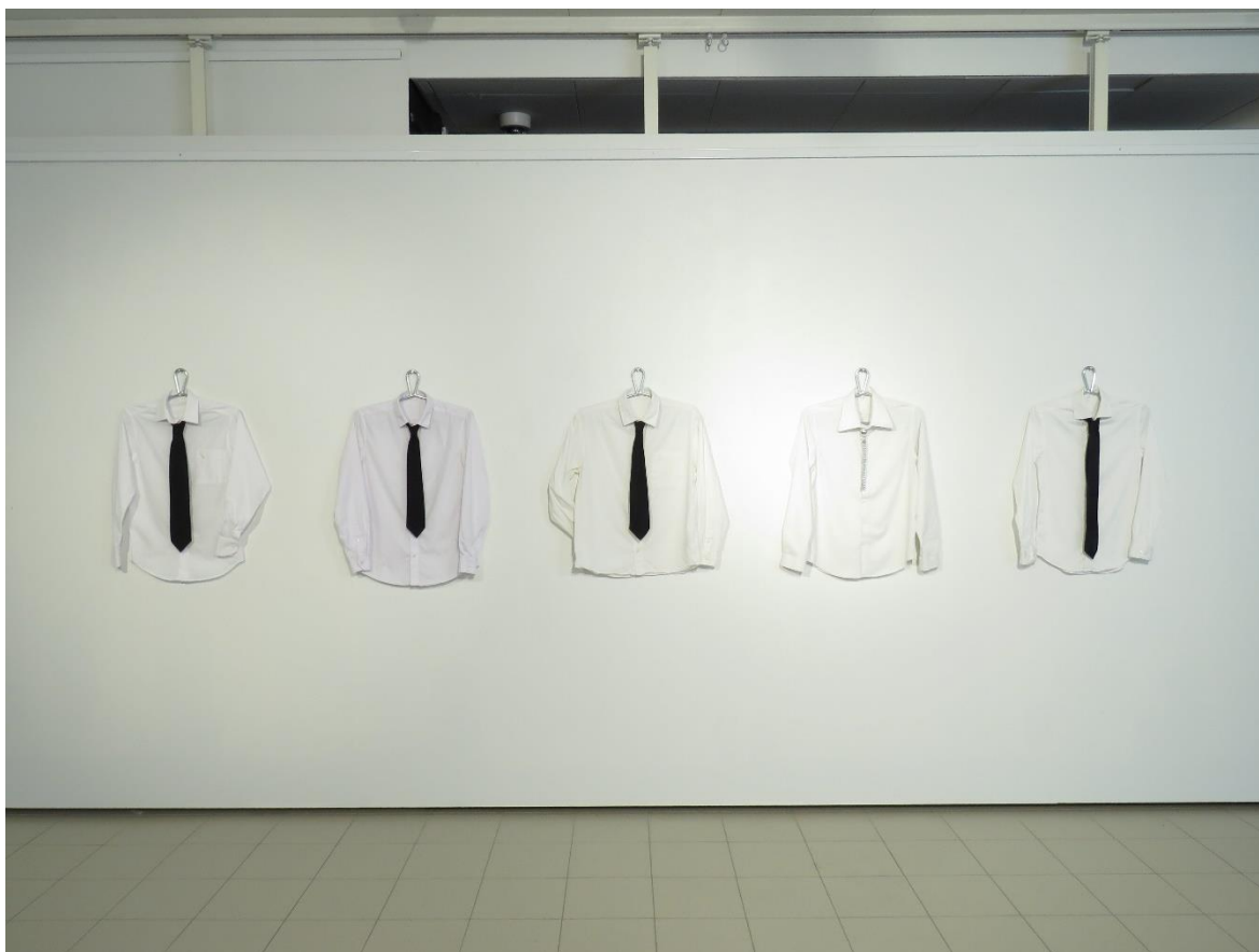
Kuva 19. valmis installaatio

Ripustus on ajateltu siten että se tuo paidat esiin ryhdikkäsi ja asetellusti kukin samalla korkeudella ja samanarvoisia, kaikkien paitojen hihat ovat asenneltu toisistaan hiukan eroaviin asentoihin antaen niille persoonaa, ja kireyden tunnetta. Paita, jonka päälle koru on puettuna, on aseteltu siten että paidan hihat roikkuvat rennosti kummallakin puolella, myös paidan hihan napin ovat jätetty auki. Tämä tuo kyseiselle paidalle rentoutta ja vapauden tunnetta kuvastaen vapautta, jonka itsensä ilmaisemisesta voi saada.