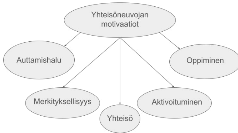
KUVIO 1. Yhteisöneuvojan motivaatiot.

Yhteisöneuvontaa tekevien statukset vaihtelivat työkokeilusta, kuntouttavaan työtoimintaan, palkkatukeen sekä palkattuun työntekijään. Puolet heistä oli tehnyt yhteisöneuvontaa jossain vaiheessa myös vapaaehtoisena. Saatu rahallinen korvaus ei tuntunut yhtä vastaajaa lukuun ottamatta tärkeimmältä, mutta pienistäkin kulukorvauksista oltiin kiitollisia ja neljä vastaajaa toivoi niihin myös korotuksia.