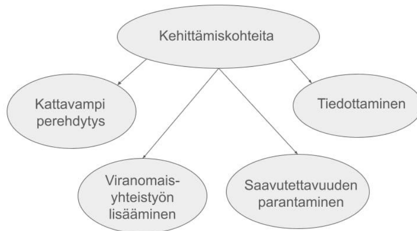
KUVIO 3. Ilmenneet kehittämiskohteet.

Kehittämiskohteina nousi yhteisöneuvonnan tunnettavuuden sekä tarjontatuntien lisääminen. Myös tulkin käyttömahdollisuutta toivottiin maahanmuuttaja-asiakkaita ajatellen. Hervannassa ollut aikaisemmin sosiaaliohjaaja säännöllisesti paikalla, mutta tämän loppuminen vuodenvaihteessa 2024-2025 koettiin suurena menetyksenä asiakkaiden asioiden edistämisen kannalta ja tätä toivottiin takaisin. Työyhteisö oli jo pyrkinytkin tekemään rakenteellista vaikuttamistyötä asian suhteen. Alla vastauksista koottu kuvio. (Kuvio 3.)