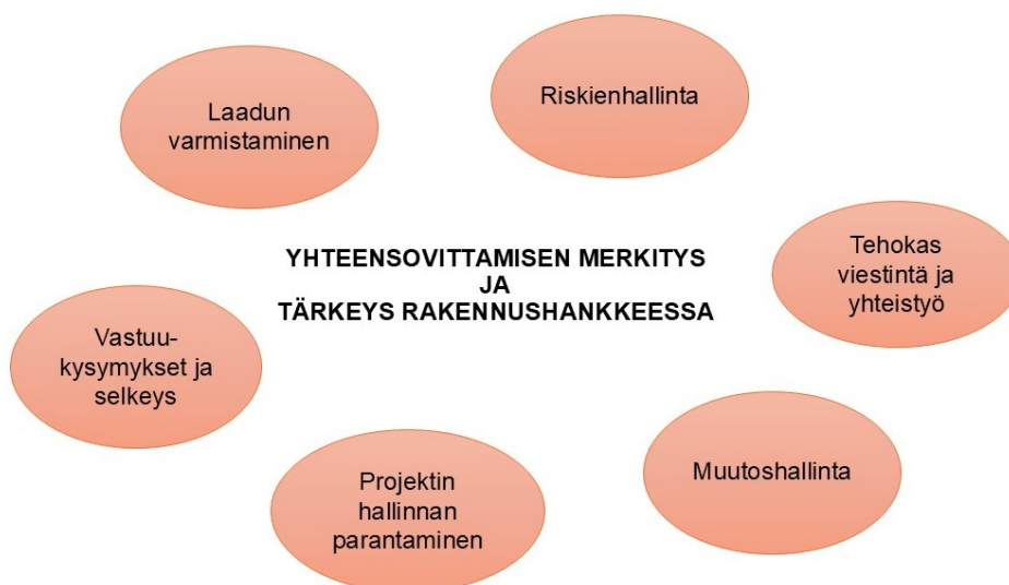
Kuvio 1. Yhteensovittamisen eri ulottuvuuksia rakennushankkeen eri osa-alueilla.

Näiden kaikkien toimijoiden yhteistyön sujuvuus edellyttää tehokasta yhteensovittamista, jolla tarkoitetaan eri suunnitelmien, aikataulujen ja tavoitteiden yhtenäistämistä koko hankkeen elinkaaren ajan. Myös opinnäytetyötä varten haastatellut asiantuntijat toivat esiin, että sujuva yhteensovittaminen on keskeinen osa projektin onnistumista ja erityisesti tämä tuli esiin tuotannon asiantuntijoiden näkemyksistä. Yhteensovittamisen onnistuminen voidaan ajatella vaikuttavan suoraan rakennushankkeen laatuun, kustannustehokkuuteen, aikataulun pitävyyteen sekä riskien hallintaan ja sen laiminlyönti taas voi johtaa vakaviin ongelmiin, kuten rakennusvirheisiin, lisäkustannuksiin ja aikataulun viivästymisiin.