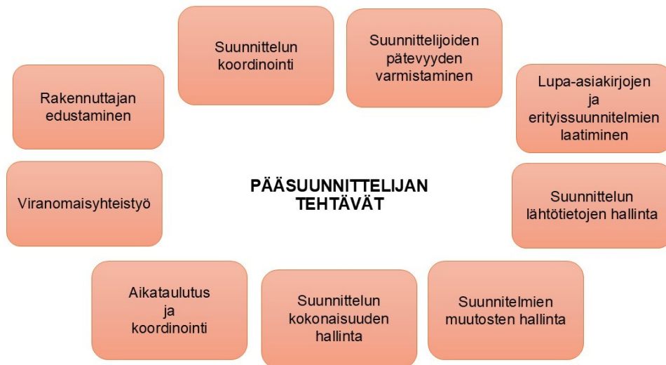
Kuvio 4. Pääsuunnittelijan tehtäviä

Pääsuunnittelijan rooli on keskeinen rakennushankkeen onnistumisen kannalta. Hänen on toimittava aktiivisesti hankkeen tavoitteiden saavuttamisen varmistamiseksi, tiedotettava asianmukaisesti osapuolille ja tarvittaessa käynnistettävä korjaavia toimenpiteitä, jos hankkeen etenemisessä havaitaan ongelmia. Pääsuunnittelijan vastuulle kuuluvat tehtävät voivat vaihdella hankekohtaisesti, mutta niiden täsmällinen määrittely sopimuksissa ja tehtäväluetteloissa on keskeistä onnistuneen projektin toteuttamiseksi. Alla on esitetty pääsuunnittelijan tehtävät selkeyttävässä kuvassa sekä listattuina tekstimuodossa, tehtävien sisällön ja merkityksen hahmottamiseksi.