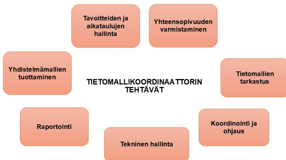
Kuvio 5. Tietomallikoordinaattorin tehtävien yleiskuvaus

Alla listattuna tietomallikoordinaattorin tehtäviä ja vastuita rakennushankkeessa. Tehtävät ovat monipuoliset ja nykyisten rakentamisen vaatimusten takia keskeiset rakennushankkeissa (RT 10-11076 2012; RT 10-11066 2012.)