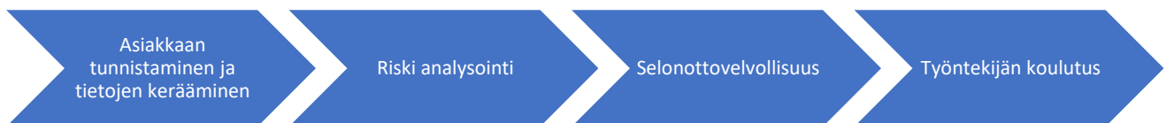
Kuva 3. Velvoitteet rahanpesun estämiselle (Laki rahanpesun ja terrorismin rahoittamisen estämisestä)

Asiakkaantunteminen tarkoittaa asiakkaan tuntemista ja tunnistamista, jotta palveluntarjoaja voi tarjota palveluja ja tuotteita. Se koskee rahalaitoksia, pankkeja ja muita finanssialan yrityksiä. Asiakkaan tunteminen on erityisesti rahanpesulain tarkoittama asiakkaan tuntemisen vaatimus. Lain tarkoitus on estää rahanpesu ja terrorismin rahoitus sekä helpottaa rikoshyödyn paljastamista ja takaisin saamista. Asiakkaan tuntemisen tavoitteena on myös estää laittoman varallisuuden liikkuvuus ja suojata rahamarkkinoita väärinkäytöksiltä. Rahanpesun estämisvelvoitteet on esitetty, kuten kuvassa 3. Alussa pankki kerää asiakkaan tunnistamiseen liittyvät tiedot kuten nimen, osoitteen, syntymäajan -ja maa. Lisäksi seurataan maksukäyttäytymistä sekä muita tietoja, jotka auttavat tunnistamaan epäilyttäviä rahavirtoja ja torjumaan rahanpesua sekä petoksia. Palveluntarjoajat varmistavat asiakkaan voimassa olevan henkilöllisyyden ja analysoivat heidän taloudelliset toimensa osana riskinhallintaa ja lainsäädännön noudattamista. Tämä tarkoittaa, että ilmoitusvelvollinen tekee epäilyttävien liiketoimien raportointia viranomaisille ja asiakassuhteiden jatkuvaa seuranta. (Laki rahanpesun ja terrorismin rahoittamisen estämisestä.)