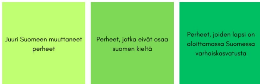
Kuva 1: Opinnäytetyön aiheen rajaus

Aiheena maahanmuuttajuus on laaja kokonaisuus, joten on tärkeää rajata aihetta työn tavoitteisiin sekä tarkoitukseen nähden (Kuva 1). Opinnäytetyömme aihe rajautuu koskemaan maahanmuuttajaperheitä, jotka ovat juuri Suomeen muuttaneita, eivät osaa suomen kieltä ja joiden lapsi on aloittamassa Suomessa varhaiskasvatusta.