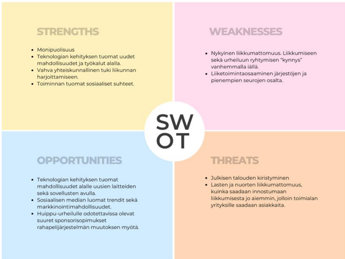
Kuva 2. SWOT-analyysi urheilu- ja liikuntatoimialasta.