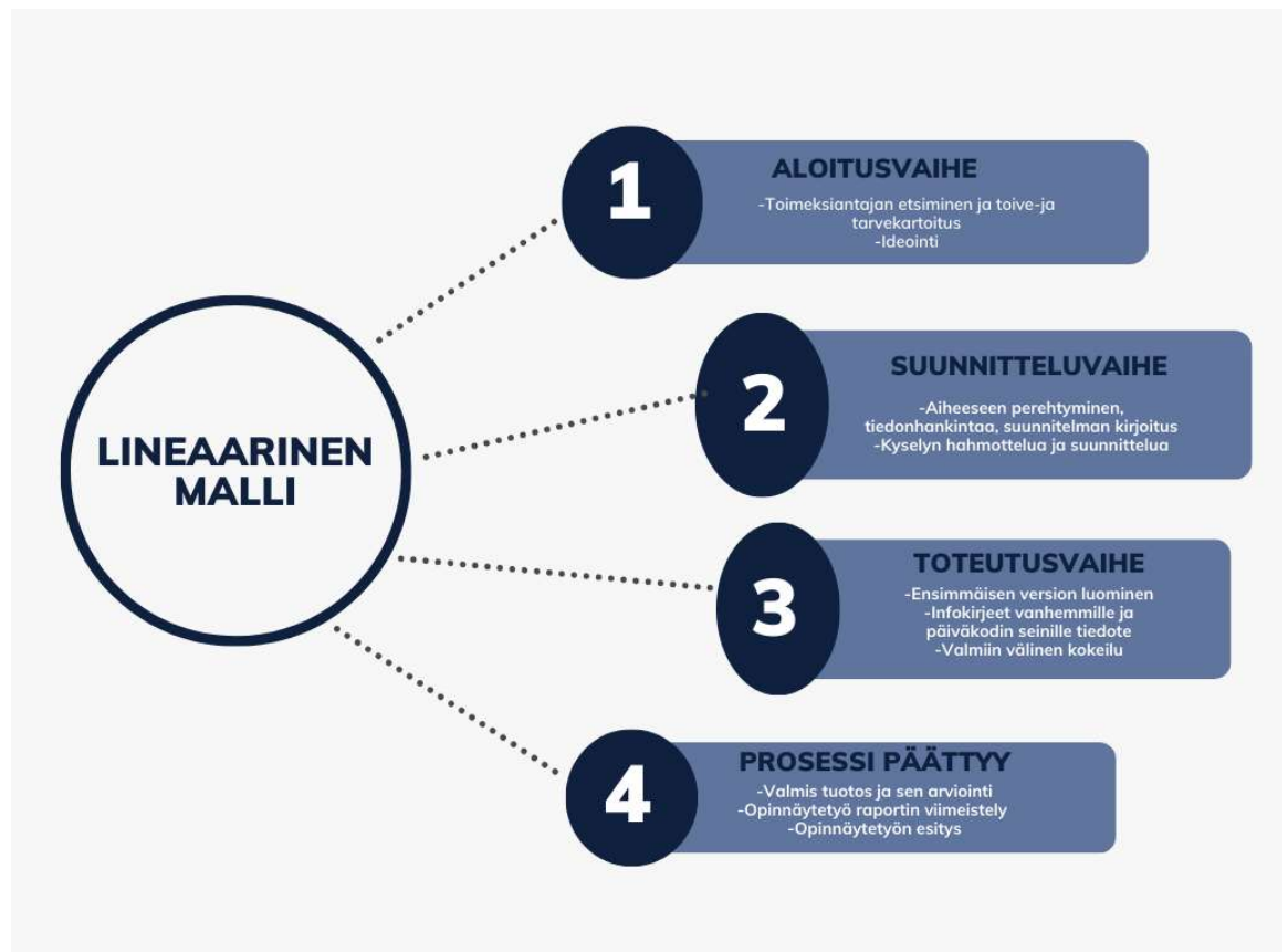
Kuvio 1 Lineaarinen malli. Toikko & Rantasen lineaarista mallia mukaillen (2009, 64.)

Opinnäytetyöprosessi mukailee Toikko & Rantasen (2009, 64) kehittämistyön lineaarista mallia (Kuvio 1). Linearisessa mallissa kehittämistyö etenee vaiheittain aloituksesta suunnitteluun, toteutukseen ja lopuksi toteutuksen päättämiseen (Toikko & Rantanen 2009, 64). Lineaarisen mallin käyttö sopii hyvin opinnäytetyöhöni, koska mallin avulla voi hahmottaa kehittämistyön kokonaisuuksia ja työni etenee aloitusvaiheesta prosessin päättämiseen sekä sen arviointiin.