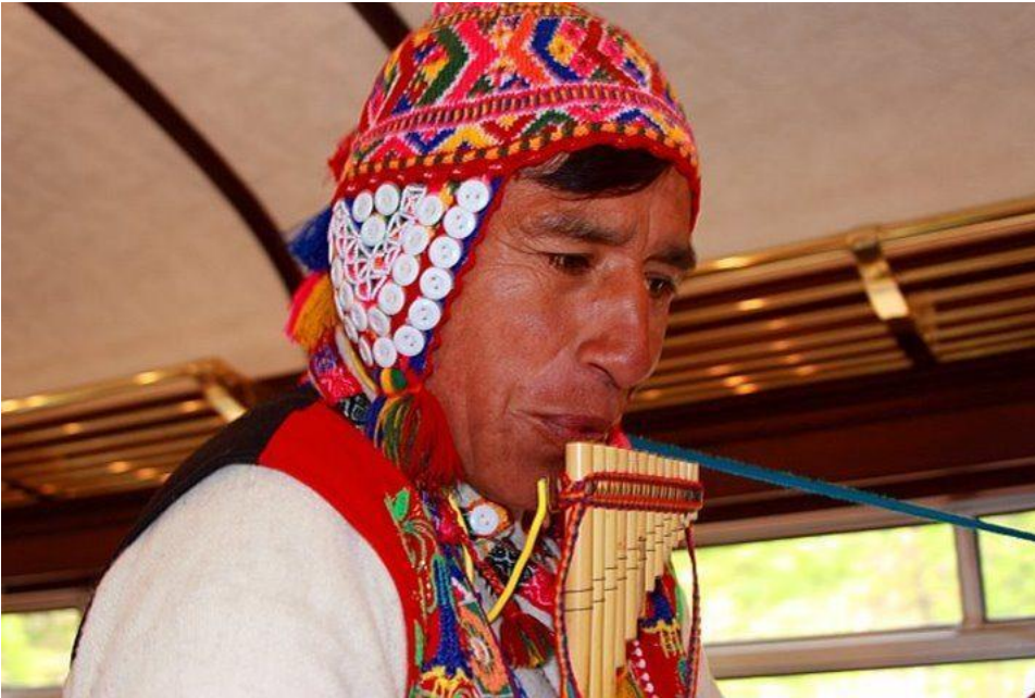
Kuva 8. Andimies soittamassa Sikua (Kolasinski, 9.5.2015)