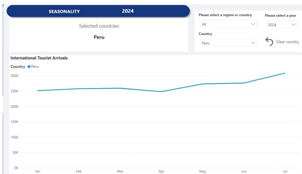
Kuva 9: Peruun saapuvat ihmiset kausittain (UN Tourism s.a. b.)

analyysi matkustuskeskeisistä auttavat optimoimaan markkinointistrategioita ja parantamaan palvelutarjontaa.