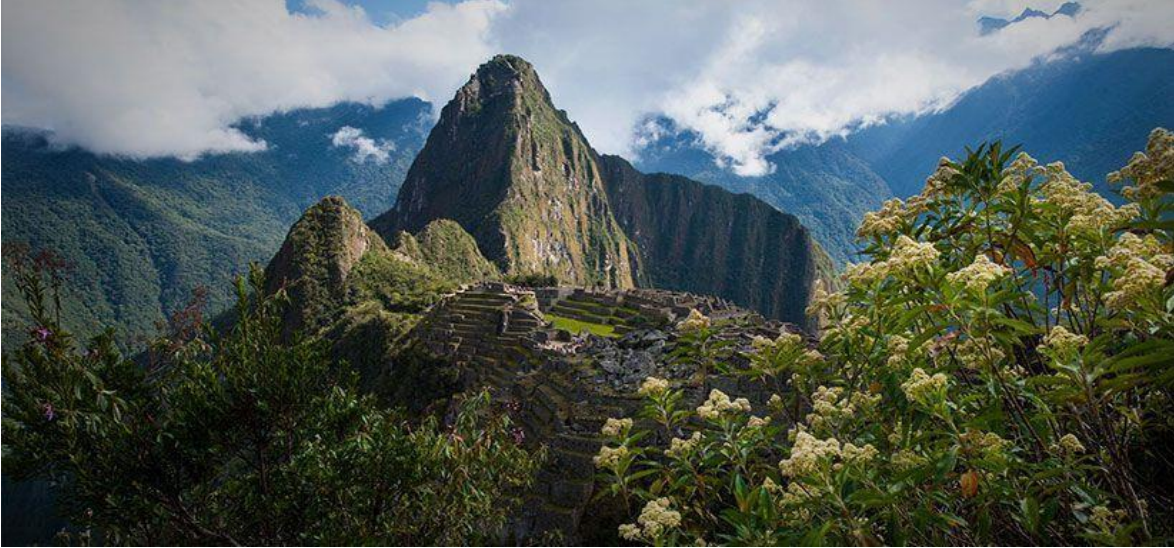
Kuva 12: Machu Picchun inkarauniot

tuhansia vierailijoita ympäri maailmaa. Machu Picchu symboloi Perun historiallista perintöä, mutta maan tarjoamat kokemukset eivät rajoitu tähän ikoniseen kohteeseen. (Romano 26.5.2019.)