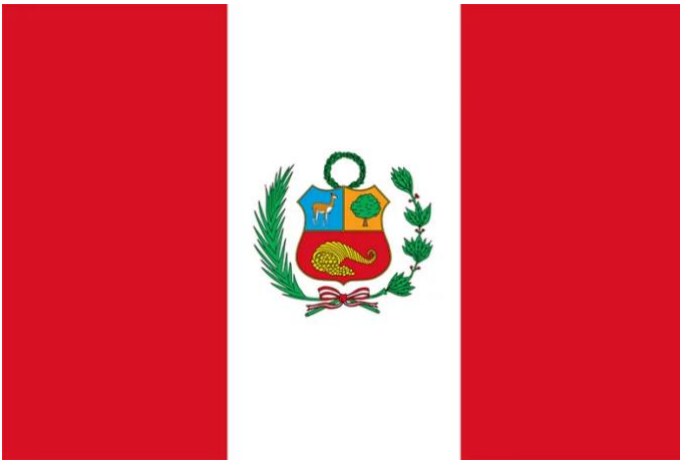
Kuva 7: Perun lippu (MaailmanLiput. s.a.)

Perun maantieteellinen monimuotoisuus – vuoristojen, aavikoiden, rannikkojen ja sademetsien vuorottelu – tekee siitä erityisen ainutlaatuisen maan luonnon kannalta. Amazonin sademetsä, joka kattaa merkittävän osan Perusta, tarjoaa valtavat biologiset ja ekologiset resurssit. Tämä luonnon monimuotoisuus heijastuu myös perulaisten elämäntavoissa ja kulttuurissa. Erilaiset ilmastovyöhykkeet ja maaston vaihtelevuus ovat muokanneet paikallisten yhteisöjen elämää ja selviytymisstrategioita vuosien varrella. Andien vuoristo, yksi maailman korkeimmista, on puolestaan täynnä myyttistä voimaa – ei ihme, että muinaiset Inkat uskoivat jumalien asuvan näissä korkeuksissa. Se kertoo paljon ihmisen suhteesta ympäröivään luontoon ja siitä, kuinka vuosisatojen ajan luonnon mahtavuus on synnyttänyt uskonnollista ja henkistä merkitystä. (National Geographic Kids. s.a.)