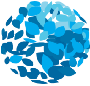
Kuva 4: EarthCheck logo (EarthCheck s.a.)