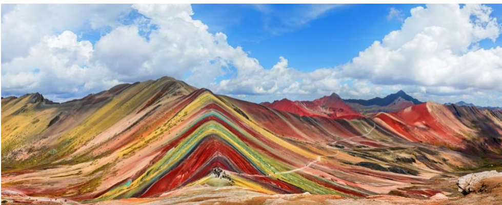
Kuva 13: Sateenkaarivuori Vinicunca (Mybestplace s.a.)

Perun maisemat ovat vaikuttavia, ja ne tarjoavat ulkoilun ja seikkailun ystäville unohtumattomia elämyksiä. Andien värikäs vuoristo, kuten kuvassa 13 näkyvä kuuluisa Sateenkaarivuori Vinicunca, sekä Amazonin sademetsän vesiputoukset luovat monipuoliset puitteet patikoinnille ja luonnon tutkimiselle. Perun Amazonin alue on erityisen houkutteleva, sillä sinne pääsee helposti esimerkiksi lentämällä Limasta Iquitokseen, joka toimii porttina sademetsään. (Romano 26.5.2019.)