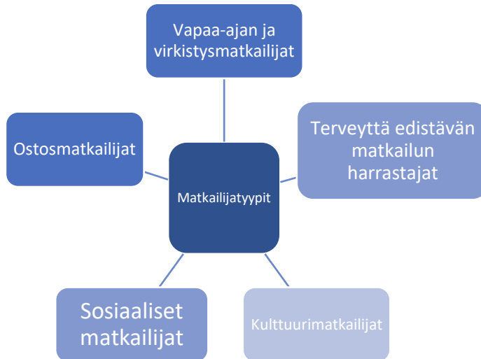
Taulukko 1: Matkailijatyypit (Ghete, A 2016.)

Vapaa-ajan ja virkistysmatkailijat hakevat matkustukseltaan rentoutumista ja maisemanvaihdosta. He edustavat usein kaupunkiväestöä, jotka haluavat irtautua arjestaan ja viettää aikaa luonnon keskellä. Näiden matkailijoiden lomat ovat yleensä lyhytkestoisia, esimerkiksi viikonloppumatkoja. Peru on varsinkin suomalaisille sen verran kaukainen kohde, että matkan tänne tulisi kestää vähintään viikon.