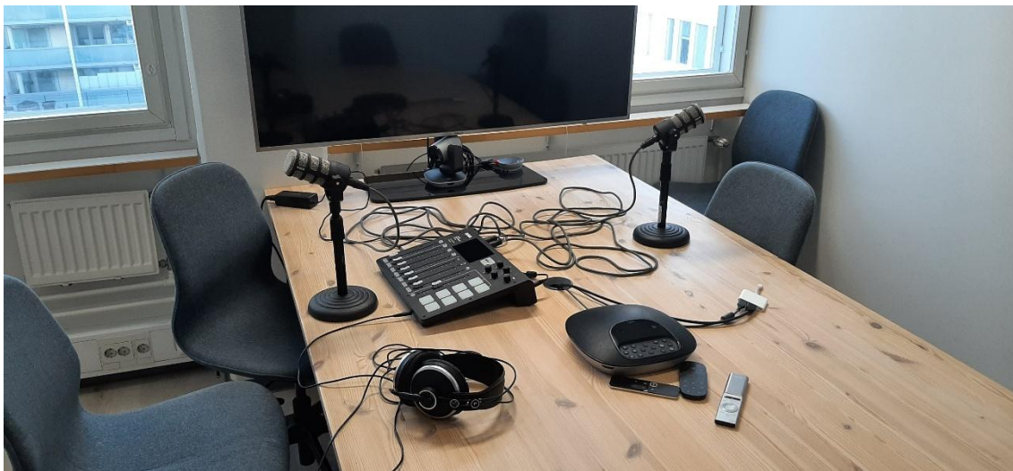
Kuva 2: Sama podcast-laitteisto asennuksen jälkeen.

Suunnitelmiin kuuluu myös luoda tunnusmusiikki ja äänimaisema kyseiselle podcastille. Sen on tarkoitus olla tunnelmaltaan rauhallinen ja riisutun kuuloinen. Mielestäni akustisella kitaralla soitetut esimerkit kuulostivat omaan korvaan sopivilta ja paremmin podcastin teemaan ja tunnusmusiikiksi hyvin istuvilta soittimilta. Suunnitelmiin kuuluu myös luoda tälle kyseiselle podcastille graafisesti sopiva logo tai ulkoasu. Sen olisi tarkoitus näkyä Spotifyssa, jonne valmis jakso lopulta julkaistaisiin. Ohjelman logo näkyisi luonnollisesti tietokoneen ruutua katsoessa vasemmassa ylä laidassa ja oikealla vähän isompana kokonaisuutena.