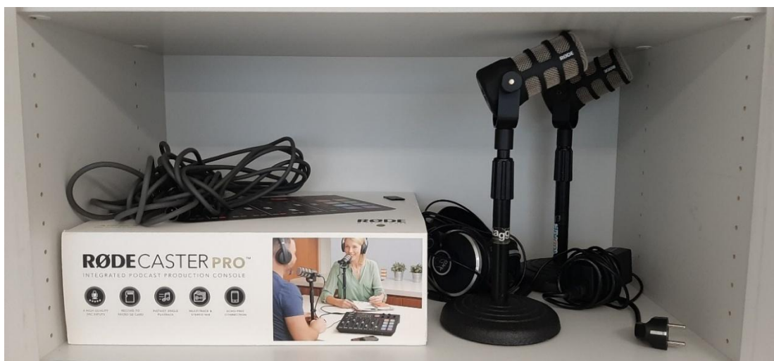
Kuva 1: Rodecaster Pro-tuotepaketti ennen asennusta.

Ennen äänitystä halusin tehdä perustavanlaatuisen perehdytyksen juuri niihin laitteisiin, joita harjoittelupaikalta löytyi käyttöön. Sain käytettäväksi Rodecaster Pron, jossa oli kaikki mahdolliset johdot, piuhat, mikrofonit, kuulokkeet ja äänipöytä. Ohjeistusta tuli etenkin niiden skenaarioiden varalta, mikäli äänityksessä ilmenee ongelmia tai koko äänityspöytälaitteeseen tulee jotain muita teknisiä ongelmia.