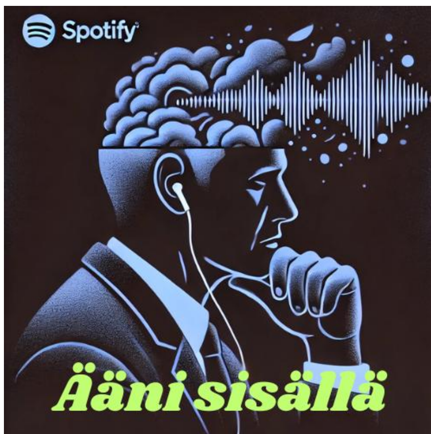
Kuva 3: Ääni sisällä podcastin kansikuva, joka on luotu tekoälyllä. (ChatGPT 2025)