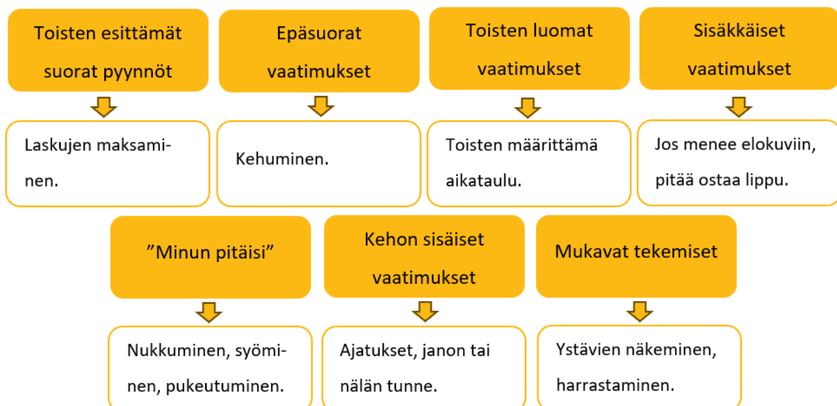
Kuvio 1. Moninaiset vaatimukset

Vaatimukset ovat yksilöllisiä sekä moninaisia tarpeellisia asioita arjen ympärillä. Toisten esittämät suorat pyynnöt esimerkiksi laskujen maksaminen tai kenkien laittaminen jalkaan ovat näitä vaatimuksia. Myös muita vaatimuksia ovat muun muassa epäsuorat vaatimukset, kuten kehuminen. Tällöin tulevien suoritusten odotukset voivat kasvaa ja aiheuttaa ahdistusta. Toisten ihmisten luomat vaatimukset omien vaatimusten päälle sekä epävarmuus horjuttaa PDA-piirteisen hallinnan tunnetta. Sisäkkäiset vaatimukset eli vähäiset epäsuorat vaatimukset sisältyvät suurempaan vaatimukseen, kuten esimerkiksi elokuviin mentäessä tulee ostaa lippu. Päivittäisessä elämässä tulee ”minun pitäisi”- tuntemuksia. Näitä ovat esimerkiksi nukkuminen, sängystä nouseminen, syöminen, pukeutuminen, peseytyminen sekä oppiminen. Myös oman kehon sisällä on vaatimuksia, kuten ajatukset, toiveet, janon tai nälän tunne ja vessassa käyminen. Mukavat tekemiset, kuten ystävien näkeminen, harrastaminen sekä erityistilanteet ovat myös vaatimuksia. (Mitä on PDA? 2022, 5.)