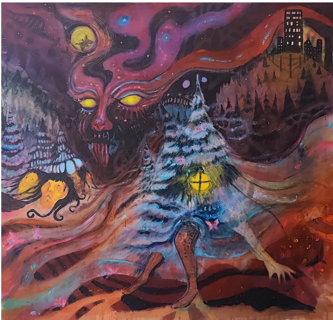
Kuva 2, "Sysi", akryyli/öljy kankaalle, 120 x 100cm, 2022

Huomaan, kuinka muuttaessani kaupunkiin, alkoi tähän luonnontäyteiseen maisemaan sekoittua kerrostaloja ja muita urbaaneja elementtejä. Kuinka tuntuu puille kasvoivat käsiä ja muodostui kasvoja.