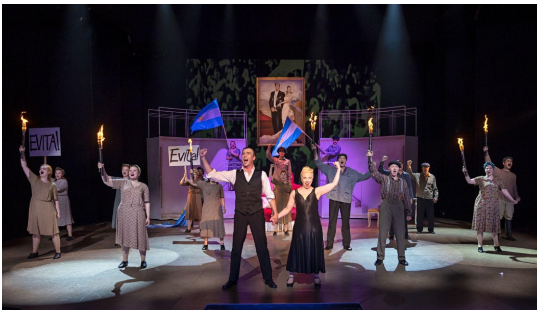
Kuva 2: Evita, Jyväskylän kaupunginteatteri (Jiri Halttunen 2023)