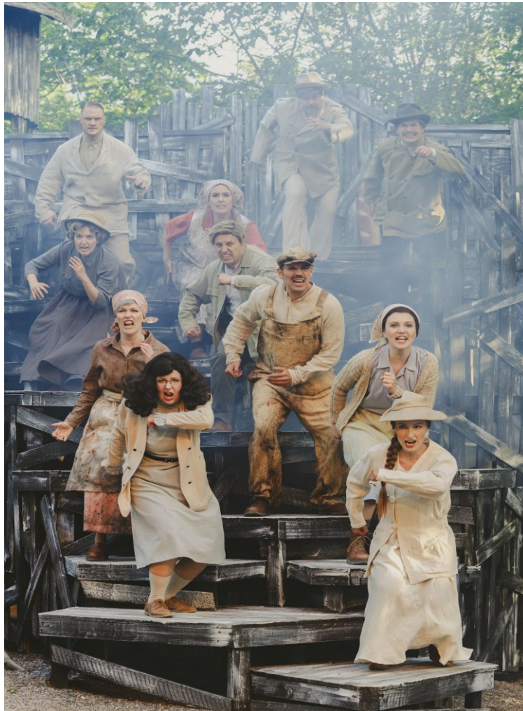
Kuva 7: Bonnie & Clyde, Samppalinnan kesäteatteri (Otto-Ville Väättäinen 2024)

Mainittakoon vielä, että työharjoittelun pedagoginen näkökulma oli tässä tapauksessa huomioitu erityisen hyvin taiteellisen työryhmän toimesta. Meitä työharjoittelijoita kohdeltiin kuten kaikkia muitakin, mikä on kaikkien työharjoittelukokemukseni kohdalla tuntunut tärkeältä, mutta tässä tapauksessa meille järjestettiin myös muutama keskusteluhetki ohjaajan ja esimerkiksi kapellimestarin kanssa. Näissä tilanteissa saimme kysellä ja keskustella työelämään liittyvistä asioista. Nämä keskustelut lisäsivät ymmärrystäni alasta.