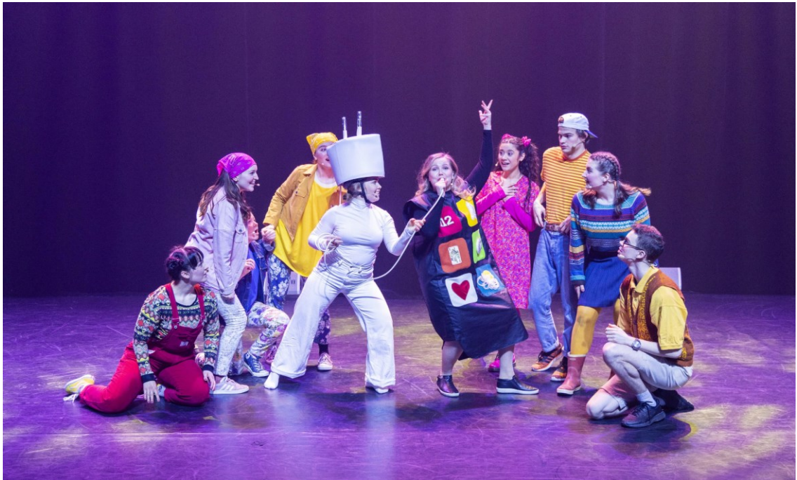
Kuva 1: Rikkinäinen puhelin, Tampere-talo (Anna-Kaisa Noki-Helmanen 2022)

“Kun päästät mielikuvituksen valloilleen, mielikuvituksen päivään harmaaseen. Koirat osaa sukeltaa ja norsut liidellä, jätskin pystyt tilaamaan sä kielellä viidellä. Kun päästät mielikuvituksen valloilleen, mielikuvituksen päivään harmaaseen. Antaa hetken ideoiden laukata, saat poutapilven reunastakin haukata.” (Viitaniemi 2022)