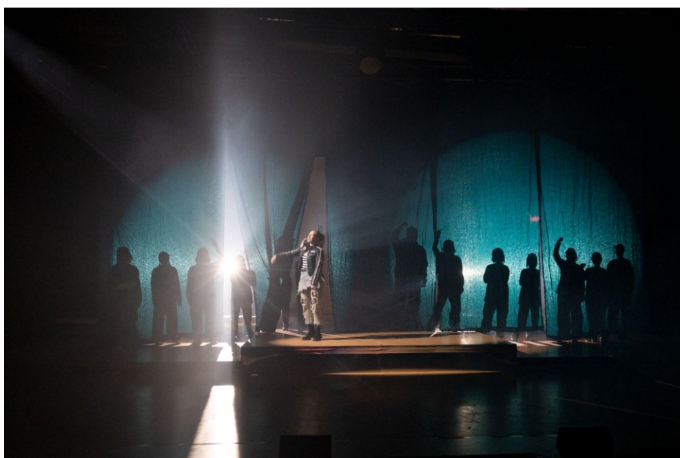
Kuva 9: Bosslady, Jyväskylän kaupunginteatteri (Jiri Halttunen 2024)

Tämä teos ei varsinaisesti nauttinut valmistuessaan olosuhteiden helppoudesta: teatteri siirtyi syksyllä peruskorjauksen tieltä väistötiloihin, mikä luonnollisesti vaikutti myös esityksen harjoitteluun. Lisäksi kantaesityksen tekemiseen liittyy jo valmiiksi paljon vapauden ja avointen kysymysten luomia prosessin piirteitä, jotka tekevät työskentelystä kenties hieman hitaampaa. Taiteellinen prosessi on jatkuvaa ja teos luonnollisesti hakee muotoaan viimeiseen asti. Tekstiä tai muuta materiaalia saatetaan hioa tai muuttaa viime hetkillä ja asioiden paikalleen loksahtaminen voi viedä enemmän aikaa, koska valmiita vastauksia ei ole välttämättä kellään. Muuttuvia tekijöitä oli siis loppuun asti poikkeuksellisen runsaasti, mutta yhteen hiileen puhaltuen esitys saatiin onnistuneesti maaliin. Kaikenlaista odottamatonta voi tulla eteen näissäkin hommissa, ja monesti kysytäänkin sopeutumiskykyä. Näytöskauden aikana oli onneksi aikaa ja tilaa teoksen kypsymiselle, kuten aina. Se on joka kerta palkitseva vaihe.