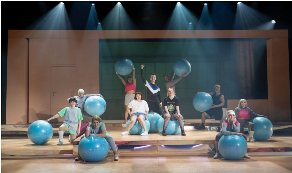
Kuva 8: Bosslady, Jyväskylän kaupunginteatteri (Jiri Halttunen 2024)