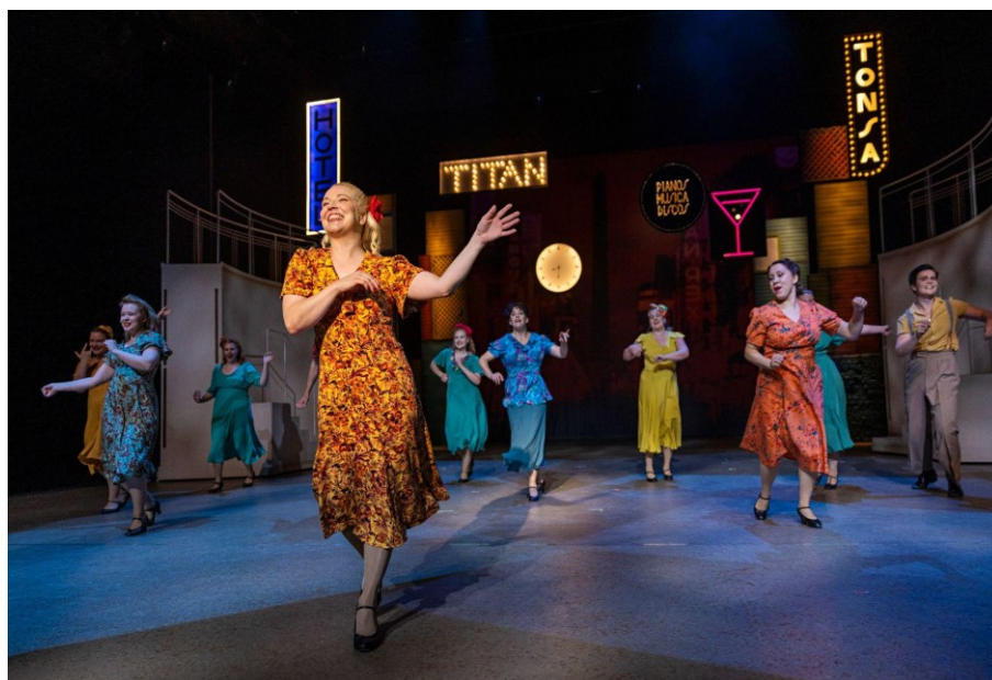
Kuva 6: Evita, Jyväskylän kaupunginteatteri (Jiri Halttunen 2023)

Kuten todettua, tämän produktion kohdalla kokonaisharjoitusmäärä nousi korkeaksi, ja toisaalta harjoitusaikaa pystyttiin käyttämään tehokkaasti. Näin ollen oli ilo huomata sekä henkilökohtaisesti että kollektiivisesti, miten hyvään ja varmaan kuntoon teos saatiin ensi-iltaan mennessä. Työryhmän yhteistyö toimi siis hienosti.