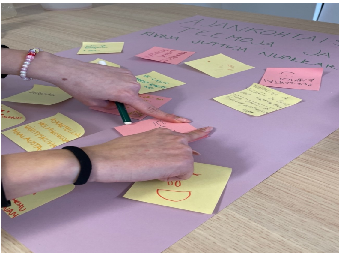
Kuva 1. Ideointia kartongille.

Havainnointi oli toiminnallisessa osuudessa koko ajan avainasemassa. Havainnoinnin avulla on mahdollista kerätä tietoa ihmisten käyttäytymisestä tai luonnollisten ympäristöjen tapahtumista. Tutkimuksellinen havainnointi ei ole mitä tahansa satunnaista vaan systemaattisesti tapahtuvaa tarkkailua. Havainnoinnin avulla voidaan täydentää kerättyjä tutkimustuloksia. (Moilanen ym. 2015, 114-115.)