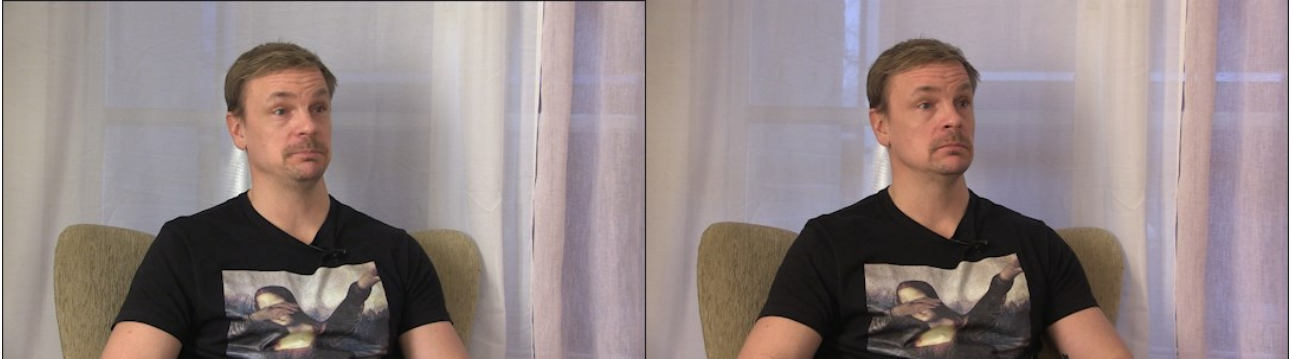
Kuva 1. Editoinnissa esiin tullut valotusvirhe kolmannessa haastattelussa.

valaistusta, mutta mitä pidemmälle ilta eteni, sen hämärämmäksi haastateltavan taustalla näkyvä valo kävi. 45 minuuttia kestäneen haastattelun aikana valoeron huomasi selkeästi editoinnissa, kuten kuvasta 1 ilmenee.