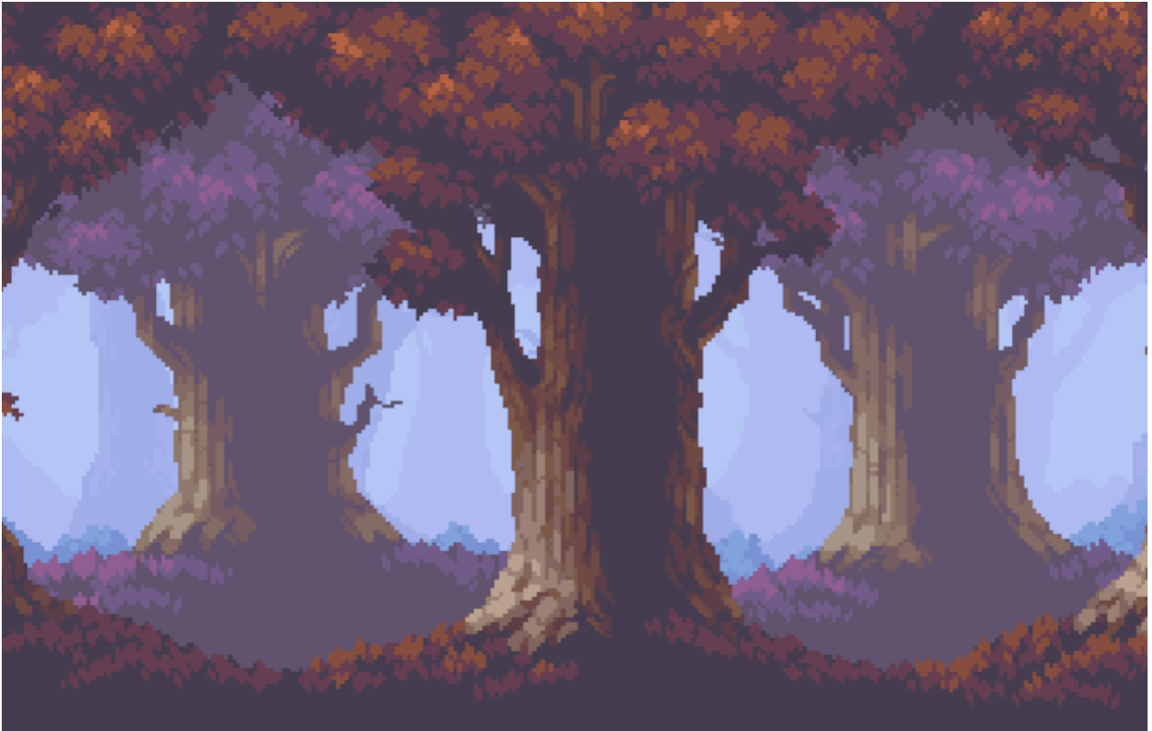
Kuva 3. Pelin taustakuva

Latasin taustakuvaa varten kolmesta kuvatiedostosta koostuvan peliresurssin. Kuvissa on tam- mista koostuva metsämaisema, jonka syvyys muodostuu kuvissa olevien puiden koon ja värisävyn vaihteluilla (kuva 3).