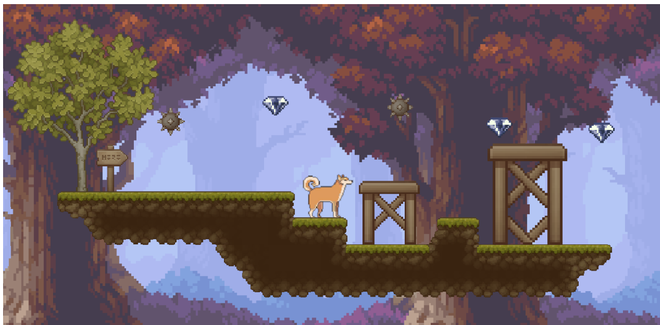
Kuva 6. Piikkiesteet lisäävät haastetta peliin