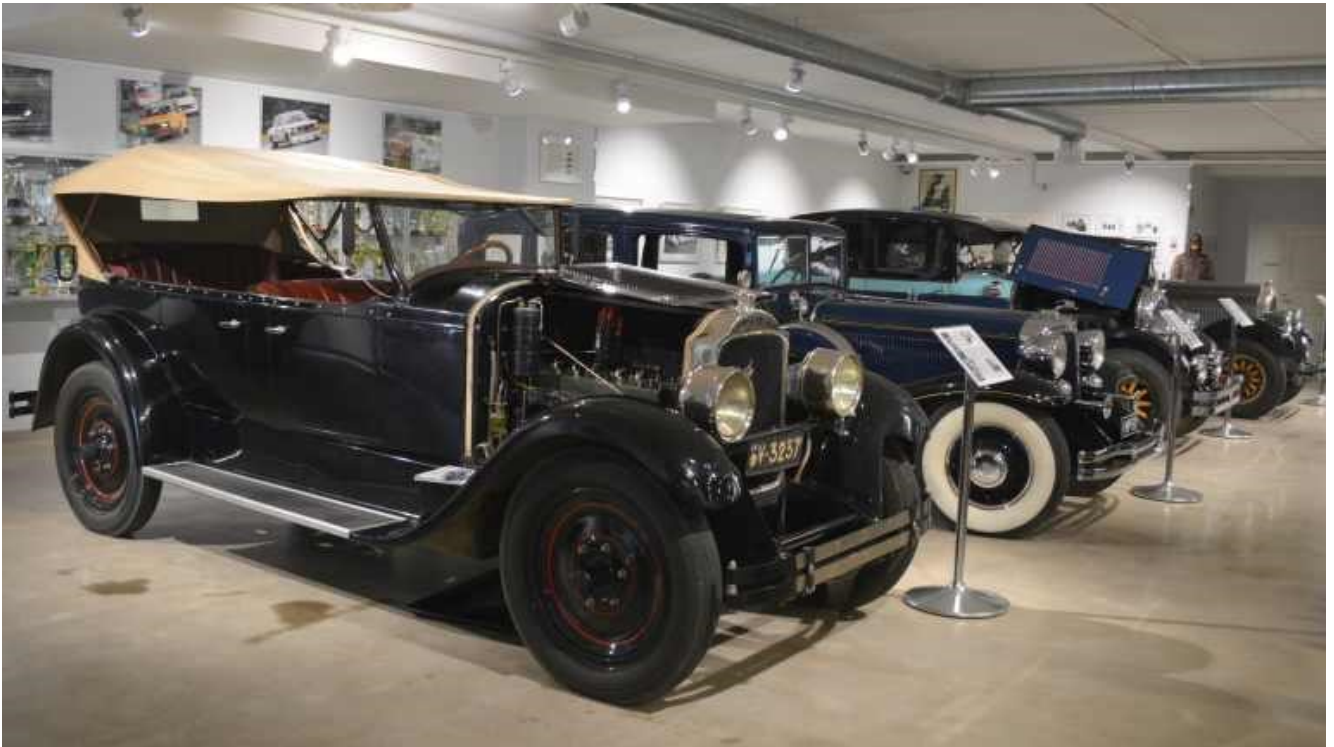
Kuva 6. Konservoidulla entisöity 1927 vuoden Packard, kuvassa etummaisina.

Kuvassa 6 on Woikosken kaasuteollisuusyrityksen 1930-luvun alussa vetykäyttöiseksi muuttama vuoden 1927 Packard (Yle, 2017). Ajoneuvo on poikkeuksellisesta muutoksesta huolimatta hyväksytty museoauto, koska sille tehdyn käyttövoiman muutoksen nähdään kuvaavan hyvin keskeisesti Woikosken kaasutehtaaseen liittyvää historiaa.