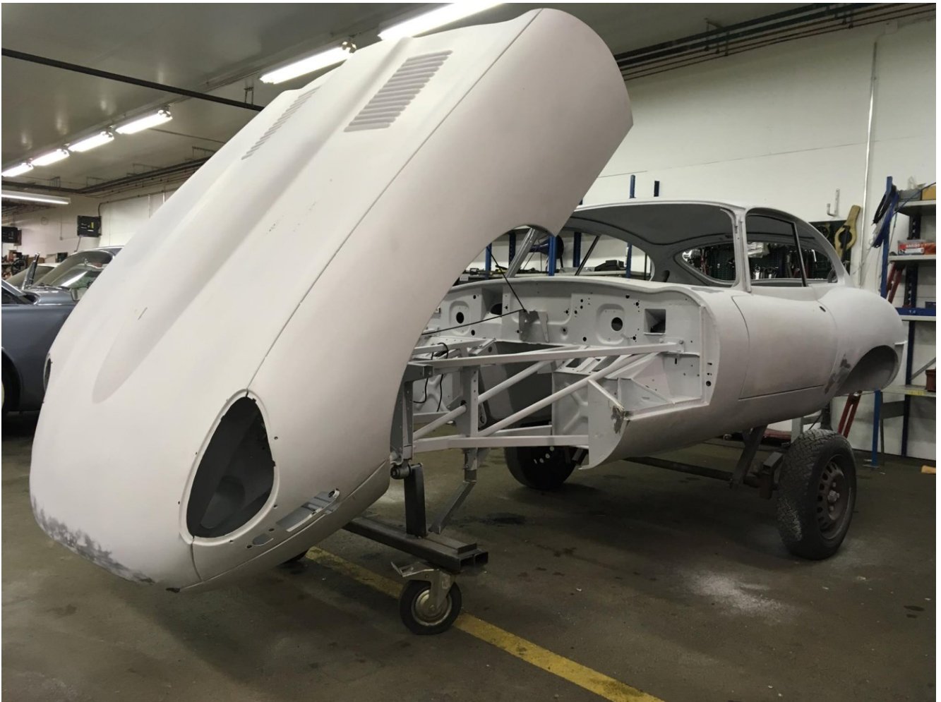
Kuva 1. Ajoneuvo täysentisöinnissä pelti- ja koritöiden aikana.

tyypillisesti olevan Suomen henkilöautokannan keski-ikä alueella, joka on ollut noin 13,6 vuotta vuonna 2024 (Autoalan Tiedotuskeskus, 2025). Autofabrikilla entisöityjen ajoneuvojen ikä taas voi vaihdella 20 ja 100 vuoden välillä, jolloin huolto- ja korjaustoimenpiteet eivät sovi yhteen modernien korjaamojen osaamisen eikä kaluston kanssa. Autofabrikilla korjattavina käyvät tai vain kustomointiin tulleet ajoneuvot saattavat kuitenkin olla hyvin paljon uudempia-kin (Ville Pihlava, henkilökohtainen tiedonanto, 26.3.2025). Entisöinti vaatii tekijältään ammattitaitoa, huolellisuutta ja arvostusta omaa työtään kohtaan. Entisöinti usein vaatii myös lasikuituosien korjausta, ajovalojen heijastinpintojen uusimista, puuosien entisöintiä ja värisävyjen muuttamista, jotka ovat nykyään hyvin harvinaisia taitoja autokorjaamoille (Autofabrik, 2025b). Harvinaisempiin taitoihin kuuluu myös Autofabrikin tekemät pelti- ja korimuutostyöt (kuva 1), sillä harvinaisiin yksilöihin peltiosia saatetaan joutua tekemään käsityönä (Autofabrik, 2025c).