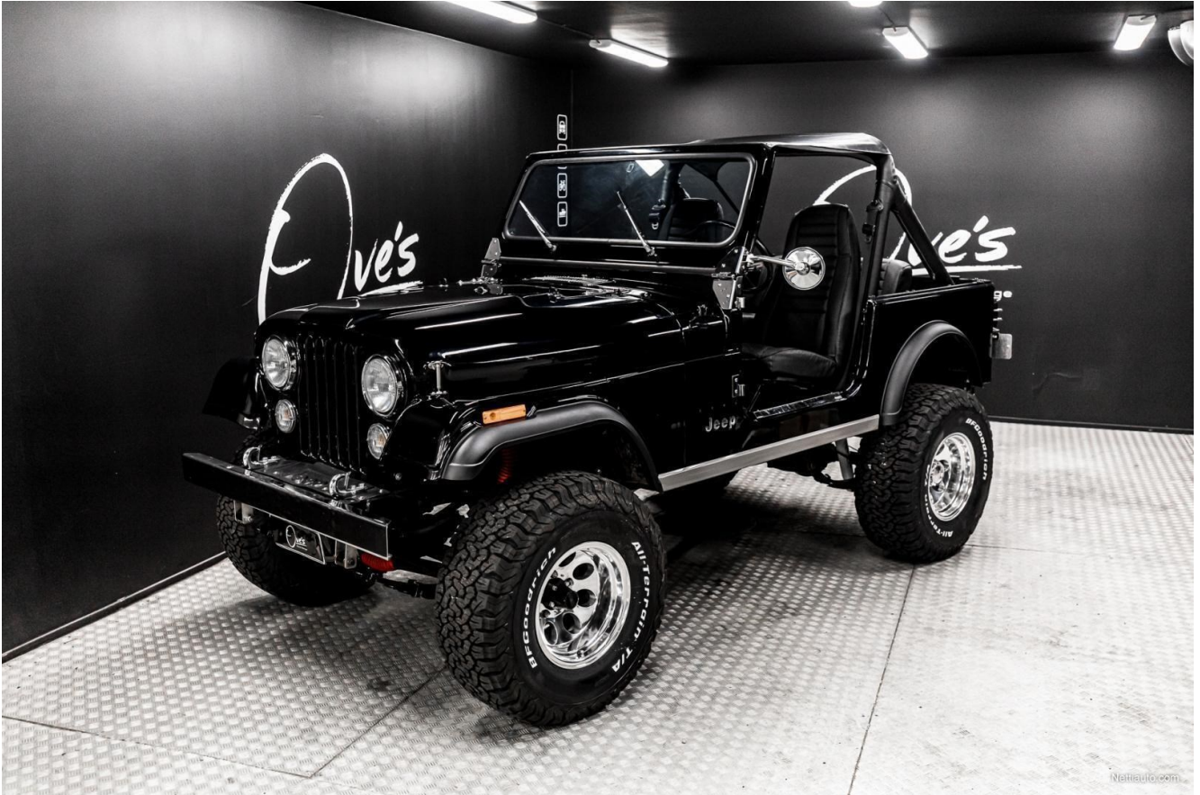
Kuva 7. Entisöity ja kustomoitu Jeep CJ7 Renegade.

Kun yhdistetään entisöinti ja kustomointi, ajoneuvosta voidaan tehdä kunnoltaan uutta vastaavaksi ja muokata suorituskykyä kehittyneemmäksi, kuten kuvan Jeep CJ7 Renegadelle on tehty (kuva 7). Ajoneuvo on entisöity uutta vastaavaan kuntoon, mutta poiketen alkuperäisestä siihen on asennettu suorituskyvyllisempi moottori, alustasarja, kustomoidut ovet ja katto sekä suuremmat renkaat (Nettiauto, 2024c). Ajoneuvo on esimerkki entisöinnistä, jossa iäkäs klassikko on korjattu täysin uuteen kuntoon ja kustomoitu alkuperäisestä poikkeavaksi. Vaikka Renegade-erikoismalli tarjoaa tavallista CJ7-mallia parempia maasto-ominaisuuksia, voidaan vastaavalla kustomoinnilla parantaa niitä entisestään.