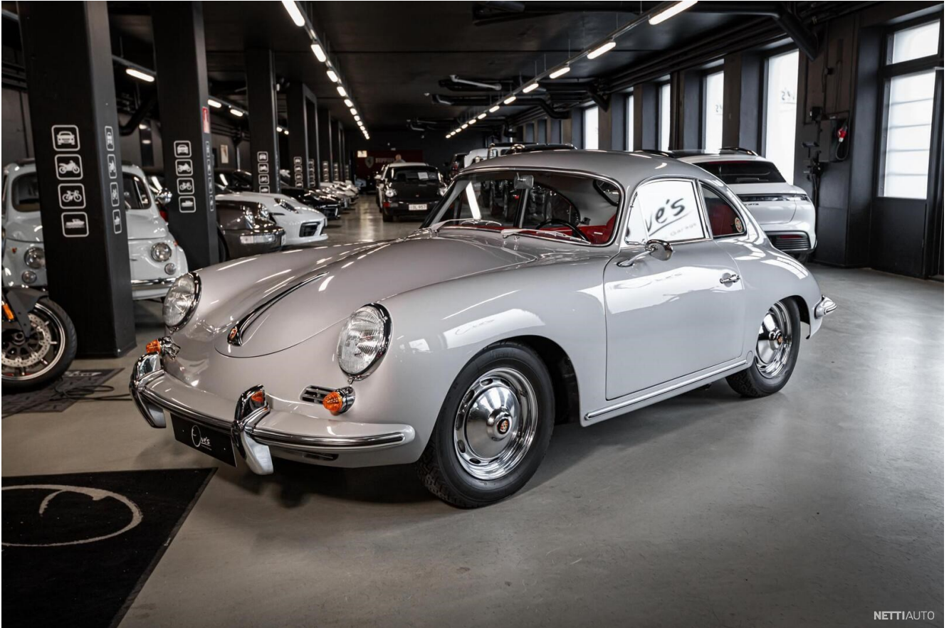
Kuva 3. Huolellisesti täysin alkuperäiseksi entisöity Porsche 356.

Esimerkkinä täysin alkuperäiseksi entisöidystä ajoneuvosta on kuvan Porsche 356 (kuva 3), joka on entisöity jokaista osaa myöten (Nettiauto, 2024a). Ajoneuvo on myös museorekisteröity. Esimerkkejä kyseiselle ajoneuvolle tehtävistä kustomoinneista, jotka eivät estä museointia, voisivat olla jarrujen parantelut tai niskatukien lisääminen. Koska nämä on tarkoitus tehdä aikakauden tyyliä mukaillen, esimerkiksi niskatukien tulisi vastata muuta verhoilua. Verhoilutyöt kuuluvat Autofabrikin palveluihin, ja ne tehdään ajoneuvon tyyliin ja käyttöön sopivasti (Autofabrik, 2025d).