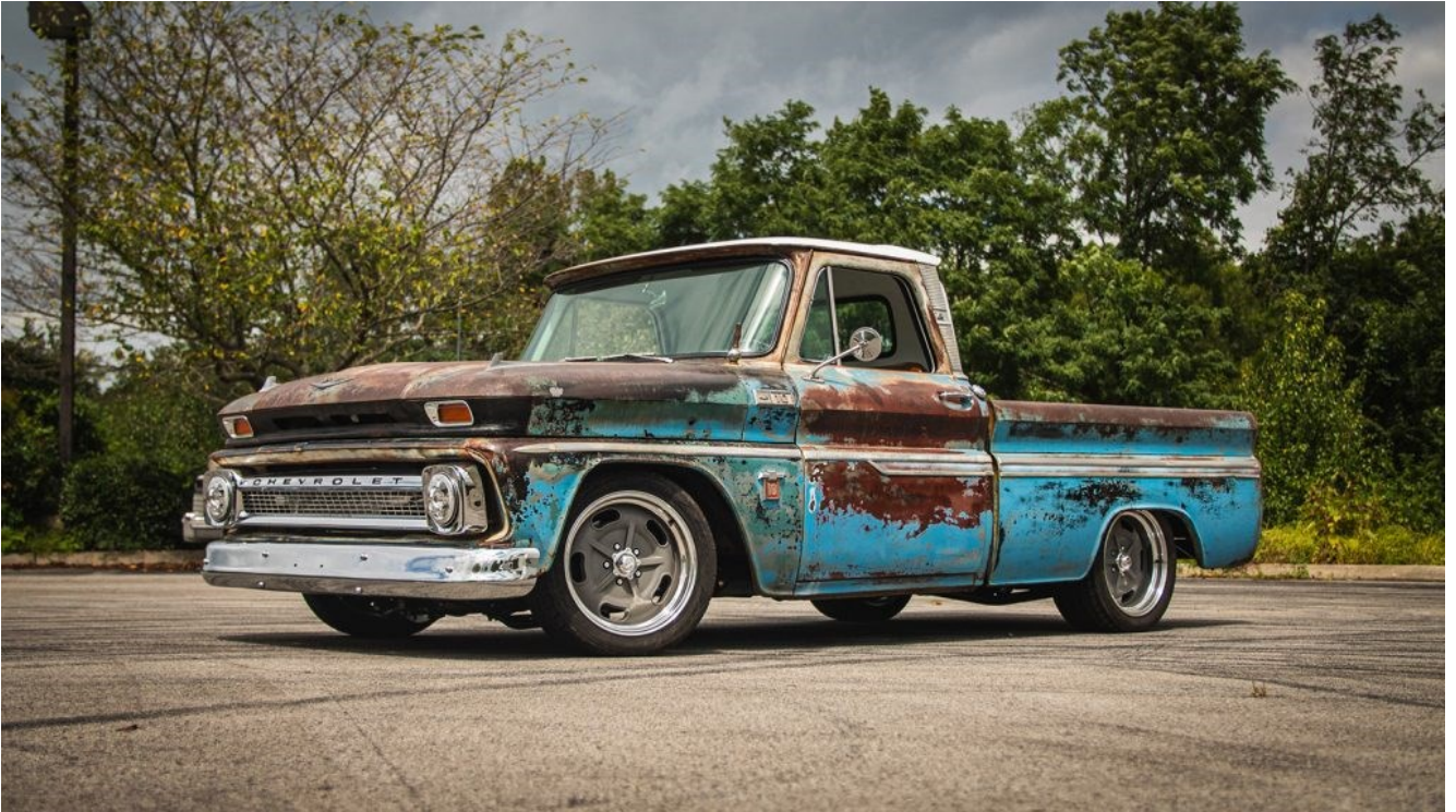
Kuva 5. Patinoitunut 1965 vuoden Chevrolet C10.

Konservointi on myös virallinen museoajoneuvon entisöintimetodi (SAHK, 1.2.2024b). Museoajoneuvon konservointi eroaa tavanomaisesta entisöinnistä siten, että silloin ajoneuvosta estetään rappeutuminen ja varmistetaan sen säilyminen muuttamatta varsinaisesti sen ulkonäköä, jolloin sen historiaa kuvaava kuluminen on säilytetty. Ajoneuvon alkuperäisestä poikkeavat muutokset ja kuluminen on mahdollista jättää ajoneuvoon, mikäli niiden nähdään kuvaavan kyseisen ajoneuvon käyttöhistoriaa. Tällöin ajoneuvosta saatetaan entisöidä esimerkiksi vain ajoneuvon käyttöön ja turvallisuuteen vaikuttavia osa-alueita, eikä sen ulkonäköä entisöidä (Trafic, 2011, s. 1). Konservoidulle museoajoneuvolle vaaditaan myös konservointisuunnitelma, josta selviää konservoinnin toteutustapa ja työvaiheet ennen ja jälkeen, sekä piirrokset ja kuvat rakenteista (SAHK, 1.2.2024c).