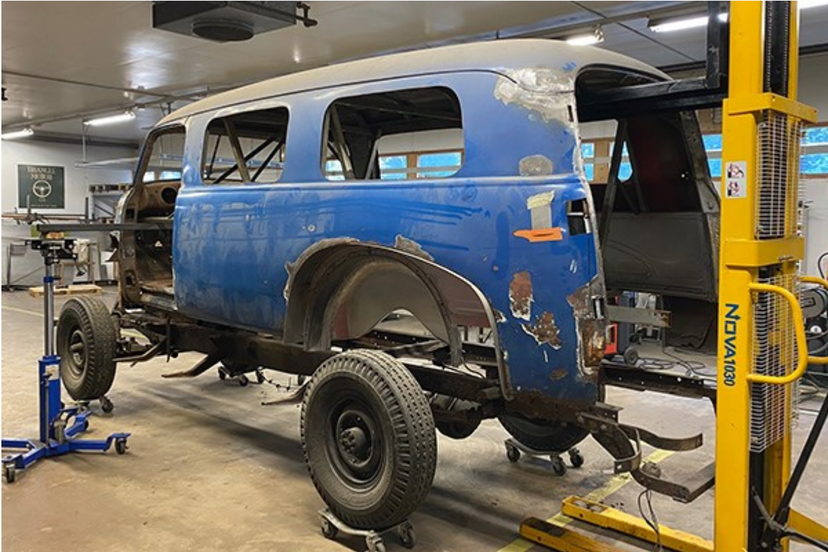
Kuva 2. 1951 vuosimallin Chevrolet Suburban täysentisöinnin alussa.