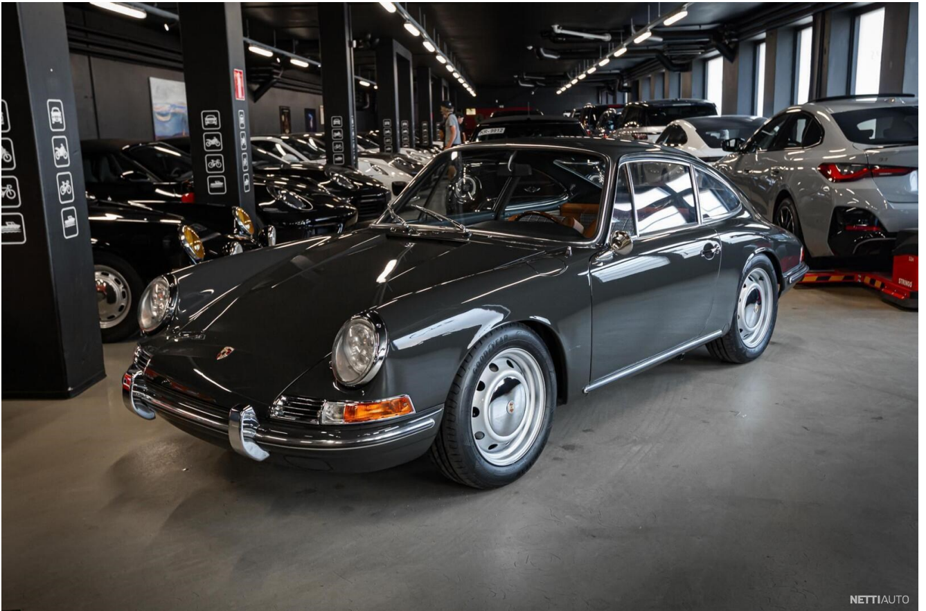
Kuva 8. Vaikka kyseinen Porsche 911 näyttää ulkoisesti täysin alkuperäiseltä yksilöltä, se on kustomoitu täyssähköautoksi.