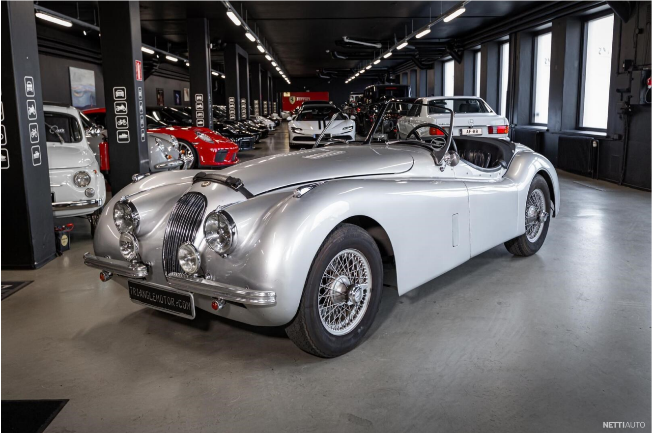
Kuva 4. Alkuperäiskuntoinen ja aikakauden tyyliä mukaillen kustomoitu Jaguar XK vuodelta 1952.