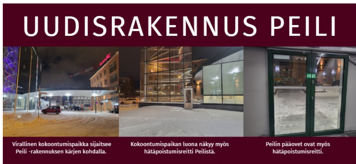
Kuva 2 Kuvakäsikirjoituksen visuaalinen ilme

Kuva 2 havainnollistaa kuvakäsikirjoituksen visuaalista ilmettä. Fonttina on käytetty Fira Sansia ja väreinä valkoista sekä Scandic Burgundia. Jokaisella kuvakäsikirjoituksen sivulla on yläotsikko sekä sen alla kuusi kuvaa. Jokaisen kuvan alla on lyhyt selitys siitä, mitä kuvassa on. Kuvakäsikirjoituksen 13 sivua on lopulliseen oppaaseen yhdistetty pidempien kirjallisten ohjeiden kanssa niin, että jokaiselle kuvakäsikirjoituksen sivulle on tehty oma kirjallinen pidempi ohje. Täten kansilehden kanssa itse turvallisuusoppaan pituudeksi tuli 27 sivua.