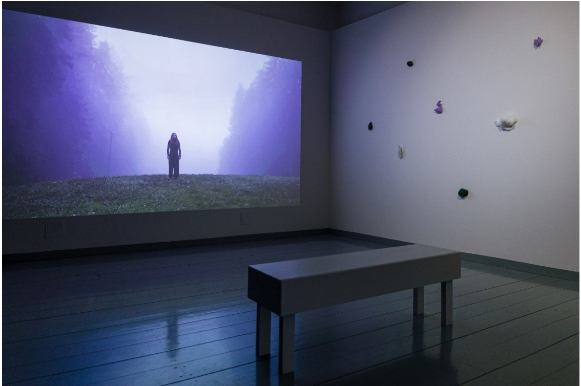
Kuva 3 Kuvassa videoteos Avaintanssi sekä osa veistosinstallaatiosta ” Ah, I love this song! ” (2025) NYTT 2025 näyttelyssä