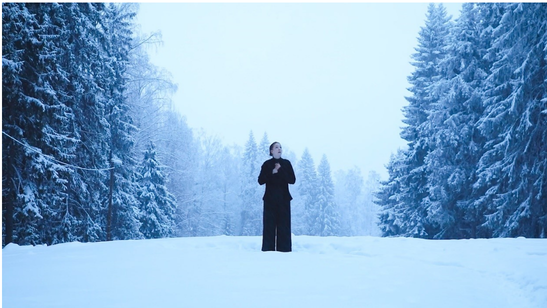
Kuva 4 Stillkuva videoteoksesta Tämä laulu (2025)

Koko teoskokonaisuuteni tekoprosessi oli jatkuvaa osaamisen ja osaamattomuuden punnitsemista. Nyt tunnistan, etten voi vaalia musikaalista taidottomuutta ikuisesti, sillä kun jatkan aiheen parissa, kehityn.