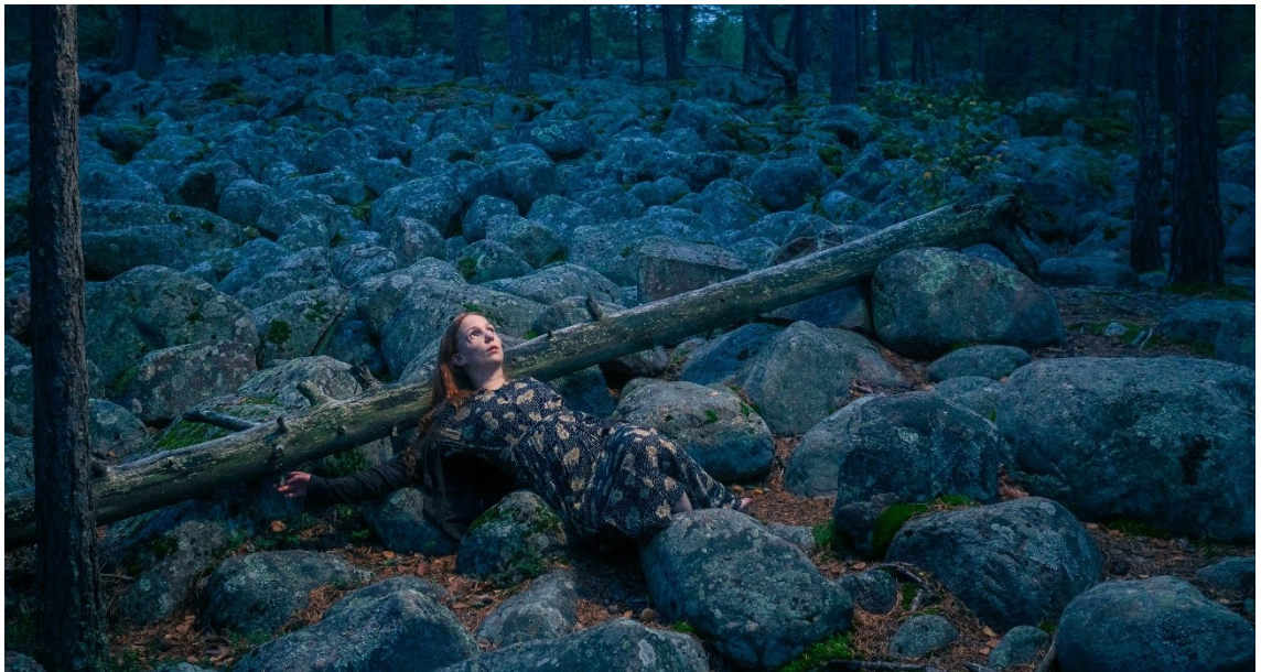
Kuva 1 Omakuva, syksy 2024 (ei voimauttava valokuva, en ole käynyt menetelmän ammatilliseen harjoittamiseen vaadittua koulutusta)

Kun näytämme valokuvissa, mitä tahtoisimme olla, saatamme usein peittää epävarmat, jopa häpeää aiheuttavat puolemme. Ne puolet, jotka ehkä kipeimmin kaipaisivat rakkautta. Oppisimmeko hyväksymään itsemme kokonaisvaltaisemmin, jos näyttäisimme varjoisat, epävarmat puolemme? Voisiko olla, että itsemme hyväksymisen vaikeudet nimenomaan kumpuavat siitä, että tahtoisimme olla jotain muuta kuin olemme?