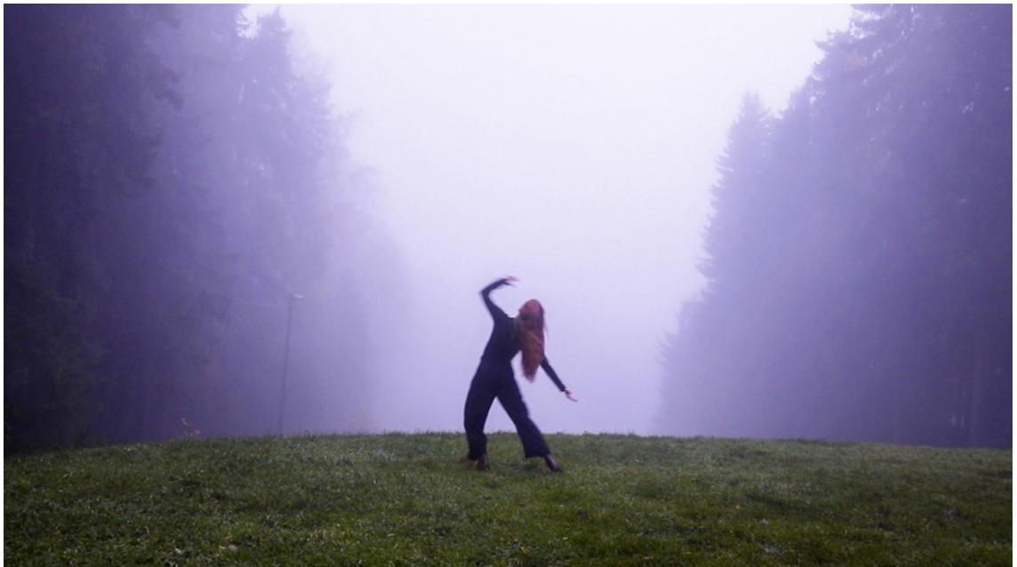
Kuva 2 Stillkuva videoteoksesta Avaintanssi (2025)

20 vuotta lapsuuden tanssitunneista, tahdon tanssia avaintanssin jälleen. Kiipeän auringonnousun aikaan kukkulalle. Asetan kameran jalustalle ja alan tanssimaan. Avaintanssissa ei ole kyse oikeasta koreografiasta tai täydellisestä rytmistä. Siinä on kyse kertomuksesta.