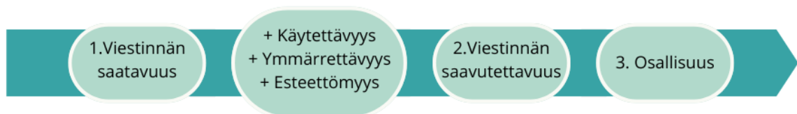
Kuvio 2 Viestinnän saatavuudesta viestinnän saavutettavuuteen ja osallisuuteen mukailten Hirvonen & Kinnunen (2020, kuvio 6) pohjalta

Kinnunen ja Hirvonen (2020) ovat hahmotelleet jatkumon (kuvio 2), joka kuvaa saavutettavuuden osa-alueita, kun tavoitteena on osallisuuden toteutuminen. Ollakseen saavutettavaa viestinnän kolme vaihetta on toteuduttava. Ensimmäiseksi viestinnän on oltava saatavilla, eli tieto tai palvelu on käyttäjän saatavilla. Ollakseen saavutettavampaa, on kiinnitettävä huomiota viestinnän käytettävyyteen, ymmärrettävyyteen sekä esteettömyyteen. Käytettävyydellä tarkoitetaan käyttäjän kokemusta, esimerkiksi tietokoneen ohjelman saavutettavuus tai jonkin järjestelmän hallintaa ja toimivuutta käyttötilanteessa. Ymmärrettävyyttä on, että tieto on vastaanottajalle ymmärrettävässä muodossa, esimerkiksi tekstin ominaisuus. Esteettömyydellä tarkoitetaan, että tuote tai palvelu on fyysisesti esteetöntä.