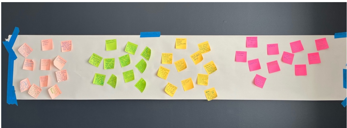
Kuva 1 : Työpajan tuotos

Työpajan tuotos syntyi työntekijöiden vastauksista, jotka olivat tunnisteetonta eli anonymiä. Anonyymit vastaukset olivat jaoteltu erivärisiin tarralappuihin, jotka kerättiin seinällä sijaitsevaan plakaattiin (Kuva 1). Työpajassa koettiin hyvänä se, että olin läsnä ja työntekijät saivat kysyä, jos jokin kysymys vaati tarkennusta.