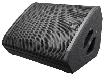
KUVA 3. Kulmamonitori