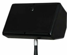
KUVA 5: Hotspot-monitori

Viihdekonserttia suunnitellessa kapellimestarilta usein kysytään näkemystä tekniseen toteutukseen ja varsinkin siihen, kuinka hän haluaisi järjestää oman monitorointinsa. Perustiedot äänentoistoon liittyvistä asioista on hyvä olla hallinnassa. Varsinaisen järjestelmäsuunnittelun tekevät kuitenkin muut tahot.