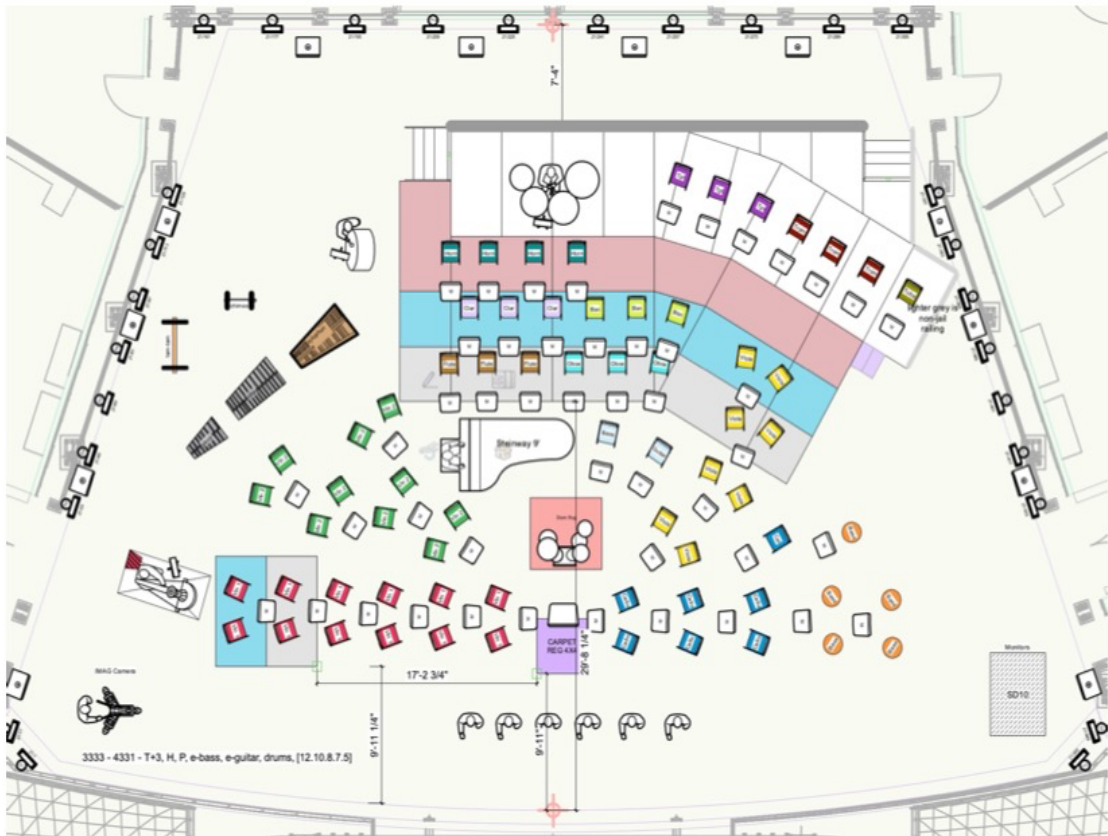
KUVA 7: Lavakartta "Rajaton San Diego Stage plot". Laajempi järjestelmä, jossa osalla soittajista on omat monitorit ja osalla soittajista monitorointi pareittain. Monitoreina voi käyttää toiveiden mukaan korvamonitoroitu, kulmamonitoroitu tai hotspot-tyyppisiä monitoroitu. Saliäänänen kannalta korvamonitoroinnilla saavutetaan paras lopputulos. Laulusolisteilla korvamonitorit. (Herkman, I. 2025)