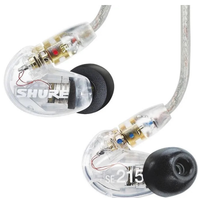
KUVA 1. Korvamonitorikuuloke, yleismallinen