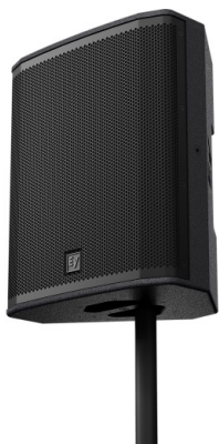
KUVA 4: Sidefill-monitori