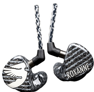
KUVA 2. Korvamonitorikuuloke, korvakäytävästä tehdyn muotin avulla tehty henkilökohtainen malli

Kuten klikkiin johtaminen ja soittaminen, myös korvamonitoreiden käyttäminen vaatii totuttelua ja suoranaista harjoittelua. Edellisessä kappaleessa visioitiin klikin käytön opiskelua musiikkiopintojen yhteydessä. Mikäli tällainen opintojakso toteutuisi, korvamonitorien käyttö olisi loogista sisällyttää siihen.