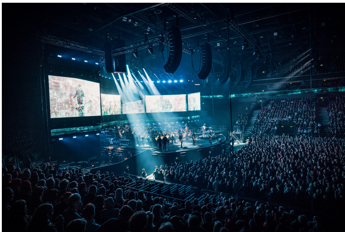
KUVA 8: Apulanta ja Sinfonia Lahti Nokia-Areenassa, Tampereella 2024.

Joskus konsertti tapahtuu sellaisessa paikassa, jota ei ole lähtökohtaisesti tehty musiikin esittämiseen. Tällaisia saattavat olla esimerkiksi areenat (Kuva 8), jäähallit, festivaalilavat ja muut ulkotilat. Näiden tilojen akustiikka harvoin tarjoaa konserttisalin kaltaista esitystä helpottavaa kuulokuvaa.