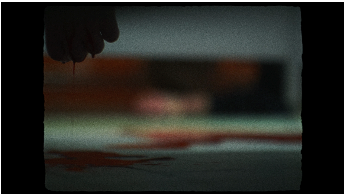
KUVA 2: Lähikuva itsemurhan tehneen Ollin kädestä (Saarna 2023, 00:08:01)