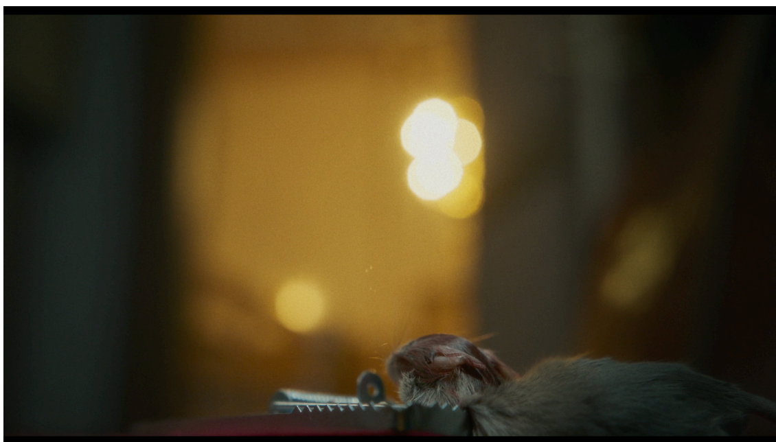
KUVA 4: Rotta kuolleen loukussa kirkossa (Saarna 2023, 00:07:03)

Saarnassa (2023) pappi, Hannes, ja suntio keskustelevat rotasta, jota suntio yrittää pyydystää, mutta Hannes yrittää suojella. Rotta on samalla vertauskuva Ollista. Hannes löytää rotan ja antaa tälle juustoa, mutta ei lopulta pysty pelastamaan rotan joutumista suntion pyydykseen. Lyhytelokuvassa nähdään leikkausta nykypäivän ja takauman välillä, kun Hannes löytää Ollin kuolleen vessasta ja rotan kuolleen loukusta (kuvat 4–5).