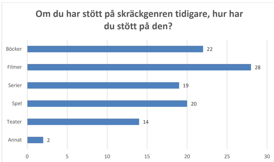
Bild 2. Ett liggande stapeldiagram av svaren på frågan "Om du har stött på skräckgenren tidigare, hur har du stött på den" från enkäten.

Majoriteten av enkätsvararna (26 av 29) hade interagerat med skräckgenren tidigare, och majoriteten av dessa hade gjort det via skräckfilmer (28 av 29 svarande). Efter det var böcker mest sett (22 av 29), sedan spel (20 av 29), serier (19 av 29), och teater (14 av 29). Två svarare hade interagerat med skräckgenren via andra medier, en via audiodrama och en annan via vandrande teater.