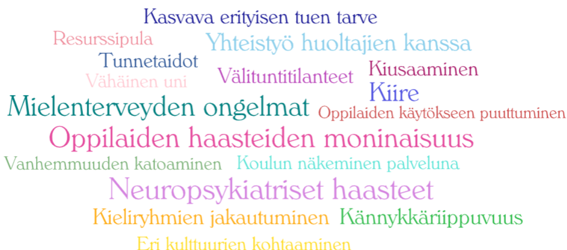
Kuva 3. Koululle suunnatusta sekä Sosionomien uraverkosto -ryhmälle suunnatusta kyselystä nousseita keskeisiä haasteita kouluympäristössä.

Kummastakin tutkimusaineistosta nousi esiin selkeitä ja toistuvia haasteita, joita kouluympäristössä kohdataan ja joihin vastaajat kokivat tarvittavan tukea.