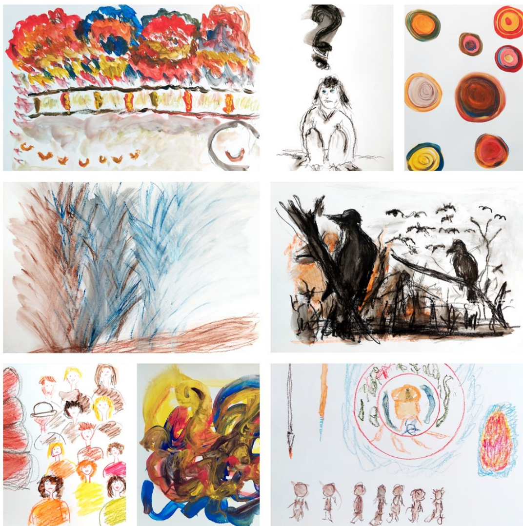
Kuva 9. Kahdeksan teoskuvan kollaasissa on Tatamuri® museossa - taideryhmän valitsemat teokset joulukuussa 2024 esillä olleeseen näyttelyyn. Teosten nimet ovat (vas. ylh.) Seitsemän sisarta; Maailma on kysymyksiä täynnä; Värien ilotulitus; (vas. kesk.) Sininen hetki elämässä; Marraskuu; (vas. alh.) Kuuleeko kukaan; Eläköön elämä; Seitsemän sisarta.