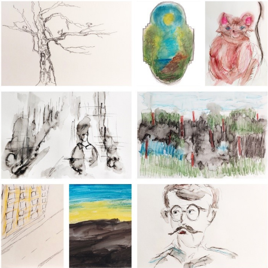
Kuva 10. Kahdeksan teoskuvan kollaasissa on Tatamuri® museossa - taideryhmän valitsemat teokset maaliskuussa 2025 esillä olleeseen näyttelyyn. Teosten nimet ovat (vas. ylh.) Kotipuu; Barokki; Hiiri; (vas. kesk.) Työn ääniä; Tampereen valot näkyy; (vas. alh.) Katu ja koulu; Yö; Oma kuva.