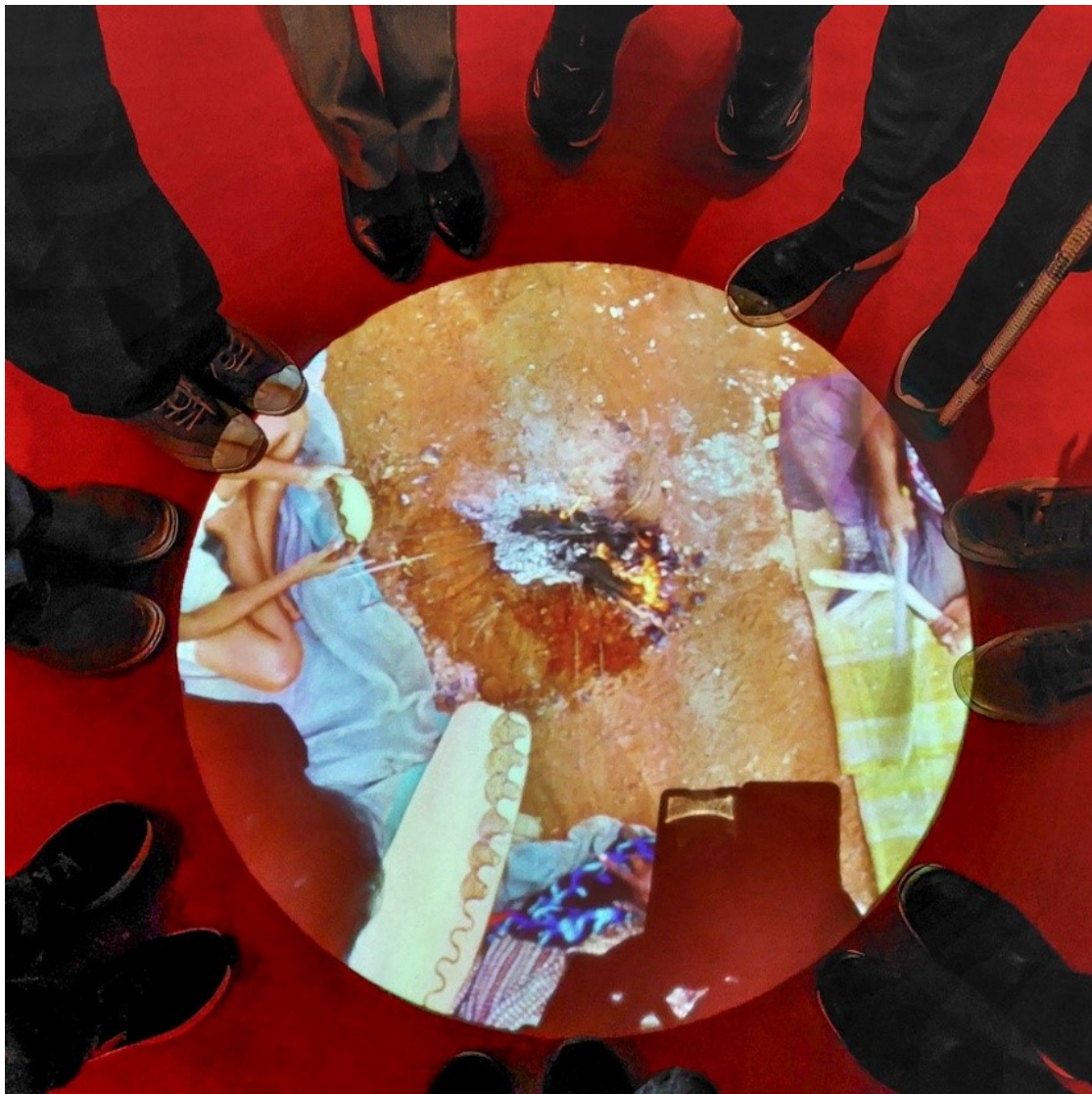
Kuva 1. Taideryhmän osallistujat kerääntyivät savuavan nuotio ympärille. Nuotio oli heijastettu kuva Vapriikin Songlines-näyttelyn lattialla. Se symboloi myös taideryhmälle yhteen kerääntymistä ja vaikutus oli rauhoittava.

että teosten valitseminen vain yhdestä kerroksesta olisi ollut parempi ratkaisu keskittymisen kannalta.