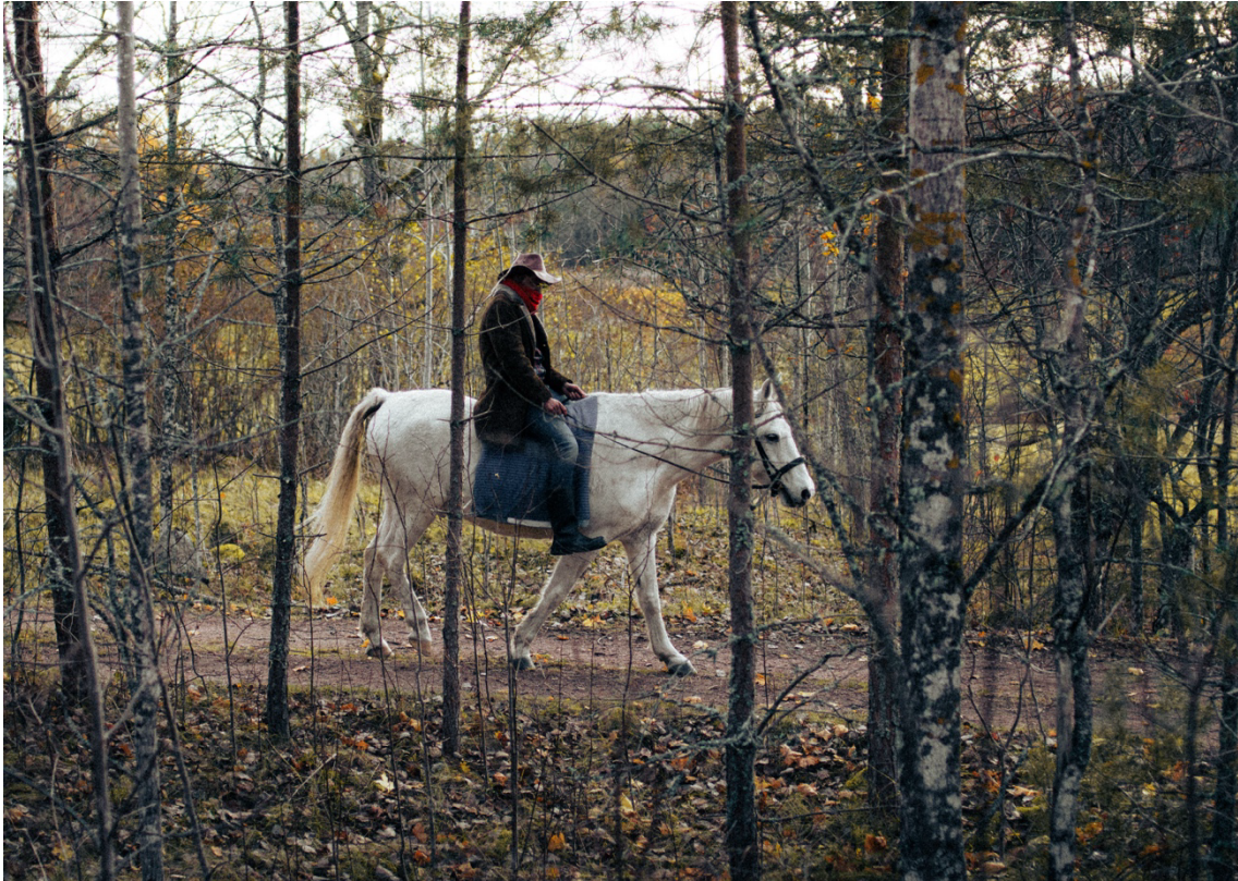
Figur 3: Cowboyen rider längs grusvägen. (Albin Ljungqvist, 2024)

Redan då scenen förbereddes och övades, innan olyckan skedde, observerades varningssignaler. Hästen Aapi, som varit lugn under förmiddagen, blev mindre samarbetsvillig vid den nya inspelningsplatsen. Flera respondenter noterade att hästen upprepade gånger vände om eller tvekade inför att gå in i skogsdungen, som om något inne i skogen skrämde eller irriterade den. En av respondenterna förklarar: