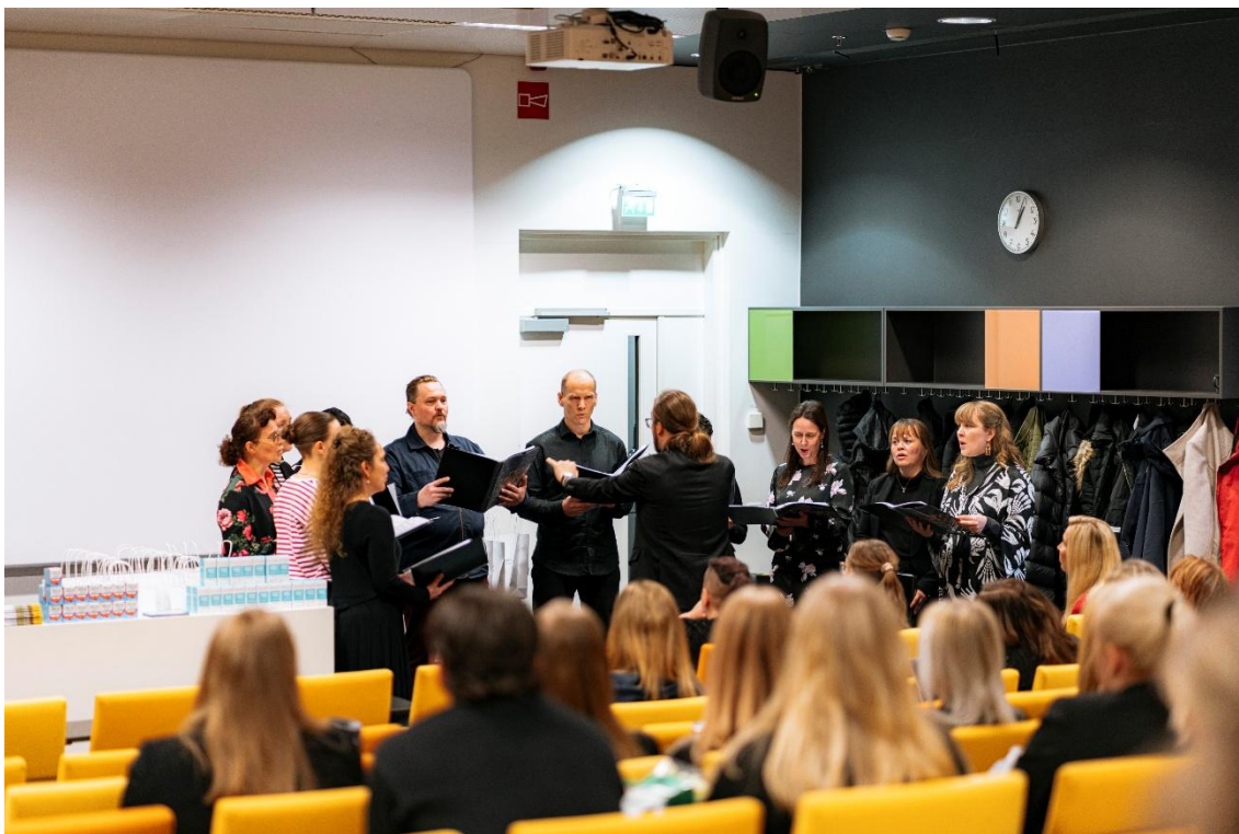
Kuva 4 Kuoro esiintymässä.