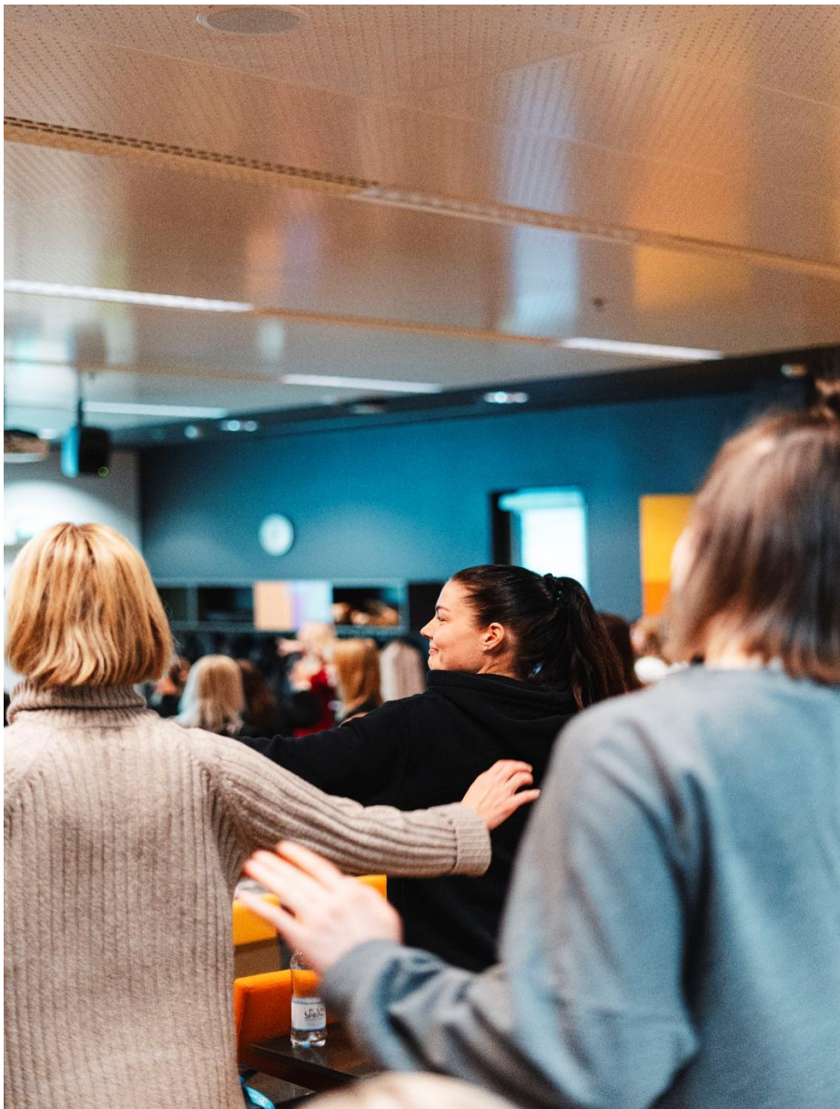
Kuva 5 Taukojumppa.