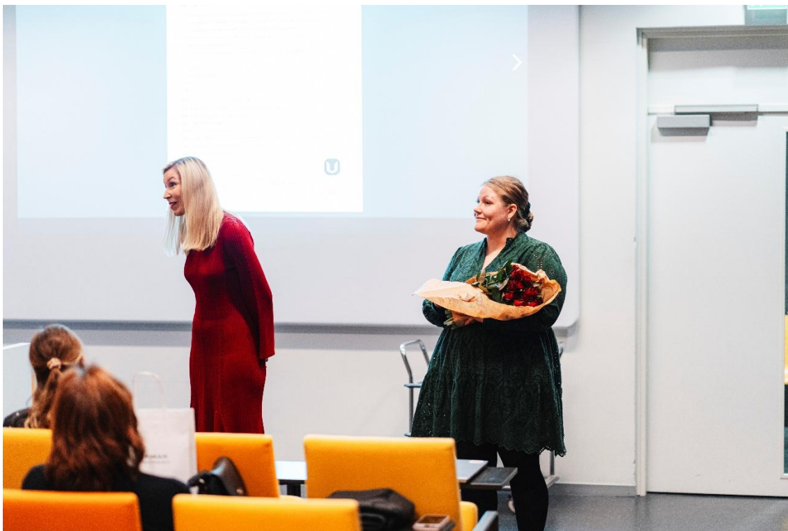
Kuva 10 Ohjaavan opettajan puhe ennen ruusujen jakoa.