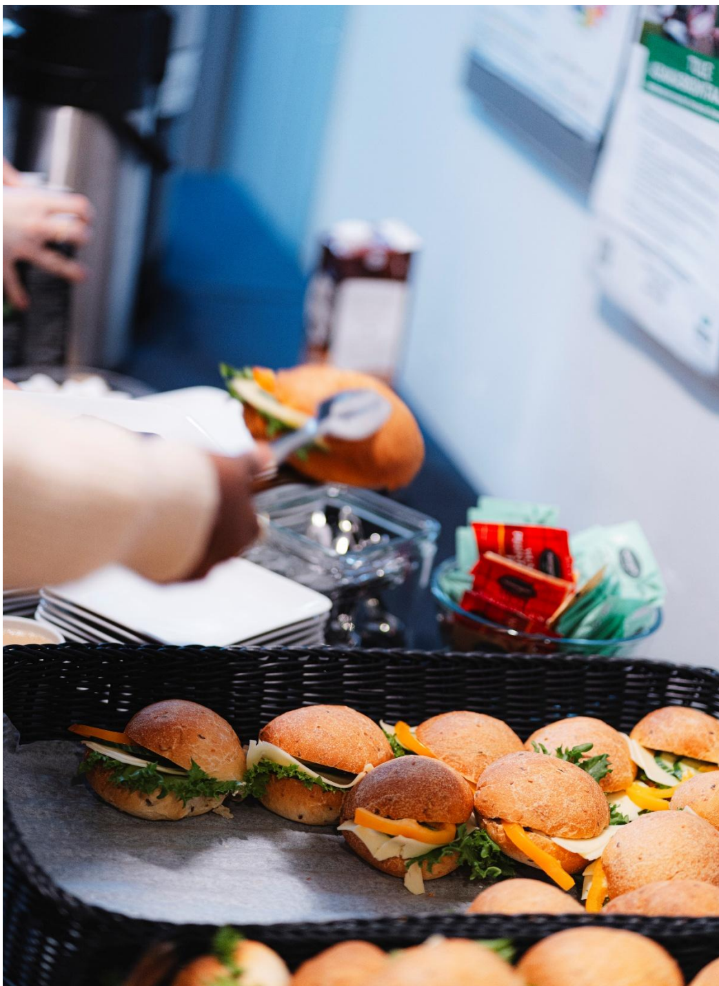
Kuva 6 Kahvitarjoilu.