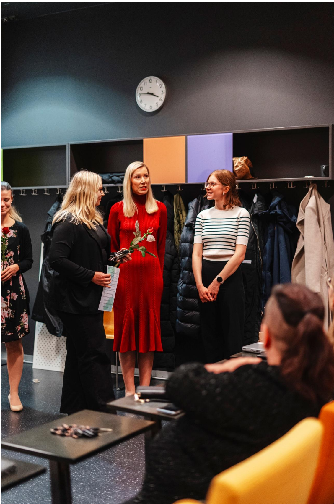
Kuva 9 Ruusujen jaon tunnelmia.