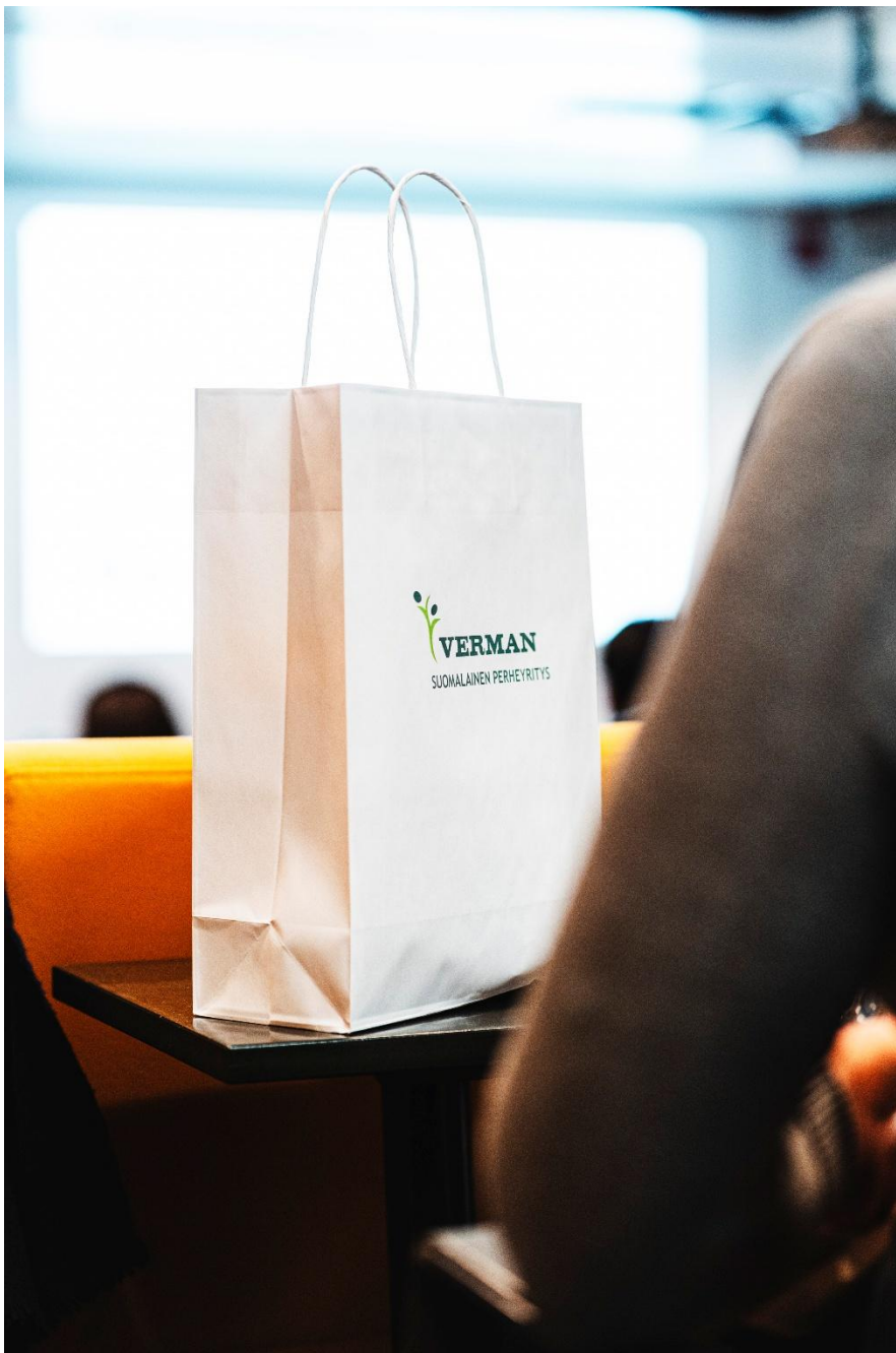
Kuva 3 Vermanin tarjoamat esittelytuotteet valmiina lahjakkasseissa.