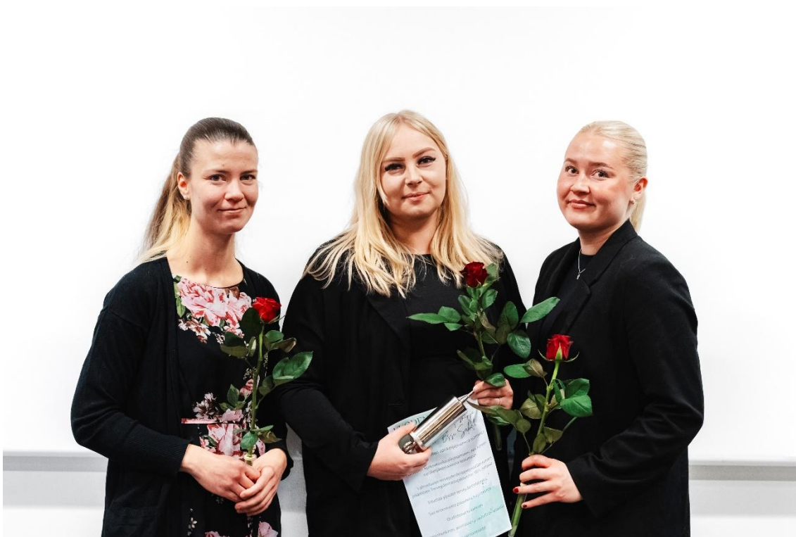
Kuva 11 Vuoden terveydenhoitajaopiskelijan palkitseminen kultaisella ruiskulla ja ruusut.