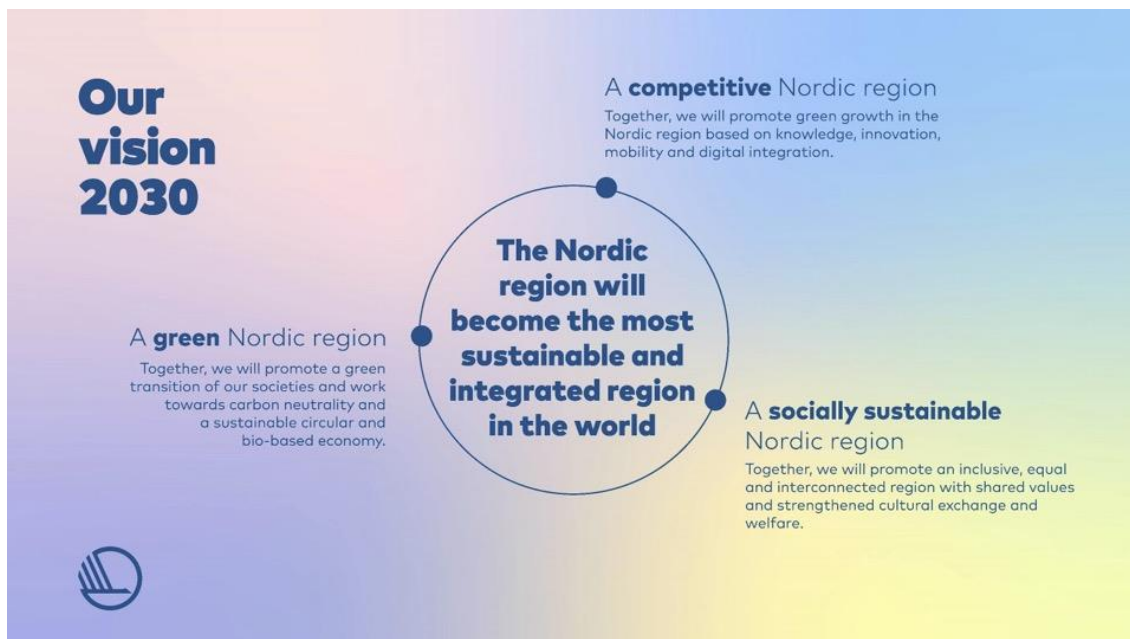
Bilaga 3. Karta över Vision 2030 och dess 3 delmål. (Nordiska ministerrådet, 2020)