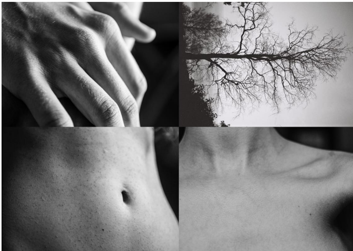
Bilaga 1. Ett av Lisa Schachingers verk för NU25 To Belong (Lisa Schachingers, 2024)

exempel på teman som projektet ställt ut. Tanken med utställningarna var att studerandes fotografier skulle ställas ut på offentliga platser utanför skolan, och att det även skulle finnas en hemsida men fotografierna då utställningarna tas ner.