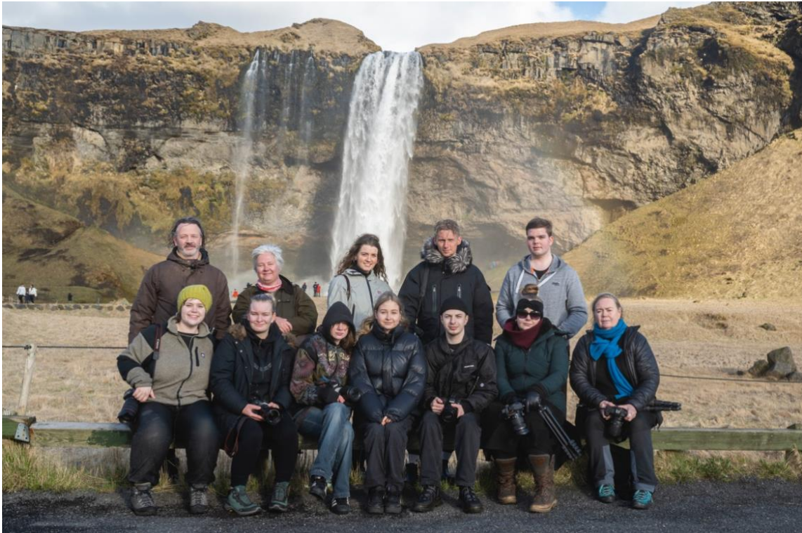
Bilaga 2. Gruppbild från en samarbetsresa till Island 2023. (Nina Sederholm, 2023)